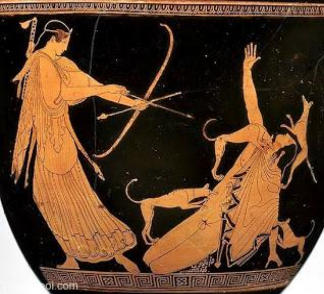
Η Άρτεμη σκοτώνει τον Ακταίωνα Αττικός Κρατήρας, 460 π. Χ., Βοστώνη

Ο Ακταίωνας, μανιώδης και αδίστακτος κυνηγός, βγήκε μια μέρα κάπου στην Αρκαδία για κυνήγι μαζί με τους σκύλους του. Κατά τύχη, συνάντησε την Άρτεμη σε ένα ποτάμι να λούζεται. Αυτή εξαγριώθηκε που την είδε γυμνή και για να μην διαδοθεί το περιστατικό, τον μεταμόρφωσε σε ελάφι. Οι σκύλοι του δεν μπόρεσαν να αναγνωρίσουν ότι το ελάφι είναι το αφεντικό τους και έτσι κατασπάραξαν τον Ακταίωνα.