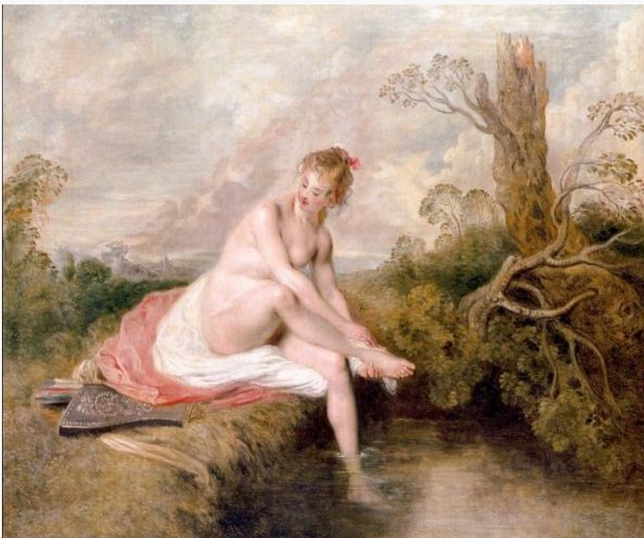
Άρτεμη λουόμενη Jean-Antoine Watteau, 1715-16