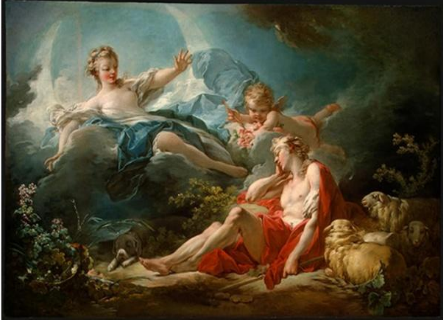
Άρτεμη και Ενδυμίωνας Jean-Honoré Fragonard, 1753-1756

https://www.nga.gov/content/ngaweb/features/slideshows/18th-century-france-boucher-and-fragonard.html