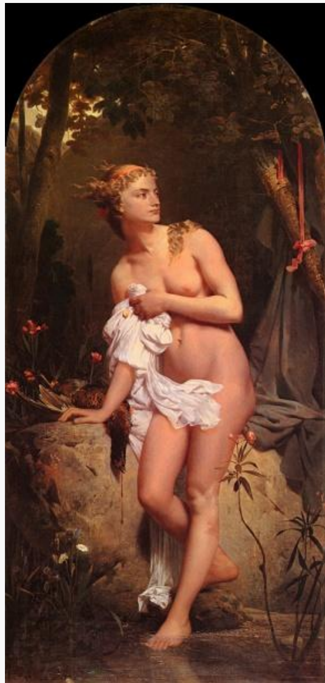
Άρτεμη Charles Gleyre