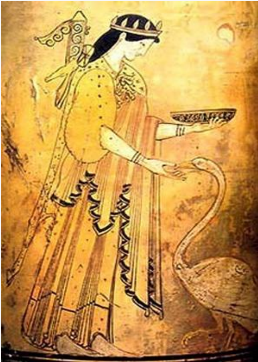
«Η Άρτεμη ταΐζει κύκνο», άττικό έρυθρόμορφο αγγείο, 4ος αι. π.Χ. Μουσείο State Hermitage, Αγία Πετρούπολη, Ρωσία