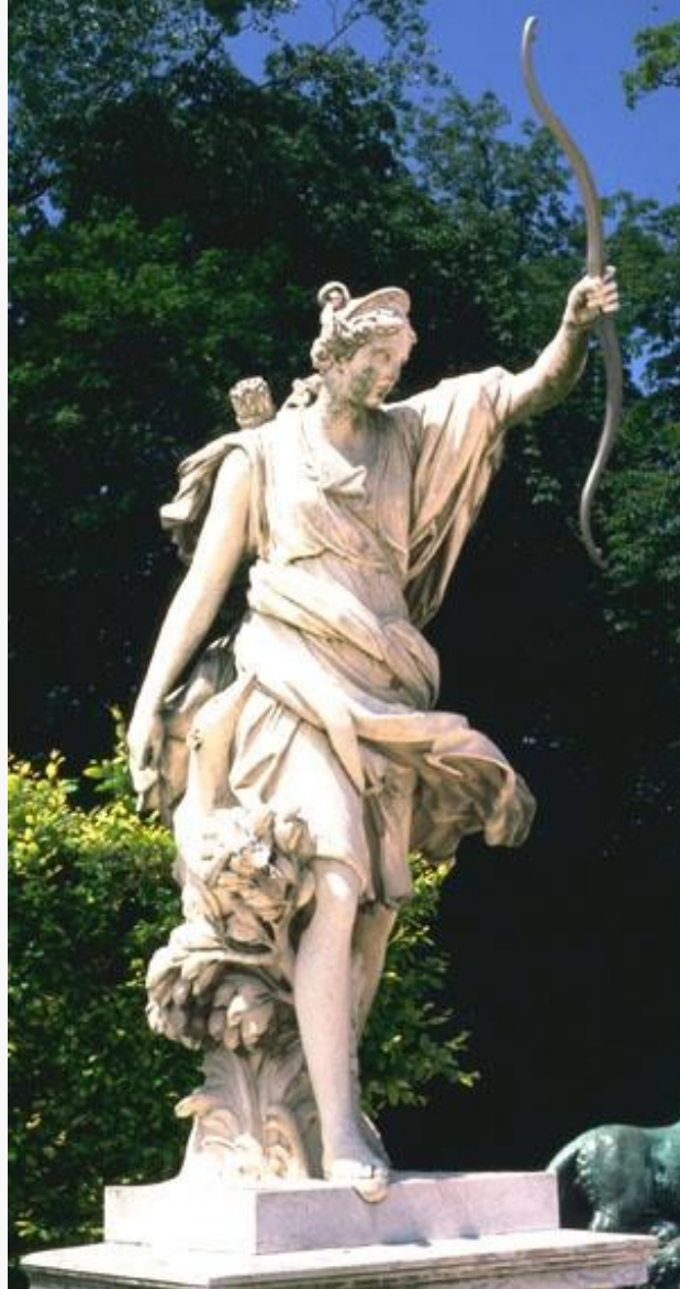
Άρτεμη Κυνηγέτιδα Κήποι Βερσαλλιών, Γαλλία