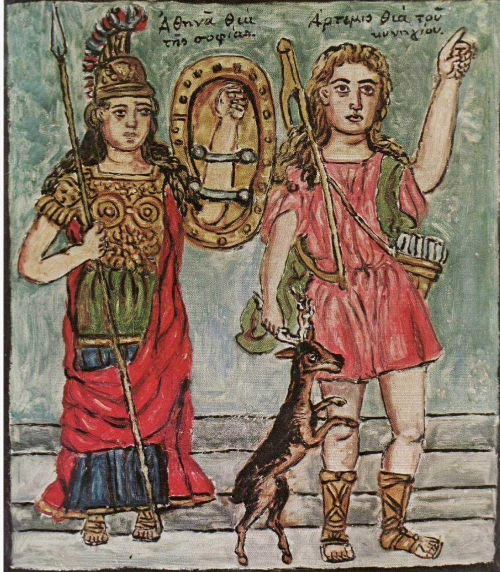
Η Αθηνά και η Άρτεμη Θεόφιλος , 1927-1934 Εθνική Πινακοθήκη, Αθήνα