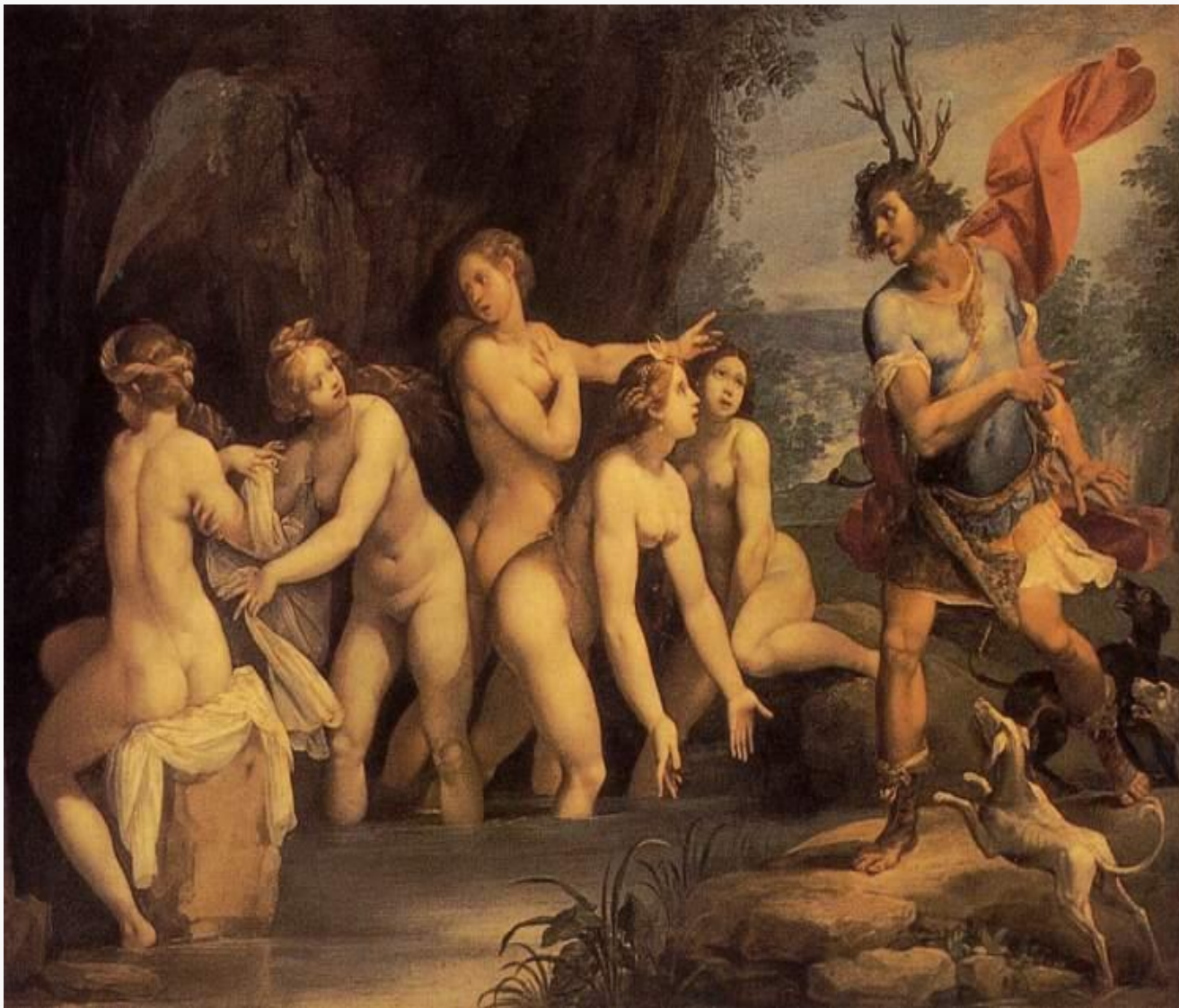
Άρτεμη ,νύμφες και Ακταίωνας, 1603-06 Giuseppe (d'Arpino) Cesari (Cavaliere)