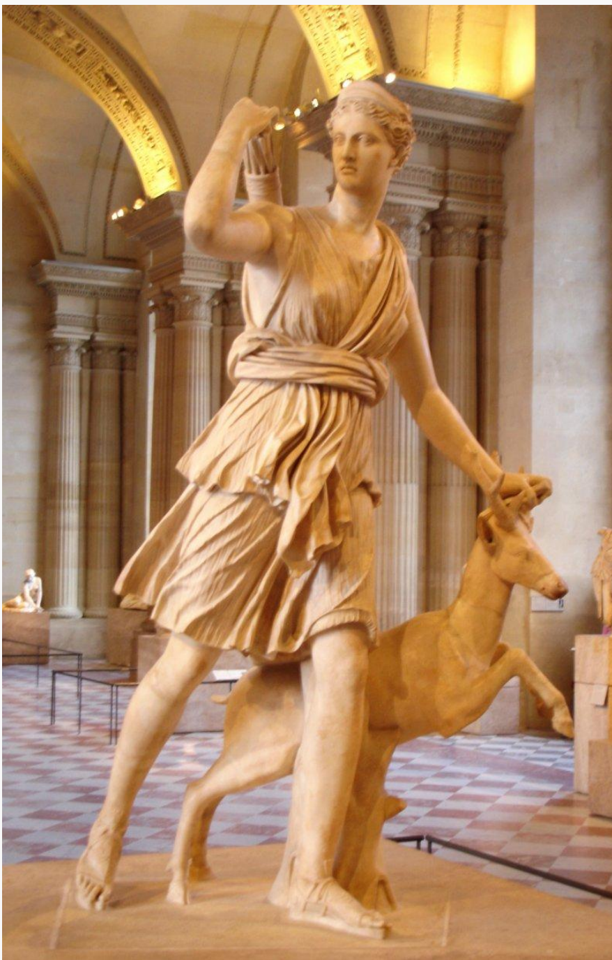
Άρτεμη με ελάφι (Γνωστή ως Άρτεμη των Βερσαλλιών)