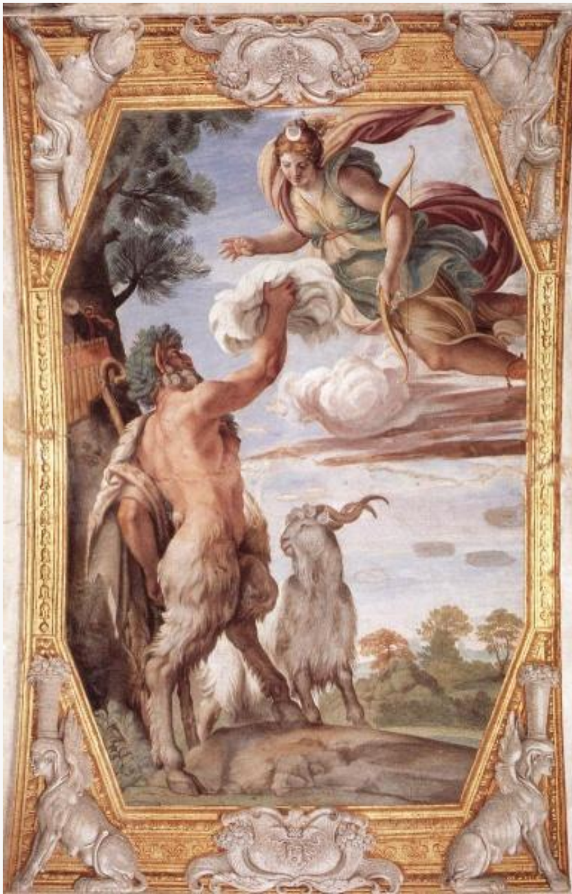
Προσφορά στην Άρτεμη Annibale Carracci, 1597 - 1602