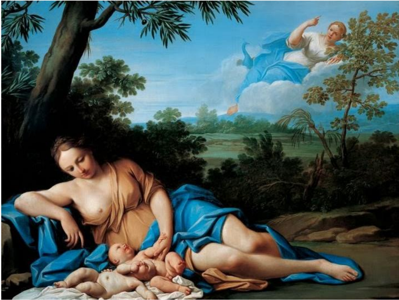
Η γέννηση της Άρτεμης και του Απόλλωνα Marcantonio Franceschini (1692–1709)