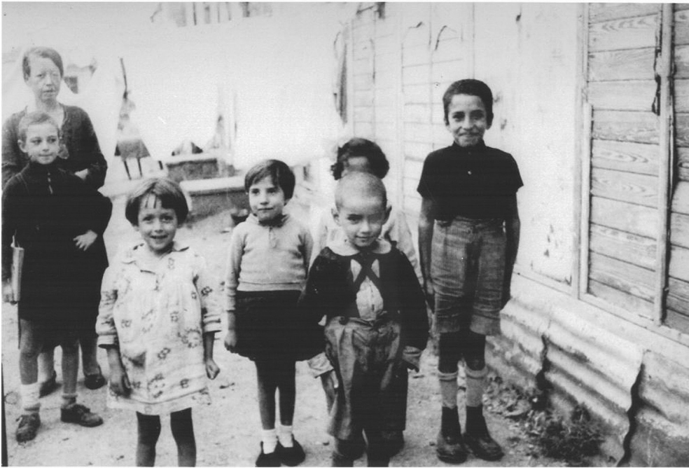
Εβραία παιδιά σε φτωχογειτονιά της Θεσ/νίκης, Σεπτ. 1941.

ρία τους και ποτέ δεν πήραν τα εύσημα που τους αξίζουν. Κάποιες φορές, ο άνθρωπος κάνει το καλό χωρίς να αναζητά ειδική μνεία ή δόξα, παρά μονό αυτό που του υπαγορεύει η συνείδησή του. Και αυτό ίσως είναι ένα από τα ηθικά διδάγματα αυτής της ιστορίας.