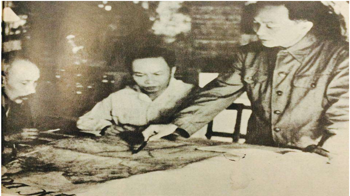
Φωτογραφία Νο3: Ο Στρατηγός Γκιάπ (δεξιά) και ο Χο Τσι Μινχ (αριστερά) καταστρώνουν τα σχέδια τους επί χάρτου σε άγνωστη τοποθεσία του ορεινού Τονκίνου http://www.mixanitouxronou.gr/gkiap-o-stratigos-pou-sto-vietnam-sinetripse-protatous-gallous-ke-meta-tous-amerikanous-o-kathigitis-istorias-pou-egine-o-protos-antartis-ke-enas-apo-tous-megaliterous-sigchronous-stratigos/