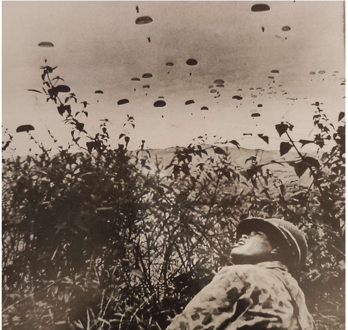
Φωτογραφία Νο7: Ρίψη Γάλλων αλεξιπτωτιστών στο Ντιεν Μπιεν Φου, υπό την παρακολούθηση ενός Βιετναμέζου στρατιώτη

(Ντιέν Μπιέν Φού 1954, Μεγάλες Μάχες Νο 29, Περισκόπιο 2007)