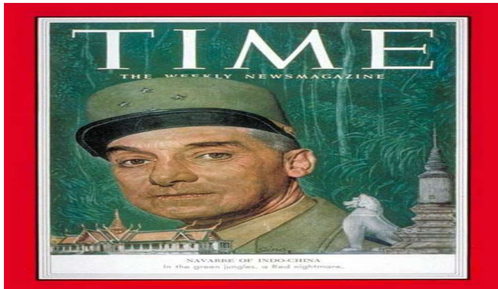
Φωτογραφία Νο4: Ο Στρατηγός Henri Navarre (Ντιέν Μπιέν Φού 1954, Μεγάλες Μάχες Νο 29, Περισκόπιο 2007)