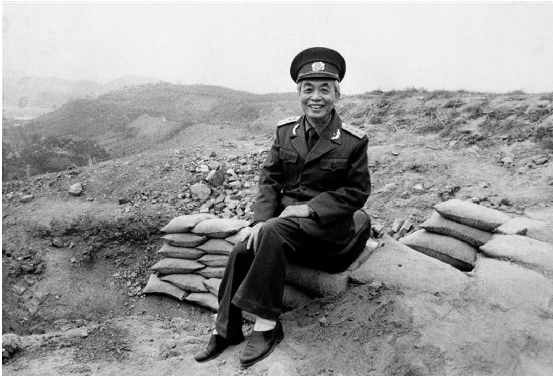
Φωτογραφία Νο5: Ο Στρατηγός Vo Nguyen Giap

https://www.ethnos.gr/todayinhistory/article/206764/ntienmpienfoyenaszaxaroplasthsp-rosferepikrakaithanatostoysgalloyskaienaskathhghthsistoriasafhsemetexetasteoystoyseyropaiouy