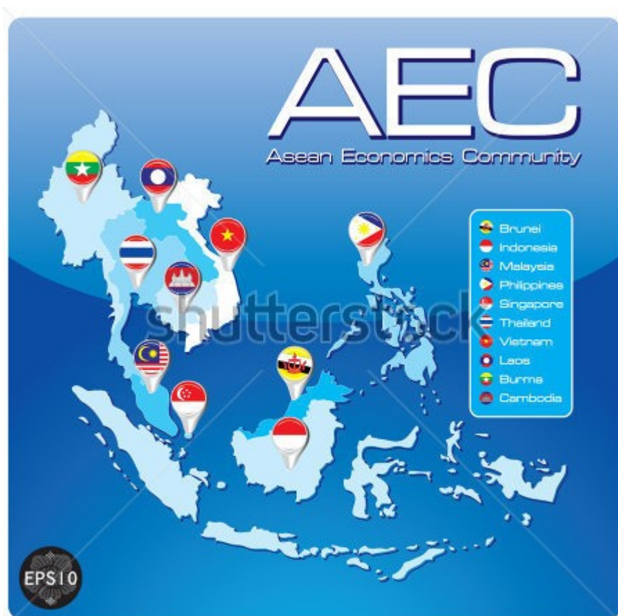
Εικόνα 1: Χώρες ASEAN

Σήμερα εκτός από τα 5 κράτη-ιδρυτές της Ένωσης (Ινδονησία, Μαλαισία, Ταϊλάνδη, Φιλιππίνες και Σιγκαπούρη) έχουν προσχωρήσει σε αυτή και το Μπρούνεϊ (7/1/84), το Βιετνάμ (28/7/85), το Λάος και η Μιανμάρ (23/7/97) και τέλος η Καμπότζη (30/4/99) με αποτέλεσμα να αριθμεί πλέον δέκα κράτη-μέλη.