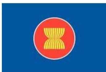
Εικόνα 2: Σημαία ASEAN

Η θέληση για συνεργασία, ομόνοια, ενότητα και καλή γειτνίαση γίνεται ακόμα περισσότερο κατανοητή αν ρίξουμε μια ματιά στη σημαία η οποία έχει υιοθετηθεί ως σύμβολο της ASEAN.