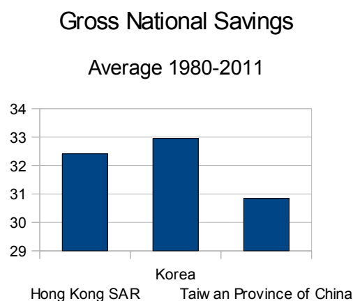
Εικόνα 8:

Σε αυτούς τους πίνακες παρουσιάζονται οι συνολικές αποταμιεύσεις των κρατών ως ποσοστό του ΑΕΠ κατά μ.ο τη χρονική περίοδο 1980-2011 70 .