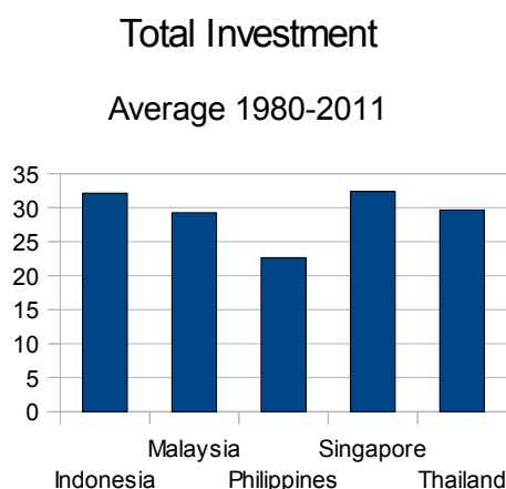
Εικόνα 5:

Πιο συγκεκριμένα κι αναφορικά με τις συνολικές επενδύσεις: