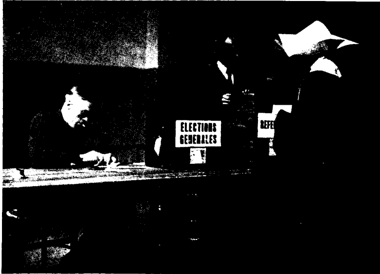
Ο φακός αποθανάτισε σκηνές από την πρώτη ψηφοφορία των γυναικών. Μια καλόγρια και μια γυναίκα 104 χρόνων.