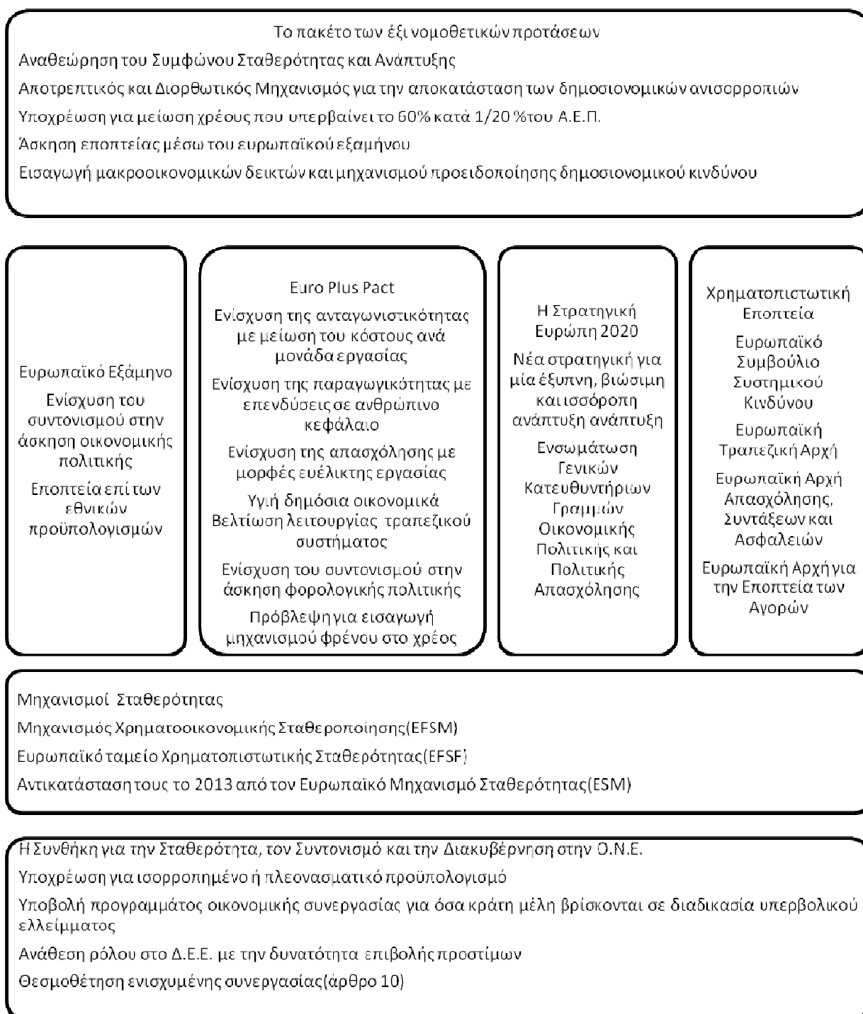
Σχήμα 2. Η αρχιτεκτονική της ευρωπαϊκής οικονομικής διακυβέρνησης 160