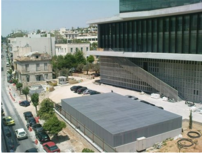
Εικ.5 Οδός Χατζηχρήστου μετά την κατεδάφιση των πολυκατοικιών. Νότια όψη ΝΜΑ. Λήψη από ΝΑ.

Της κατεδάφισης εξαιρέθηκαν, μετά από αποφάσεις αναστολής κατεδάφισης του ΣτΕ (2339/2009, 2341/2009), στο οποίο είχαν προσφύγει κινήσεις πολιτών, τα δύο γωνιακά νεοκλασικά κτίρια: το ένα στη συμβολή Μακρυγιάννη και Χατζηχρήστου, που χρονολογείται στα 1900 και το άλλο στην άλλη γωνία, επί των οδών Χατζηχρήστου και Μητσαίων που χρονολογείται στα 1930.