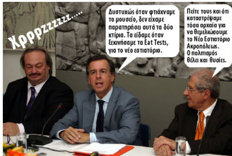
Εικ. 10 Σατυρικό σχόλιο της αντιμετώπισης των αρχαίων αλλά και των νεότερων μνημείων στην περιοχή του Μακρυγιάννη από την τότε πολιτική ηγεσία (Μ. Λιάπης, Υπουργός Πολιτισμού και Χ. Ζαχόπουλος, Γενικός Γραμματέας Υπουργείου Πολιτισμού) και τον Διευθυντή του ΝΜΑ Δ. Παντερμανλή.

«Ο πολιτισμός θέλει και θυσίες: Νέο εστιατόριο Ακροπόλεως» διαβάζουμε σε δημοσίευμα ( Athens Voice , 16/10/2007):