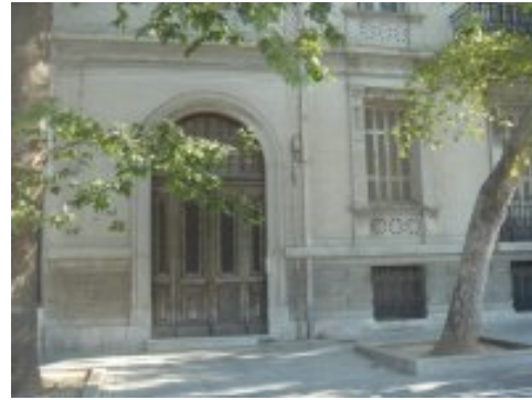
Εικ.8 Μεσοπολομεμικό κτίσμα στον αριθμό 17 της Διονυσίου Αεροπαγίτου