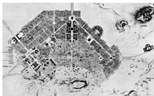
Εικ.11 Η πολεοδομική πρόταση των Κλεάνθη-Schaubert για την πόλη των Αθηνών του 1833