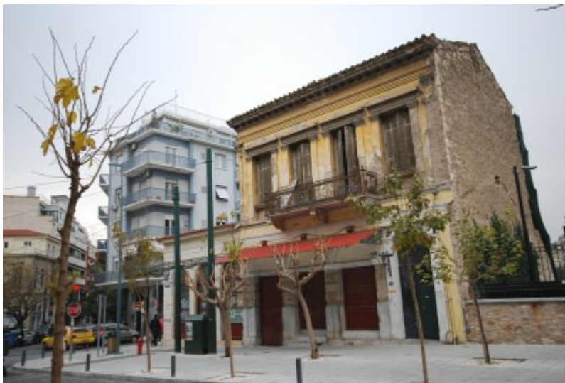
Εικ.6 Διατηρητέο κτίσμα στη συμβολή των οδών Χατζηχρήστου και Μακρυγιάννη

Της κατεδάφισης εξαιρέθηκαν, μετά από αποφάσεις αναστολής κατεδάφισης του ΣτΕ (2339/2009, 2341/2009), στο οποίο είχαν προσφύγει κινήσεις πολιτών, τα δύο γωνιακά νεοκλασικά κτίρια: το ένα στη συμβολή Μακρυγιάννη και Χατζηχρήστου, που χρονολογείται στα 1900 και το άλλο στην άλλη γωνία, επί των οδών Χατζηχρήστου και Μητσαίων που χρονολογείται στα 1930.