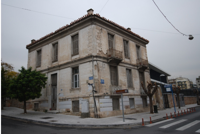
Εικ.7 Διατηρητέο κτίσμα στη συμβολή των οδών Χατζηχρήστου και Μητσαίων

Τα σχετικά δημοσιεύματα στον αθηναϊκό τύπο παρουσιάζουν μια κάποια αμηχανία: «Κατεδάφιση-ανάσα για το Νέο Μουσείο ή καταστροφή του αρχιτεκτονικού ιστού της περιοχής;» ( Το Βήμα , 28/03/2008). Η αμφιθυμία που διέπει τον Τύπο της εποχής, αποτυπώνεται και στις συζητήσεις μου με τους κατοίκους. Σύμφωνα με έμμεσες μαρτυρίες οι αντιδράσεις των ενοίκων των πολυκατοικιών προς κατεδάφιση γίνονται μέσο διαμαρτυρίας για τις προσωπικές τους απώλειες: δηλαδή εν μέρει «οφείλονταν και στο συναισθηματικό κομμάτι “με διώχνετε από το σπίτι μου”, αλλά και στο οικονομικό “τι μπορώ να αγοράσω με αυτά που μου δίνετε;”», όπως μου μεταφέρουν οι πληροφορητές με τους οποίους συνομίλησα.