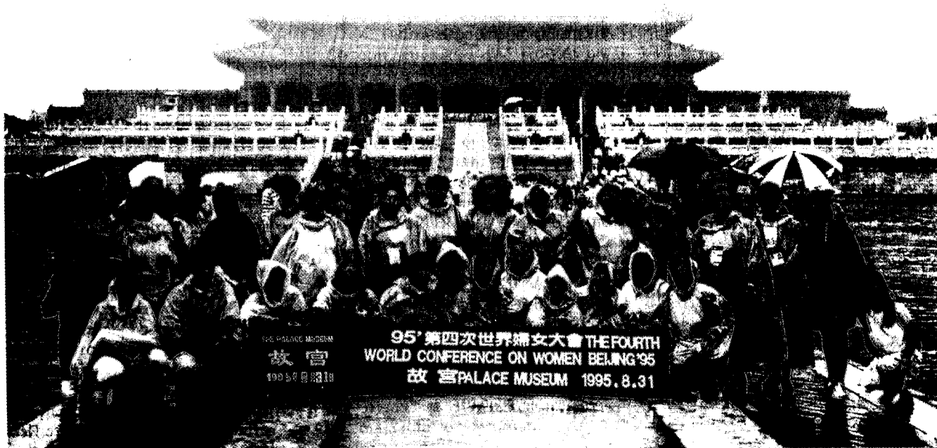
Ελληνίδες εκπρόσωποι Γυν. οργανώσεων στο αυτοκρατορικό παλάτι (Απαγορευμένη Πόλη).

ρεάζουν την ποιότητα ζωής της κοινωνίας, και ιδιαίτερα των γυναικών.