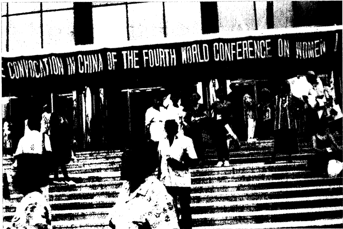
Εκπρόσωποι γυν. οργανώσεων στο συνεδριακό κέντρο του FORUM.

M.M.E., με αίτημα την παραμονή του Forum στο Πεκίνο. Διαφορετικά, ζητούσαν να αναβληθούν το Forum και η Διάσκεψη και να μεταφερθούν σε άλλη χώρα.