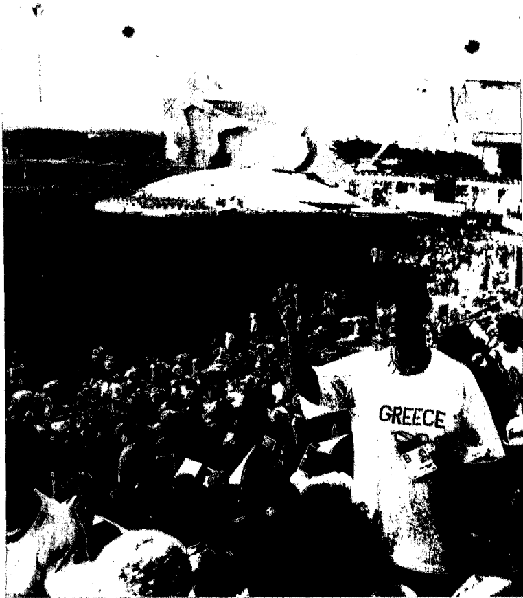
Η Γ. Γραμματέας Τέρψη Λαμπρινοπούλου στην έναρξη του FORUM.

Τα διάφορα αυτά όργανα του ΟΗΕ και οι επιτροπές προετοίμασαν πυρετωδώς το Forum. Μέσα στο 1994 και 1995 έγιναν προπαρασκευαστικές διασκέψεις και Fora, κατά γεωγραφικά διαμερίσματα, στην Ασία, στη Τζακάρτα της Ινδονησίας, στη Λατινική Αμερική, στη Μαρ ντελ Πλάτα της Αργεντινής, στην Αφρική, στο Ντακάρ της Σενεγάλης, στην Ευρώπη, στη Βιέννη της Αυστρίας, στη Δ. Ασία, στο Αμμάν της Ιορδανίας και στη Βόρειο Αμερική στη Ν. Υόρκη των Η.Π.Α.. Δημιουργήθηκε δηλαδή μια τεράστια, πραγματικά, οργάνωση για τη ρύθμιση όλων των θεμάτων και την επιτυχία της Διάσκεψης και του Forum.