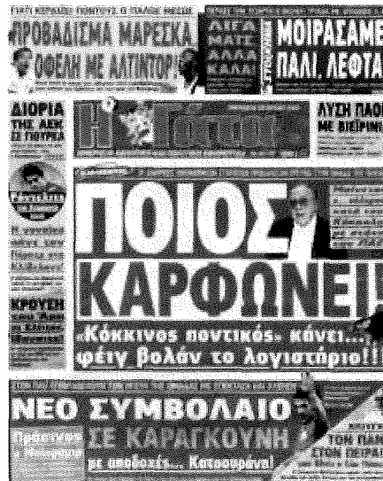
Η Γάτα περί ποντικού, την 10/07/2009.

και προσφορά, κατά το παρελθόν, στην ομάδα είτε γιατί η εφημερίδα «γνώριζε» ότι το χαρτί του δεν είχε καεί εντελώς, όπως ανακριβώς έγραφαν οι υπόλοιπες εφημερίδες.