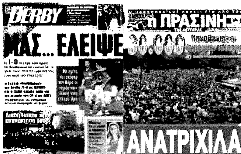
Εύγλωττα τα πρωτοσέλιδα Πράσινης και Derby την επομένη του συλλαλητηρίου

Προφανώς, οι διατυπώσεις που χρησιμοποιεί η κάθε εφημερίδα, ο αριθμός του κόσμου που ...αυξομειώνεται και ο χώρος που αφιερώνει είναι χαρακτηριστικά της τοποθέτησής της. Στο παιχνίδι των εντυπώσεων ενεπλάκησαν και οι τηλεοπτικοί σταθμοί, με την Κρατική τηλεόραση να δέχεται βέλη ακόμη και από βουλευτές της αντιπολίτευσης για μη προβολή εικόνων από το συλλαλητήριο, καταλογίζοντάς της σκοπιμότητα, λόγω της σύμβασης