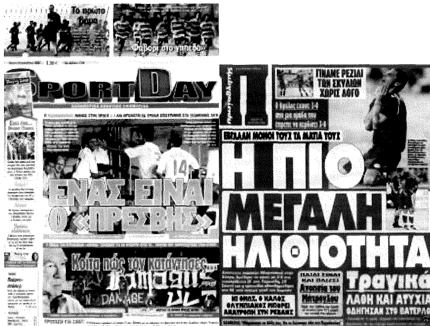
Πρωτοσέλιδα, με διαφορετικές στοχεύσεις, Πρωταθλητή και Sportday την 14/08/2008.

κριτική, ακόμη κι αν εργάζονται σε μη οπαδική εφημερίδα. Η πρόσβαση στις πηγές πληροφόρησης της ομάδας προϋποθέτει καλές σχέσεις με τα ανώτερα κλιμάκια της διοίκησης, το περιβάλλον του προέδρου και τους παίκτες. Η κριτική γίνεται συνήθως από του πιο έμπειρους δημοσιογράφους, οι οποίοι δε