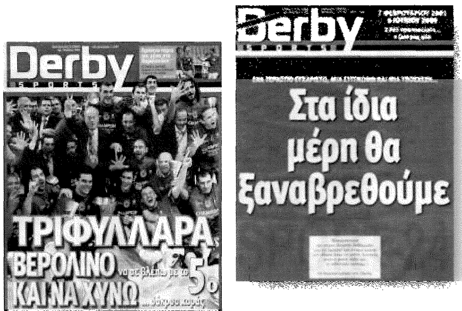
Το επίμαχο πρωτοσέλιδο της 4ης Μαΐου 2009 και το τελευταίο της 06/06/2009