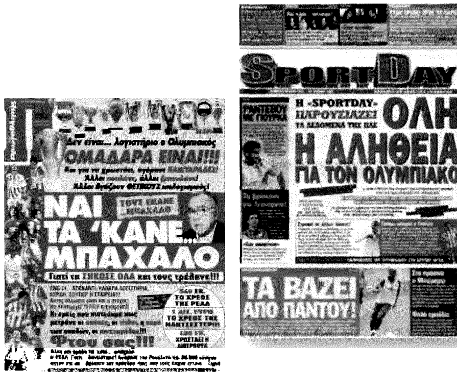
Το πρωτοσέλιδο της Sportday την 09/07/2009 και η απάντηση του Πρωταθλητή, την επομένη.

εκατομμύρια του Μαρινάκη και σταδιακά να την πουλήσει ολόκληρη γιατί δεν ψήθηκε από αυτή, γιατί δεν την εκτίμησε ως καλή για την ομάδα και γιατί λειτουργεί ακόμη με γνώμονα το καλό της ομάδας και όχι το δικό του.»