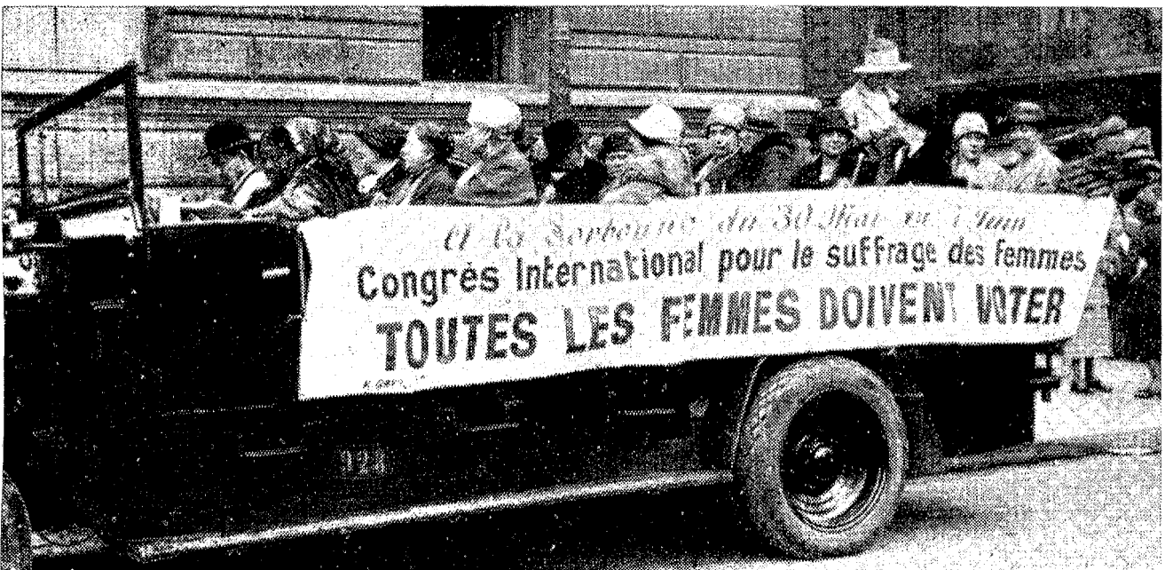
Το Μάιο του 1927 τα μέλη της Alliance διατρέχουν το Παρίσι σε «λεωφορείο» που φέρει το πανώ «Όλες οι γυναίκες πρέπει να ψηφίζουν».

Συζητήθηκε το θέμα της ενσωμάτωσης του φύλου με παραδείγματα από το Δήμο του Φράμπουργκ και της