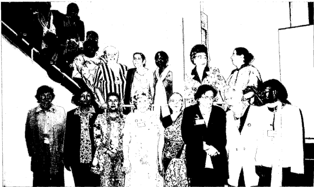
Το νέο Διοικητικό Συμβούλιο της Δ.Ε.Γ. (I.A.W.)

Τονίστηκε ότι θα πρέπει να δώσουμε περισσότερη έμφαση στις δυσμενείς επιπτώσεις που έχουν οι πολιτικές που δεν σέβονται το περιβάλλον. Η οικονομική ανάπτυξη θα πρέπει