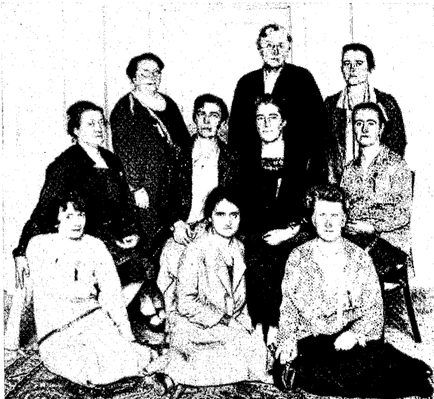
Δ.Ε.Γ. Διοικητικό Συμβούλιο 1927