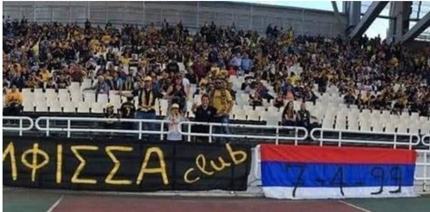
Εικόνα 15: Σημαία της Σερβία με την ημερομηνία διεξαγωγής του φιλικού αγώνα.