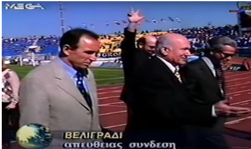
Εικόνα 10: Μέλη της ελληνικής πολιτικής μετά την φύτεψη του κλαδιού ελιάς στο γήπεδο. Πηγή: «ΠΑΡΤΙΖΑΝ ΒΕΛΙΓΡΑΔΙΟΥ ΑΕΚ 1 1 7 4 1999» [video], Youtube , 7 Ιουνίου 2018, https://www.youtube.com/watch?v=yhXMeBV4Wew&ab_channel=spyrossourvinos [ανακτήθηκε στις 10 Μαρτίου 2024].