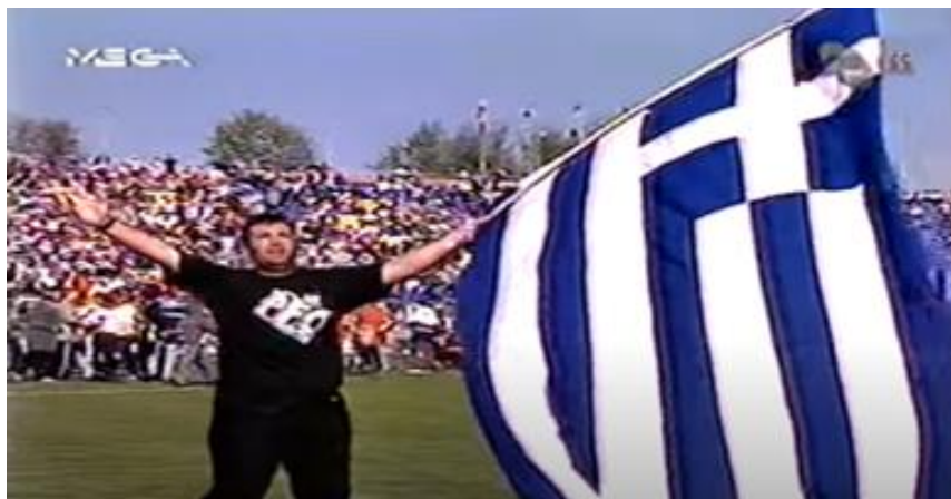
Εικόνα 11: Οπαδός της Παρτιζάν κυματίζοντας την ελληνική σημαία μέσα στο γήπεδο με το βλέμμα προς την κερκίδα των επισήμων.