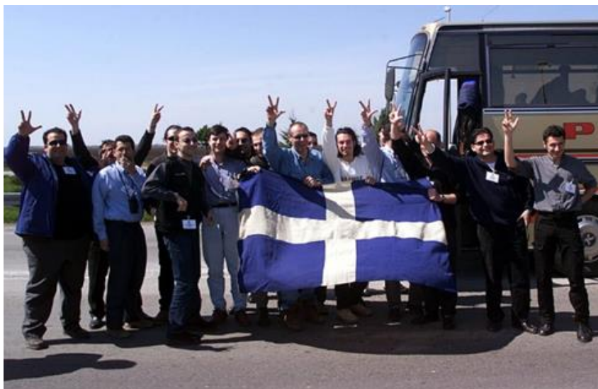
Εικόνα 4: Μέλη της ελληνικής αποστολής χαιρετώντας με το σύμβολο των τριών δακτύλων.