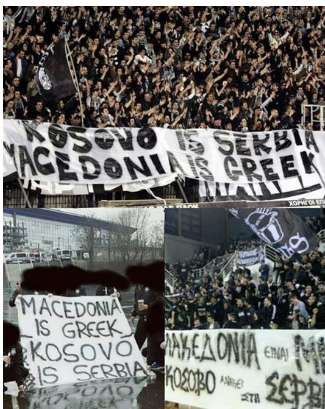
Εικόνα 19: Φίλοι του ΠΑΟΚ με πανό «Kosovo is Serbia». Πηγή: «All fans in the world for Kosovo is Serbia», Facebook , 20 Απριλίου 2022, https://www.facebook.com/AllFansInTheWorldForKosovoIsSerbia/posts/paok-celebrates-its-96th-birthdaycongratulations-brothers-/5693107794039676/ [ανακτήθηκε στις 17 Μαρτίου 2024].