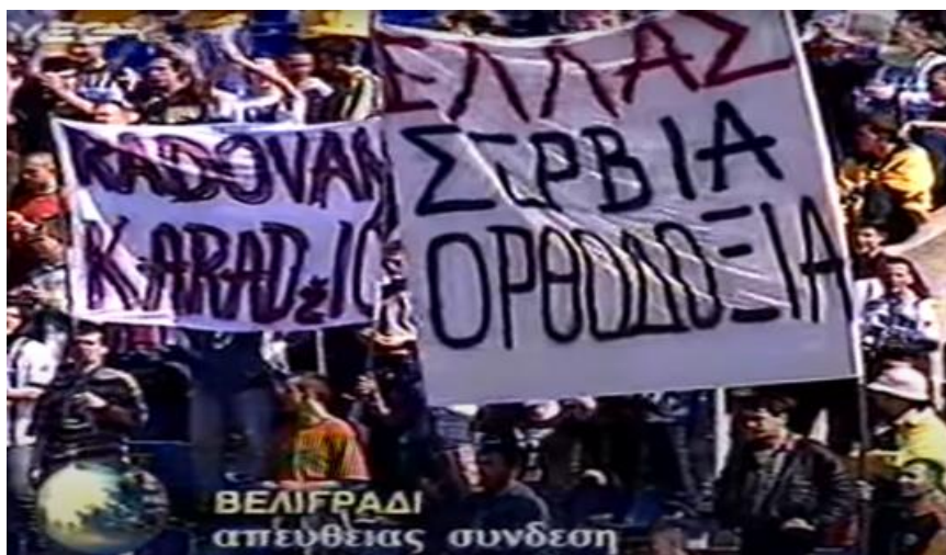
Εικόνα 7: Πανό υποστήριξης στον R. Karadzic και «ΕΛΛΑΣ-ΣΕΡΒΙΑ-ΟΡΘΟΔΟΞΙΑ». Πηγή: «ΠΑΡΤΙΖΑΝ ΒΕΛΙΓΡΑΔΙΟΥ ΑΕΚ 1 1 7 4 1999» [video], Youtube , 7 Ιουνίου 2018, https://www.youtube.com/watch?v=yhXMeBV4Wew&ab_channel=spyrossourvinos [ανακτήθηκε στις 10 Μαρτίου 2024].