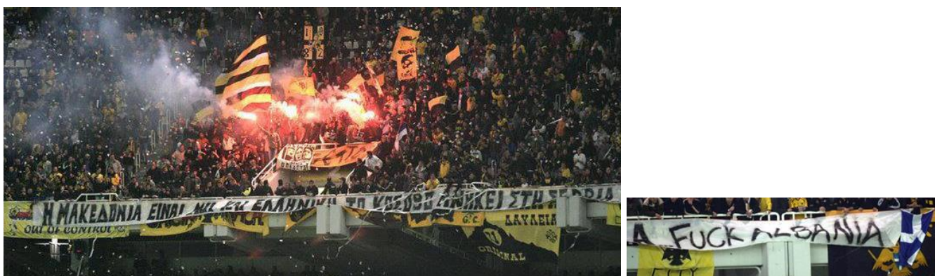
Εικόνα 17: «Η Μακεδονία είναι μία και ελληνική, το Κόσοβο ανήκει στη Σερβία, Fuck Albania». Πηγή: «All fans in the world for Kosovo is Serbia», Facebook , 10 Ιουλίου 2016, https://www.facebook.com/AllFansInTheWorldForKosovoIsSerbia/photos/a.1198635910153576/1368217459862086/?type=3 [ανακτήθηκε στις 19 Μαρτίου 2024].