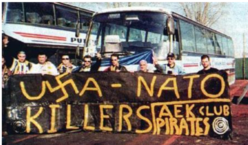
Εικόνα 1: Οι «Πειρατές του Ονείρου» στον δρόμο για το Βελιγράδι. Πηγή: Βασίλης Γούσιος, Οι Πειρατές για το ιστορικό ταξίδι της ΑΕΚ στο Βελιγράδι . Aek-live.gr, 7 Απριλίου 2017, https://www.aek-live.gr/i-pirates-gia-to-istoriko-taxidi-tis-aek-sto-veligradi/ [ανακτήθηκε στις 25 Φεβρουαρίου 2024].