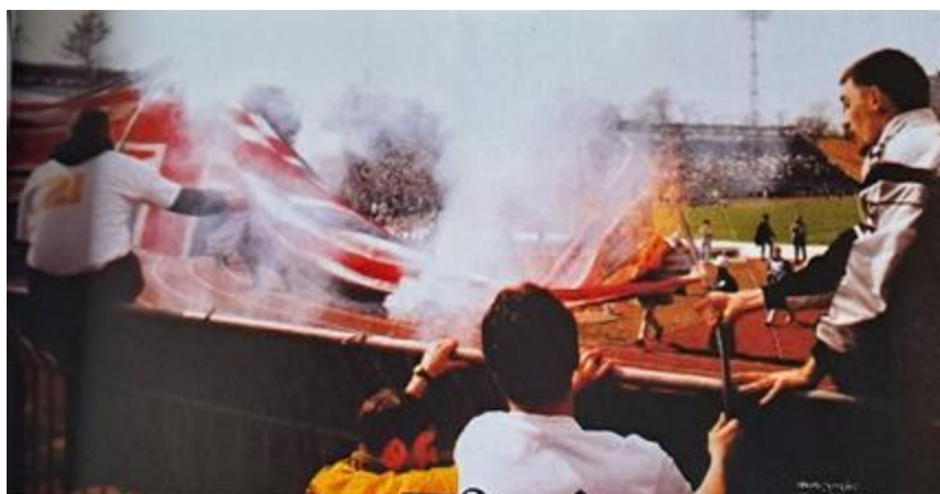
Εικόνα 12: Έλληνες και Σέρβοι οπαδοί καίνε μια αγγλική σημαία.