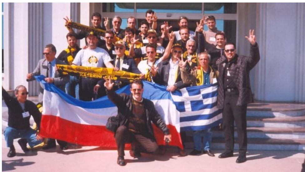
Εικόνα 2: Τα μέλη της αποστολής καθodόν για το Βελιγράδι.