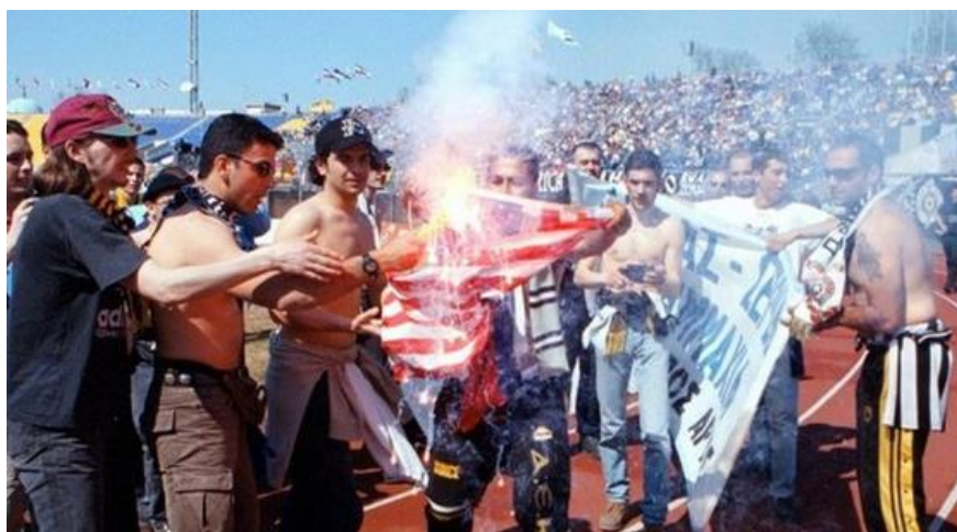
Εικόνα 8: Έλληνες και Σέρβοι οπαδοί καίνε μια αμερικανική σημαία. Δεξιά πανό με το σύνθημα «ΕΛΛΑΣ-ΣΕΡΒΙΑ-ΣΥΜΜΑΧΙΑ». Πηγή: «MEMORIES: PARTIZAN - ΑΕΚ ATHENS 07.04.1999», Ultras-tifo.net , 7 Απριλίου 2021, https://www.ultras-tifo.net/memories/6411-memories-partizan-aek-athens-07-04-1999.html [ανακτήθηκε στις 26 Μαρτίου 2024].