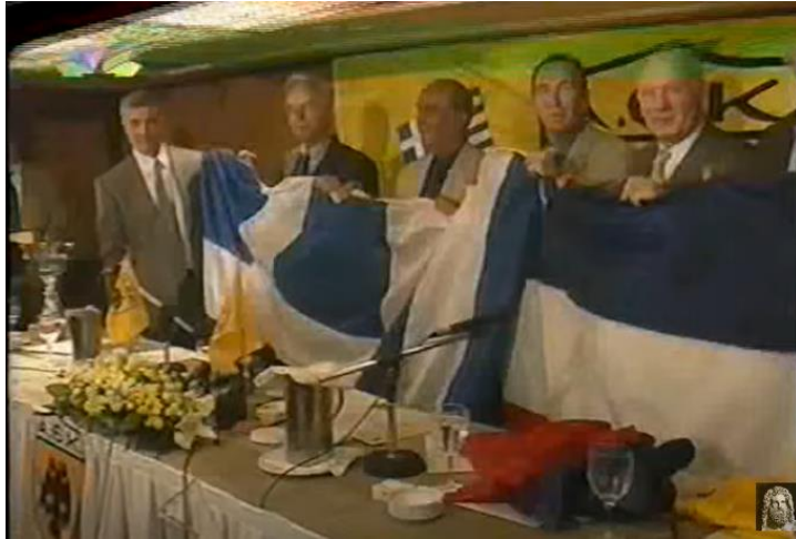
Εικόνα 13: Η αδελφοποίηση των δύο συλλόγων.