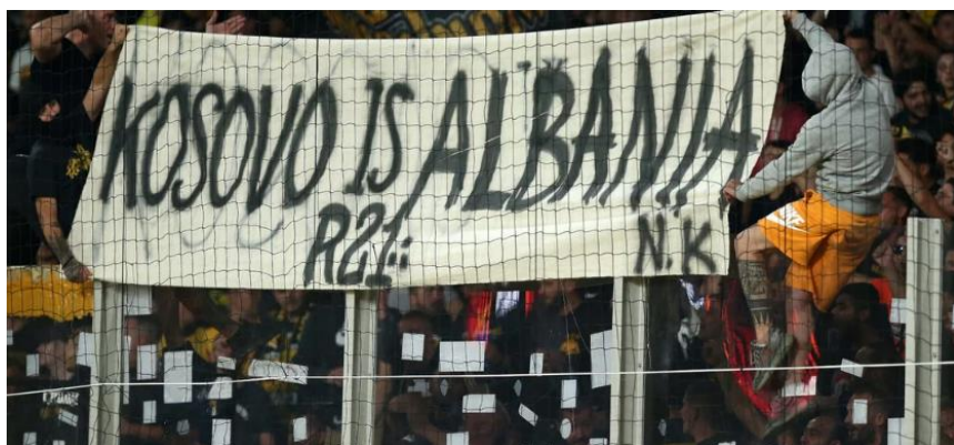
Εικόνα 18: Πανό από Ενωσίτες «Kosovo is Albania».