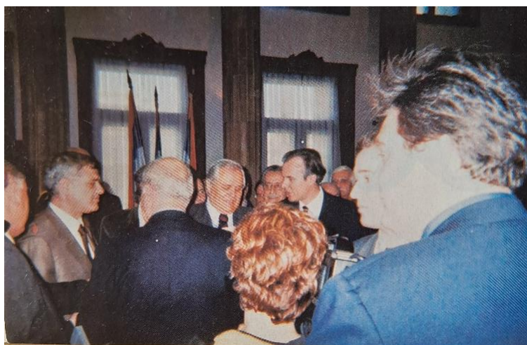
Εικόνα 5: «Ο πρόεδρος της Σερβίας Μ. Μιλουτινοβιτς υποδέχεται την αποστολή της ΑΕΚ».