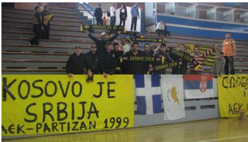
Εικόνα 16: Φίλοι της ΑΕΚ με πανό «Το Κόσοβο είναι Σερβία» κι αναφορά στον φιλικό αγώνα της 7 ης Απριλίου. Πηγή: «ΑΕΚ Θεσσαλονίκης-Σταυρούπολη Club», Facebook , 3 Απριλίου 2015, https://www.facebook.com/photo/?fbid=733742203413748&set=ecnf.100070977673065&locale=ms_MY [ανακτήθηκε στις 18 Μαρτίου 2024].