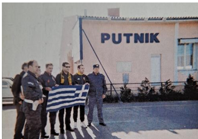
Εικόνα 3: «Μέλη της αποστολής της ΑΕΚ μαζί με Σέρβους αστυνομικούς. (Σύνορα με Ουγγαρία)».