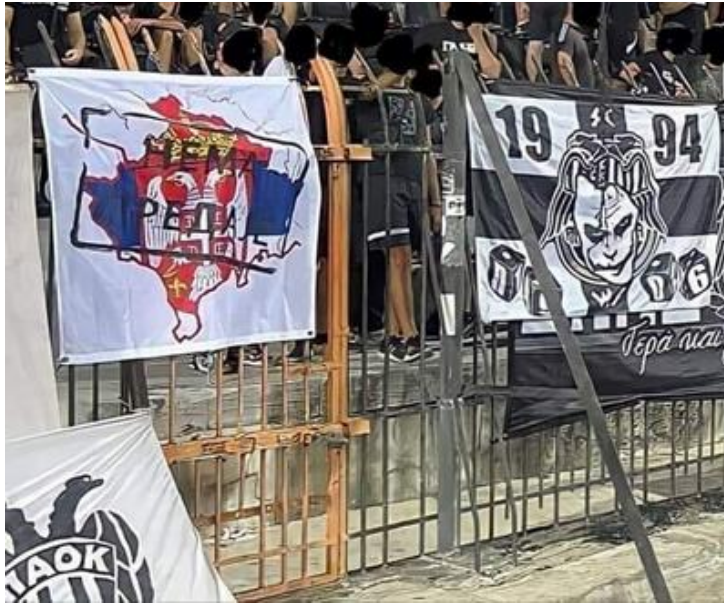
Εικόνα 20: Πανό των φίλων του ΠΑΟΚ που απεικονίζει την περιοχή του Κοσόβου στα χρώματα της Σερβίας και αναγράφει «Нема предаје» («Καμία υποχώρηση»). Πηγή: «ΠΑΟΚ PARTIZAN FAMILY», Facebook , 17 Σεπτεμβρίου 2022, https://www.facebook.com/paokpartizanfamily2010/posts/our-brothers-with-the-flag-no-surrender-kosovo-is-serbia-%EF%B8%8Frespect-brothers-kosov/5823805064325641/ [ανακτήθηκε στις 19 Μαρτίου 2024].