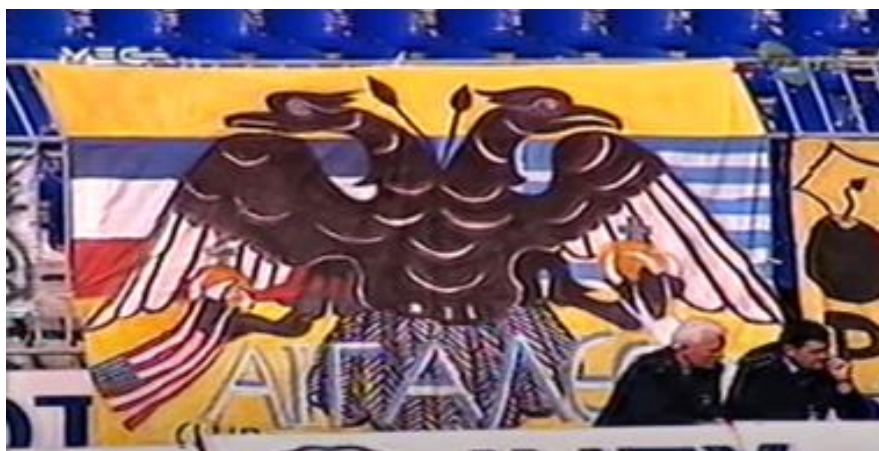
Εικόνα 9: Ο δικέφαλος αετός σκίζει την αμερικανική σημαία και στο φόντο οι σημαίες της ΟΔΓ και της Ελλάδας. Πηγή: «ΠΑΡΤΙΖΑΝ ΒΕΛΙΓΡΑΔΙΟΥ ΑΕΚ 1 1 7 4 1999» [video], Youtube , 7 Ιουνίου 2018 https://www.youtube.com/watch?v=yhXMeBV4Wew&ab_channel=spyrossourvinos [ανακτήθηκε στις 10 Μαρτίου 2024].