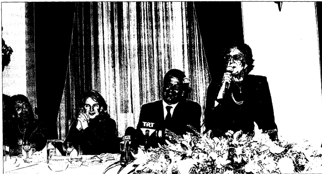
Η Πρόεδρος του Συνδέσμου κ. Αλίκη Γιωτοπούλου-Μαραγκοπούλου, ο Υπουργός Τύπου και Μ.Μ.Ε. κ. Χρήστος Πρωτόπαπας, η τ. Υφυπουργός κ. Μιλένα Αποστολάκη και η τ. Υπουργός κ. Ειρήνη Λαμπράκη

Στην εκδήλωσή μας αυτή παρέστησαν επίσης η τ. Υπουργός και Ευρωβουλευτής κ. Ρένα Λαμπράκη , σήμερα επικεφαλής του γραφείου Συμφώνου Σταθερότητας των Βαλκανίων, η τ. Υφυπουργός Ανάπτυξης κ. Μιλένα Αποστολάκη , πρόεδροι και εκπρόσωποι γυναικείων σωματείων, πολλοί δημοσιογράφοι, μέλη, φίλες και φίλοι του Συνδέσμου.