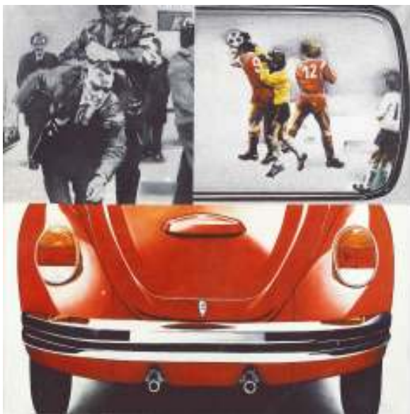
Εικόνα 6 Γιάννης Ψυχοπαίδης, Νους υγιής, 1972