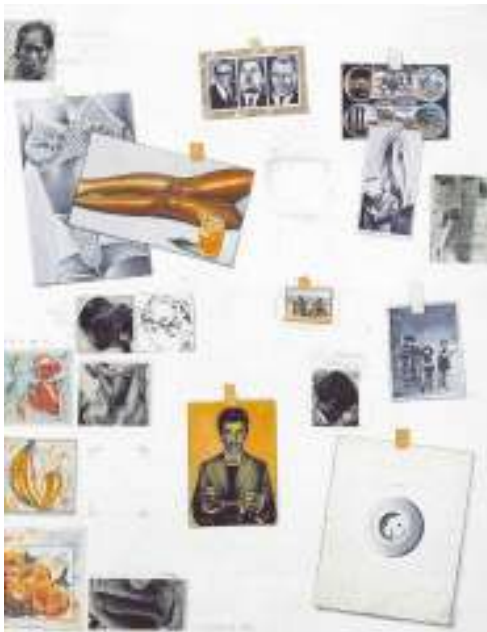
Εικόνα 4 Γιάννης Ψυχοπαίδης, Ο τοίχος, 1972