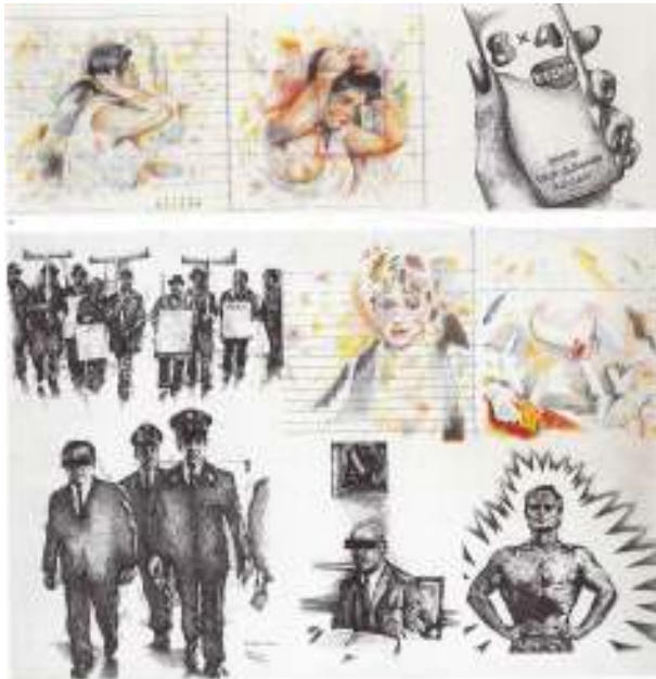
Εικόνα 9 Γιάννης Ψυχοπαίδης, Από τη σειρά «Σημειώσεις στον Renoir», 1973