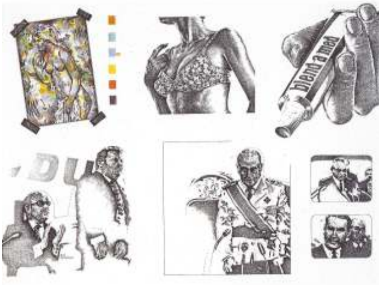
Εικόνα 8 Γιάννης Ψυχοπαίδης, Από τη σειρά «Σημειώσεις στον Renoir», 1973