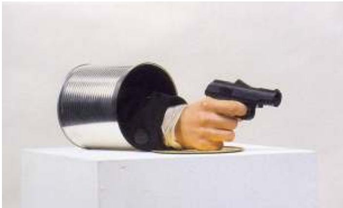
Εικόνα 16 Κλεοπάτρα Δίγκα, Το πιστόλι που σκότωσε τον Ρ.Ο. , 1972