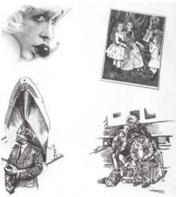
Εικόνα 11 Γιάννης Ψυχοπαίδης, Από τη σειρά «Σημειώσεις στον Renoir», 1973