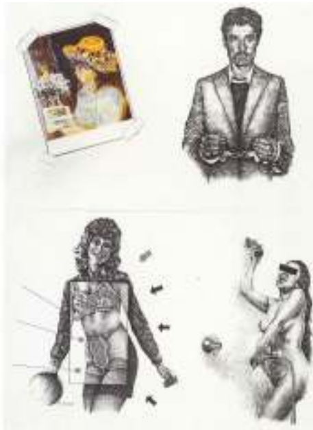
Εικόνα 10 Γιάννης Ψυχοπαίδης, Από τη σειρά «Σημειώσεις στον Renoir», 1972