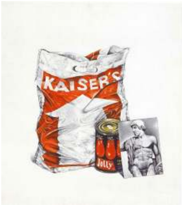
Εικόνα 5 Γιάννης Ψυχοπαίδης Καταναλωτική κοινωνία, 1973