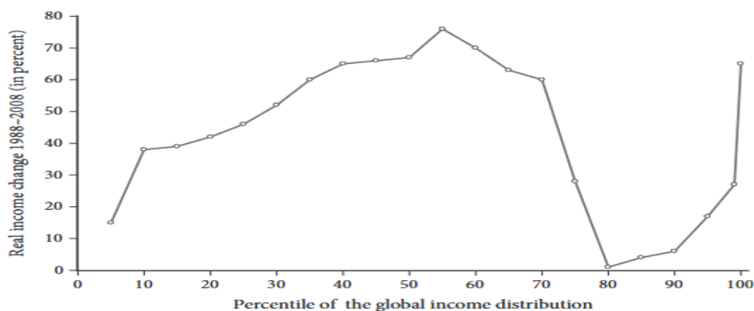
Διάγραμμα Δ.Ι.1 Η καμπύλη του Ελέφαντα

αναπτυσσόμενες χώρες κατάφεραν να ξεφύγουν από τη φτώχεια,. Στην Κίνα, ο συντελεστής Gini αυξήθηκε από 0.30 το 1990 σε πάνω από 0.47 το 2020 (Piketty et al., 2019). Παρόμοια τάση παρατηρείται στην Ινδία, όπου η οικονομική φιλελευθεροποίηση της δεκαετίας του 1990 οδήγησε σε συγκέντρωση πλούτου στα ανώτερα εισοδηματικά στρώματα (Michael, 2016). Στη Βραζιλία, ενώ η ανισότητα μειώθηκε μεταξύ 2000 και 2014 λόγω κοινωνικών πολιτικών, από το 2015 και μετά αυξήθηκε ξανά, λόγω της οικονομικής κρίσης και της συγκέντρωσης πλούτου σε λίγες ελίτ (Gradin, Leibbrandt and Tarp, 2021). Μεταξύ των εμπειρικών μελετών οι οποίες αμφισβητούν το θεώρημα Stolper-Samuelson, ξεχωρίζει η μελέτη των Lakner και Milanovic (2016), η οποία αναλύοντας την εξέλιξη της παγκόσμιας διανομής του εισοδήματος μεταξύ 1988 και 2008, μια περίοδος που χαρακτηρίζεται από συνθήκες έντονης παγκοσμιοποίησης, τεχνολογικής ανάπτυξης και οικονομικής φιλελευθεροποίησης, καταδεικνύει ότι η παγκοσμιοποίηση είχε ασύμμετρες επιδράσεις οδηγώντας σε αύξηση των ανισοτήτων στις περισσότερες χώρες, τόσο στις ανεπτυγμένες όσο και τις αναπτυσσόμενες. Με βάση τα ευρήματα της μελέτης, η παγκόσμια διανομή του εισοδήματος κατά την εξεταζόμενη περίοδο λαμβάνει την μορφή ενός σχήματος που μοιάζει με το σώμα ενός ελέφαντα (βλ. Διάγραμμα Δ.Ι.1).