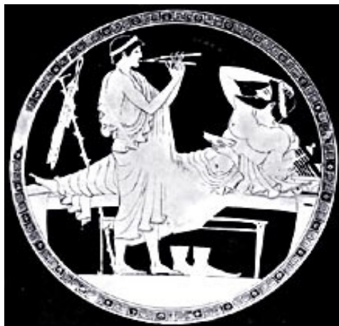
Συμποσιαστής ξαπλωμένος τραγουδά με την συνοδεία αυλού. Εσωτερικό αττικής ερυθρόμορφης κύλικας του ζωγράφου του Δούριδος. München, Staatliche Antikensammlungen und Glyptothek

στοιχείο της εγκληματικής φύσης της πράξης θεωρούνταν η πληρωμή και όχι η συνεύρεση δυο ανδρών.