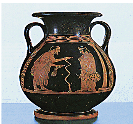
Αττική ερυθρόμορφη πελίκη του ζωγράφου Ορφέα με παράσταση παιδαγωγού και μαθητή. Αθήνα, Εθνικό Αρχαιολογικό Μουσείο.

Η εκπαίδευση των παιδιών ήταν ευθύνη του πατέρα και όχι της πολιτείας και τα παιδιά διδάσκονταν αθλητισμό μέσω του παιδοτρίβη , μουσική και χορό από τον κιθαριστή και ανάγνωση και γραφή από τον γραμματιστή 105 .