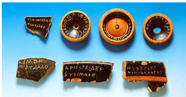
Όστρακα που χρησιμοποιήθηκαν για τον οστρακισμό γνωστών πολιτικών Αθήνα, Μουσείο Αρχαίας Αγοράς.

Θέσπισε τη Βουλή των Πεντακοσίων. Αύξησε δηλαδή τη δύναμη της Βουλής των τετρακοσίων κατά 100 μέλη. Οι βουλευτές προέρχονταν πλέον ισάριθμα (50 μέλη) από κάθε φυλή. Εισηγάγε επίσης και το θεσμό του οστρακισμού 17 .