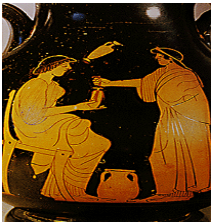
Λεπτομέρεια αττικής ερυθρόμορφου πελίκης με παράσταση γυναίκας εμπόρου αρωμάτων. Verne, Historisches Museum.

κυκλοφορούσαν ελεύθερα μεταξύ των ανδρών στην αγορά προκειμένου να πουλήσουν ψωμί, λαχανικά και άλλα εμπορεύματα.