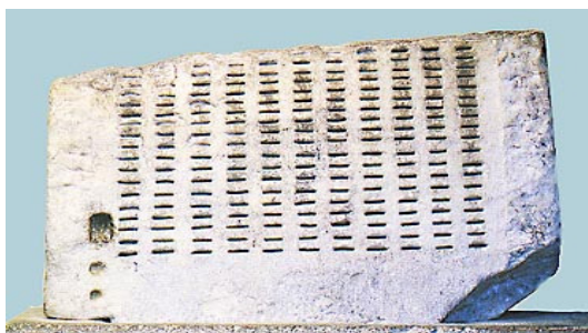
Τμήμα κληρωτηρίου που βρέθηκε στην αρχαία Αγορά. Αθήνα, Μουσείο Αρχαίας Αγοράς.

δικαιώματα και δεν όφειλαν στο δημόσιο. Οι νέοι ηλιασταί έδιναν όρκο, τον ηλιαστικό όρκο 154 , σε μια επίσημη τελετή που γινόταν στον Αρδηττό, και σύμφωνα με αυτόν προέκυπταν οι εξής κύριες υποχρεώσεις: Ο ηλιαστής δεσμευόταν να ψηφίζει σύμφωνα με τους νόμους (του Δράκοντα, του Σόλωνα και του Κλεισθένη) και τα ψηφίσματα του Δήμου και της Βουλής. Να ακούει τις απόψεις και των δυο αντιδίκων πλευρών και να μην δέχεται δώρα.