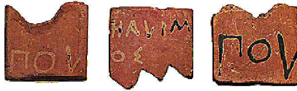
Πήλινα πλακίδια που φέρουν επιγραφή με το όνομα της φυλής και του δήμου. Αθήνα, Μουσείο Αγοράς.

Όπως διαπιστώνουμε από την αναφορά μας στις φυλές, τις φρατρίες και τους δήμους οι μεταρρυθμίσεις του Κλεισθένη επέφεραν σημαντικές αλλαγές σε αυτούς τους θεσμούς 44 . Κατά την κλασική εποχή ο δήμος παίζει κυρίαρχο ρόλο και ο ρόλος της φρατρίας περιορίστηκε σε θέματα οικογενειακού δικαίου.