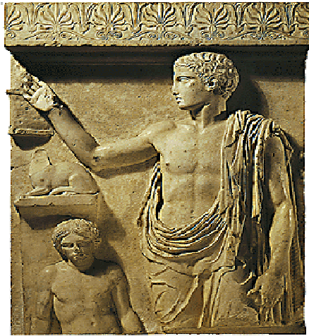
Επιτύμβια στήλη εφήβου που συνοδεύεται από το μικρό δούλο του. Αθήνα, Εθνικό Αρχαιολογικό Μουσείο.

Οι δούλοι της Αθήνας συγκροτούσαν ορισμένες κατηγορίες ανάλογα με το επάγγελμά τους και ανάλογα με το επάγγελμα του κυρίου τους 125 :