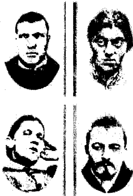
Εικόνα 2. Φυσιογνωμίες εγκληματιών

Παρόμοιες απόψεις με αυτές του Lombroso διατυπώθηκαν από πολλούς επιστήμονες μετά από αυτόν. Οι κυριότεροι από αυτούς είναι οι Ernst Kretschmer (1888- 1964) και Sidney Sheldon (1917-2007) που συνέδεσαν επίσης τα φυσικά χαρακτηριστικά του ατόμου με την ηθική του και τον τύπο της ιδιοσυγκρασίας του εστιάζοντας όμως σε διαφορετικό σημείο της φυσιογνωμίας, το σώμα..