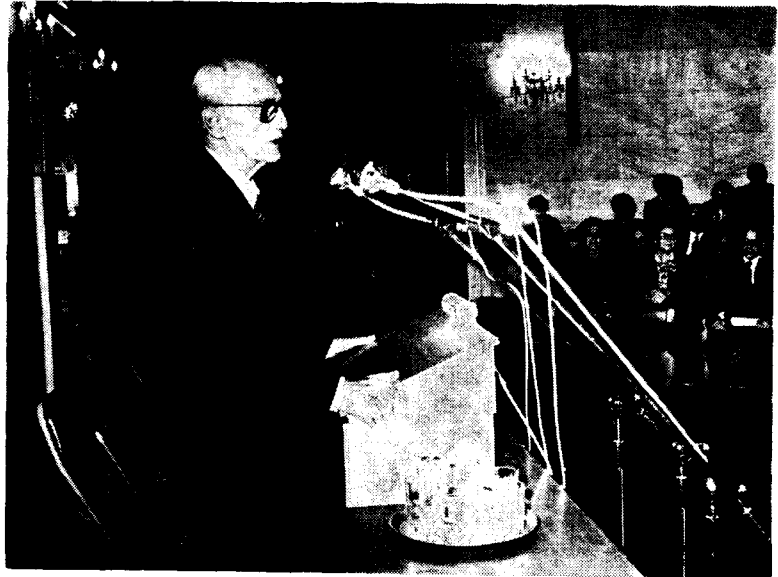
Ο πρόεδρος κ. Π. Κανελλόπουλος χαιρετίζοντας τον ΣΔΓ

Την επέτειο αυτή τίμησαν με την συμμετοχή τους απευθύνοντας χαιρετισμούς ο τ. πρωθυπουργός κ. Παν. Κανελλόπουλος, ο Δήμαρχος Αθηναίων κ. Δημ. Μπέης, ο καθηγητής κ. Κ. Δεσποτόπουλος και ή Πρόεδρος του Συμβουλίου Έλληνίδων κ. Κ. Στασινοπούλου. Πολλοί άρχηγοί κομμάτων και βουλευτές δεν μπόρεσαν να παραστούν στην εκδήλωση, γιατί την ίδια ώρα στη Βουλή άρχιζε ή συ-