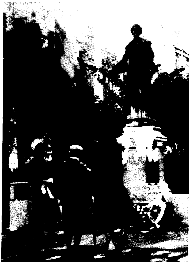
Το άγαλμα της EMMELINE PANKHURST μπροστά στο Αγγλικό Κοινοβούλιο.

Κάθε χρόνο στις 14 Ιουλίου, επέτειο της γέννησής της, οι σουφραζέτες καταθέτουν στεφάνι. Η φωτογραφία από το 1966, όταν στήθηκε το μνημείο.