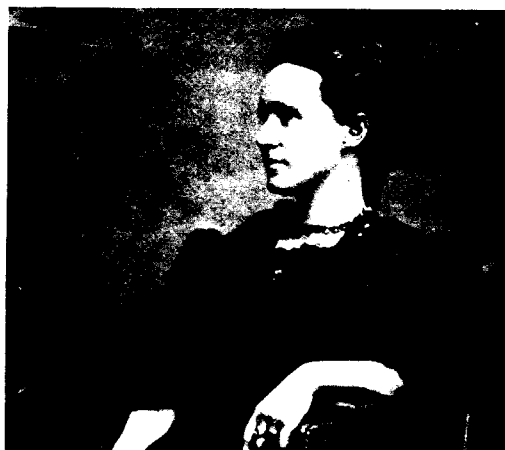
MILLICENT GARRETT FAWCETT

Πρόεδρος της Αμερικανικής Ένωσης Γυναικών για την ψήφο. Προήδρευσε στο Συνέδριο της I.W.S.A. του Βερολίνου το 1904.