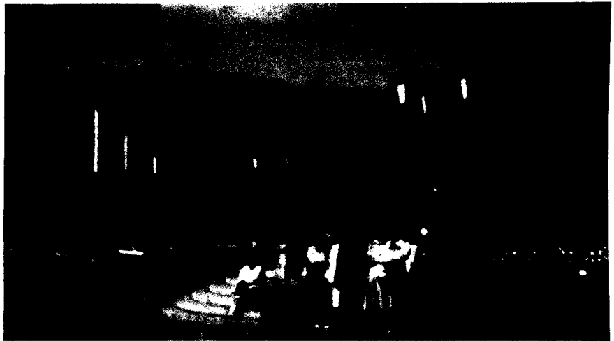
Η ελληνική αντιπροσωπεία μπροστά στό Πανεπιστήμιο

Τό Συνέδριο μās έδωσε τήν εύκαιρία νά γνωρίσουμε μιά όμορφη χώρα μέ ύψηλό πολιτιστικό επίπεδο. Έπισκεφθήκαμε τά αξιοθέατα του Έλσίνκι, τή μοντέρνα ένκλησία, κτισμένη μέσα στους βράχους, τό μνημείο Σιμπέλιους, τή Βουλή, Γερουσία, Πανεπιστήμιο, τό Μέγαρο ΦΙΛΑΝΔΙΑ, ιδρύματα κοινωνικής προνοίας, όρθόδοξες ένκλησίες, ένκλησίες πού οι παπάδες είναι γυναίκες, υπαίθρια μουσεία, κατοικίες ιδιάζουσας μοντέρνας αρχιτεκτονικής, εργαστήρια και έκθέσεις μέ είδη λαϊκής και σύγχρονης τέχνης, τή σάουνα κ.λ.π. Έπι-