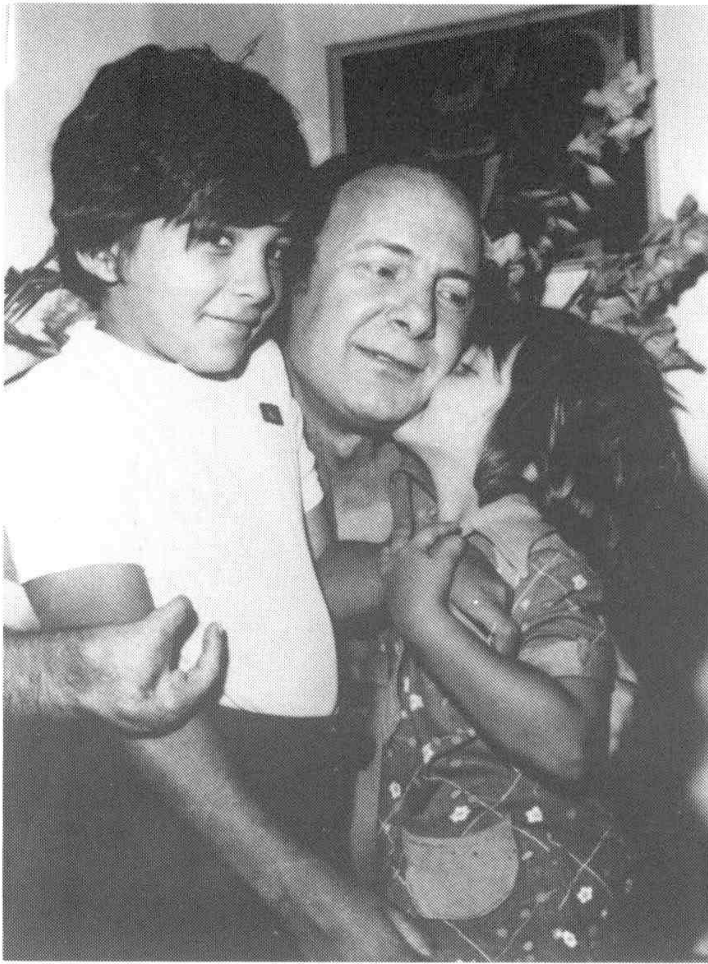
4, 5. Με τα παιδιά του.