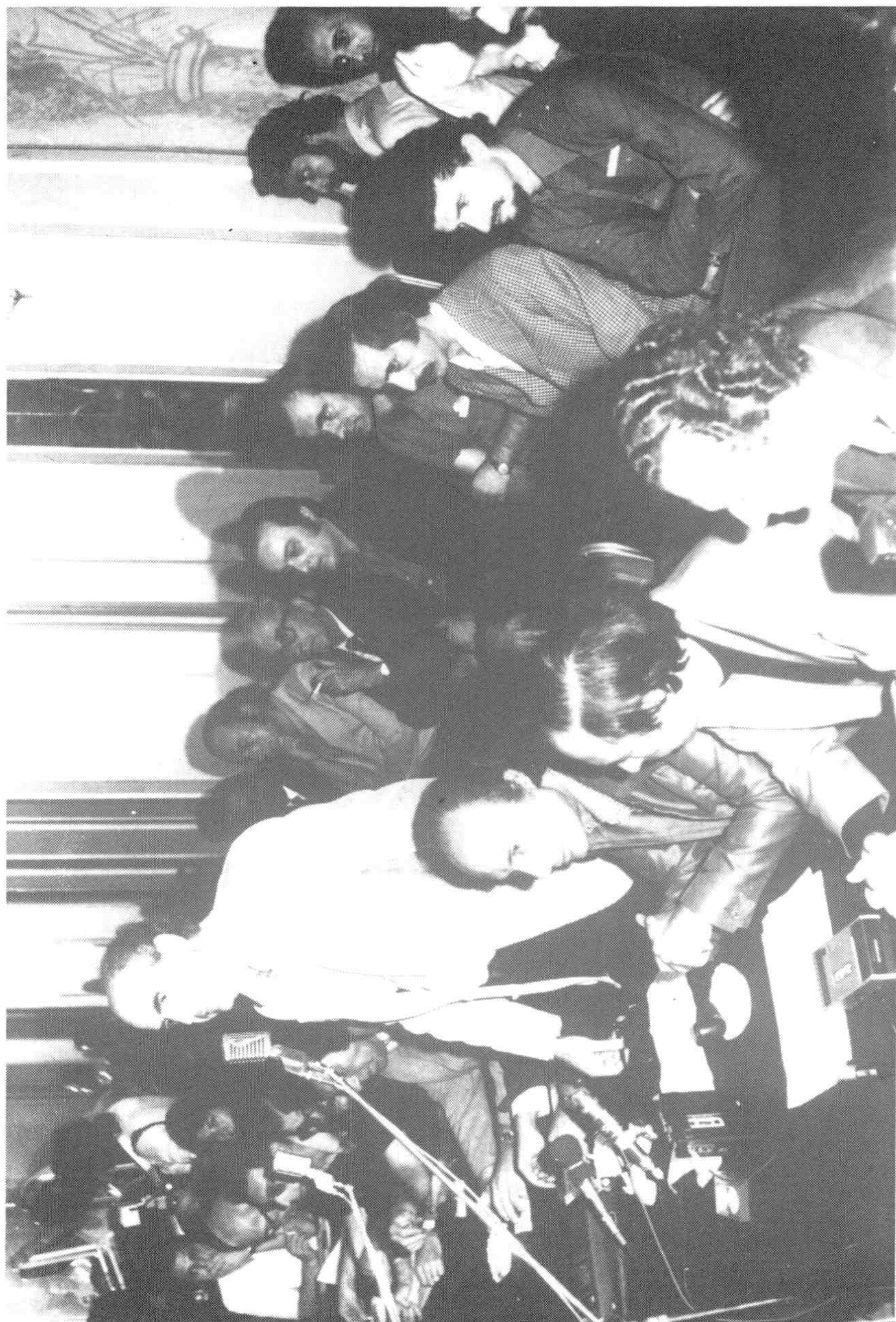
8. Στην ιδρυτική διακήρυξη του ΠΑΣΟΚ, στις 3-9-1974.