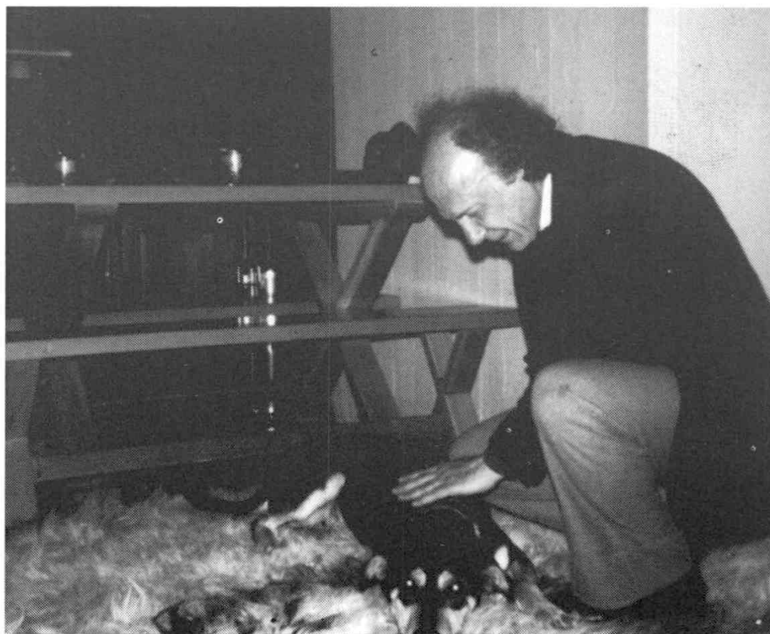
14. Στο σπίτι του, το Πάσχα του 1982.