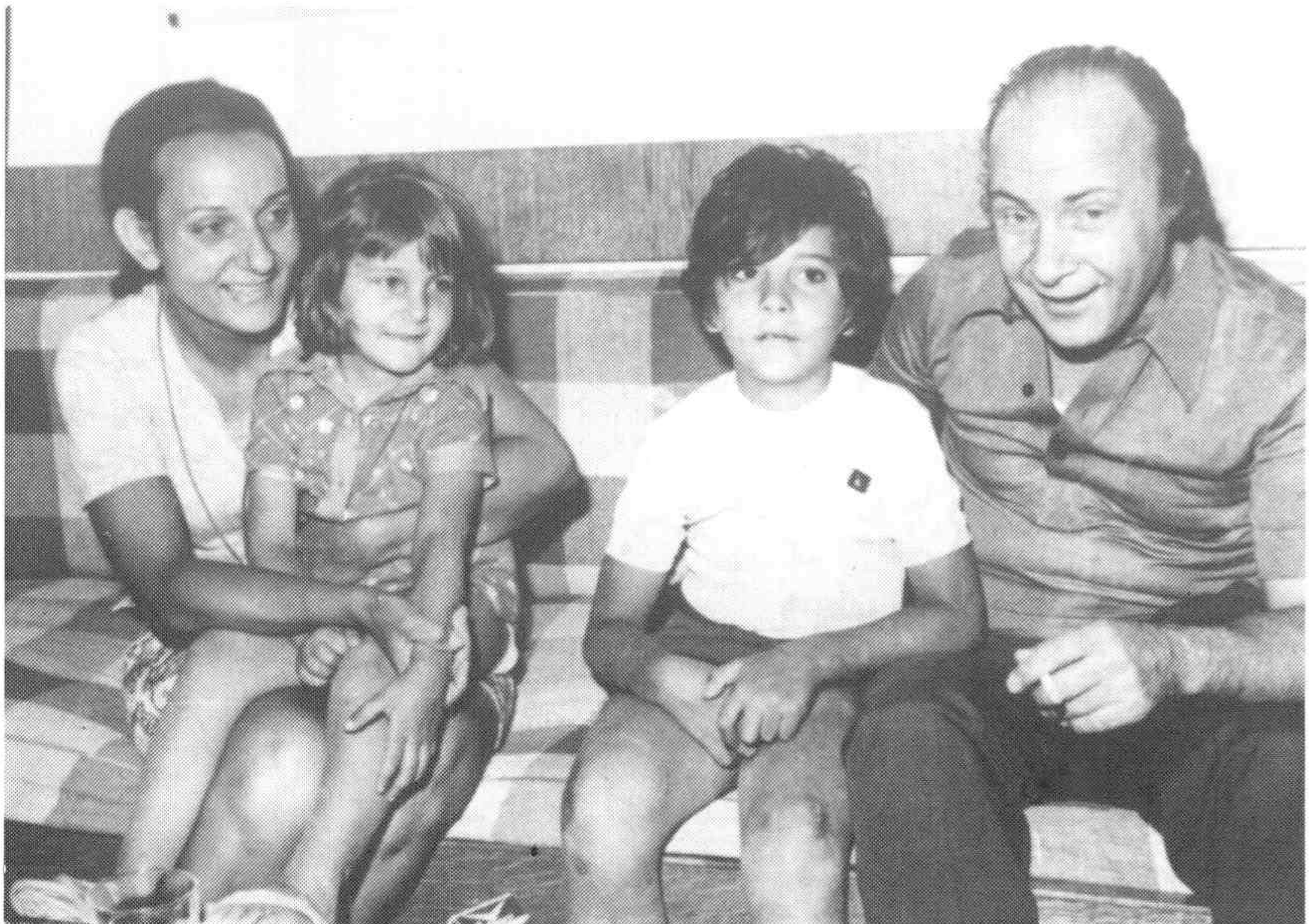
3. Την ίδια μέρα στο σπίτι του.