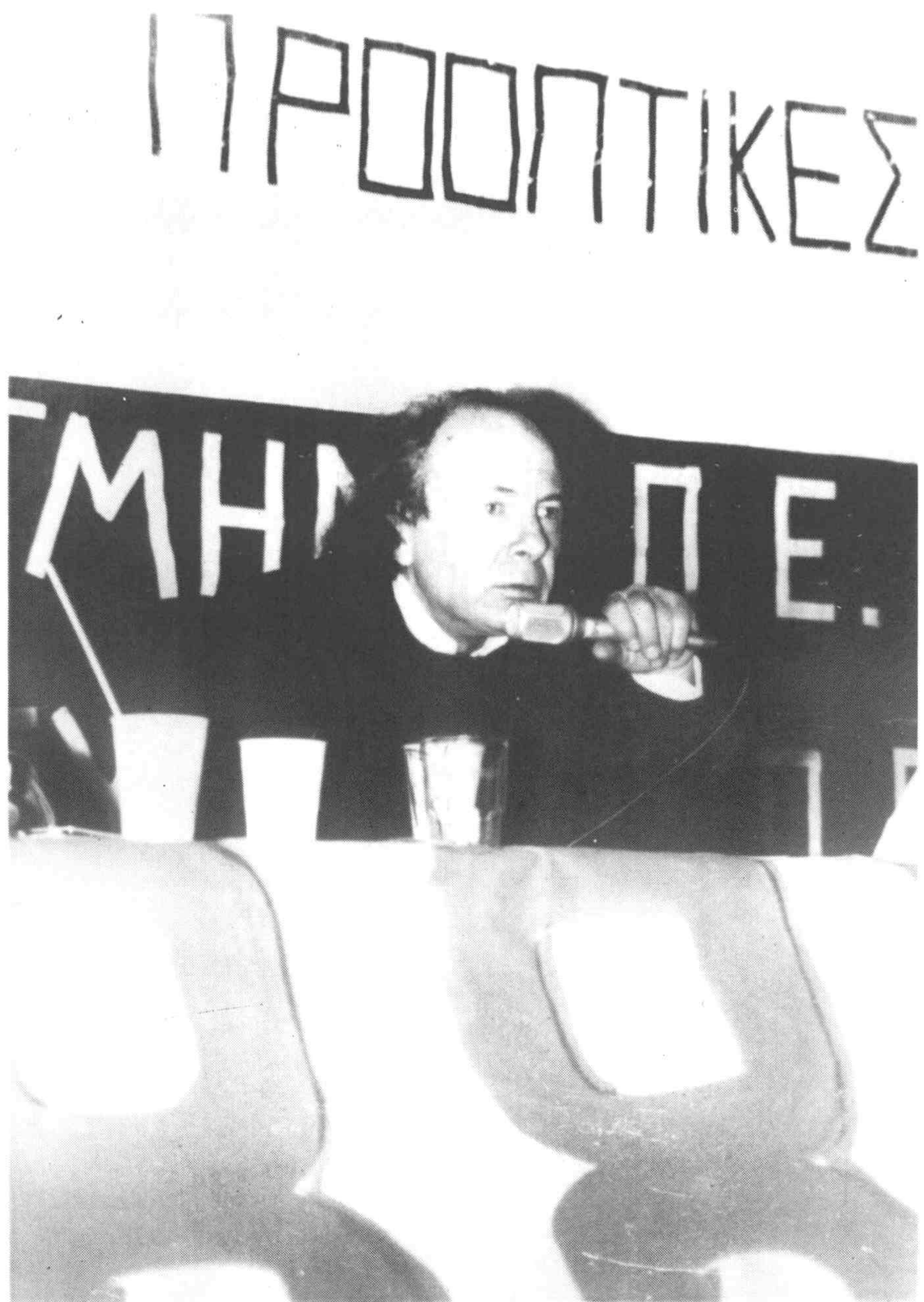
15. Ομιλητής σε συνέδριο για το σοσιαλισμό.