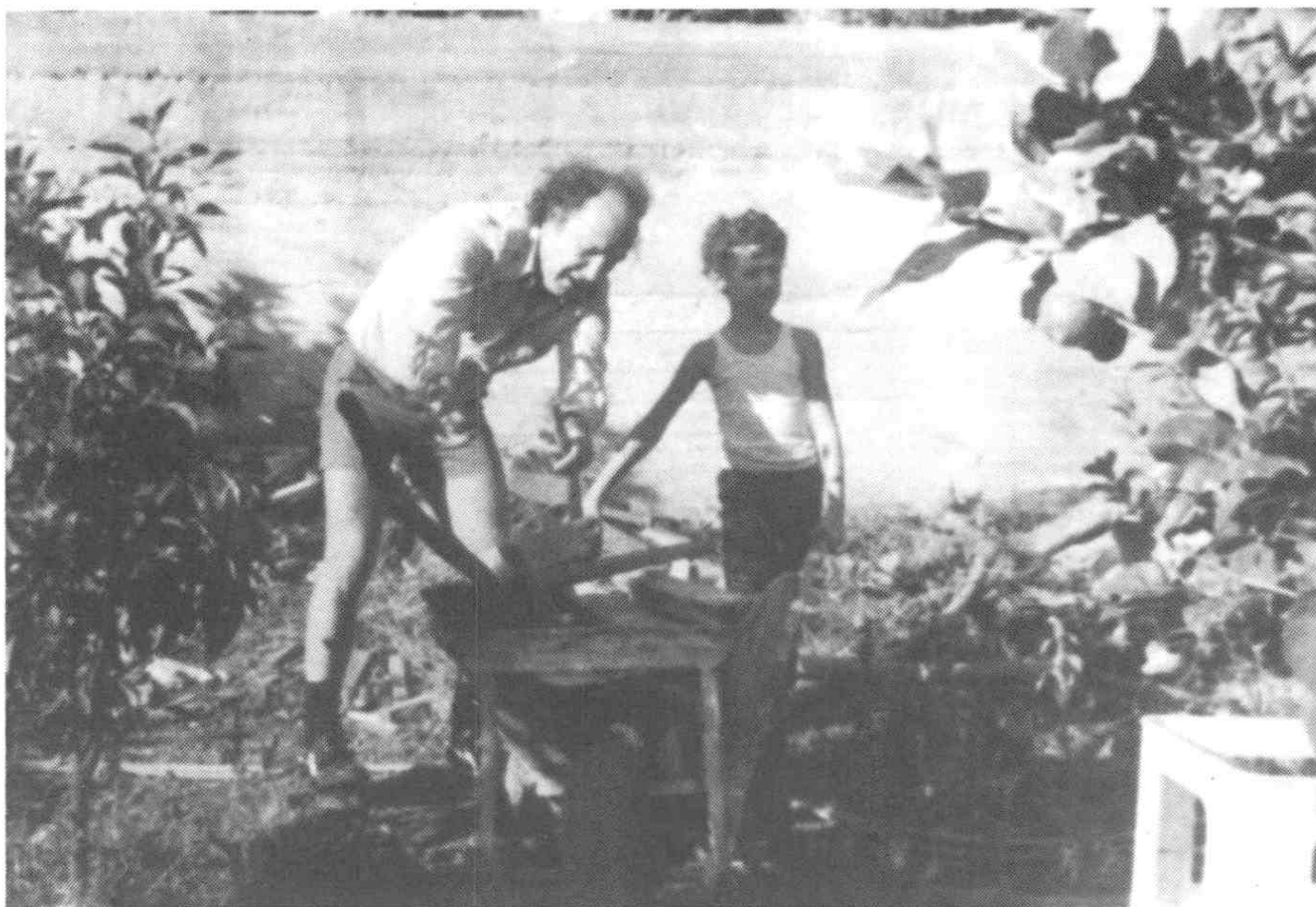
13. Στην Κατούνα της Εύβοιας, το 1980.