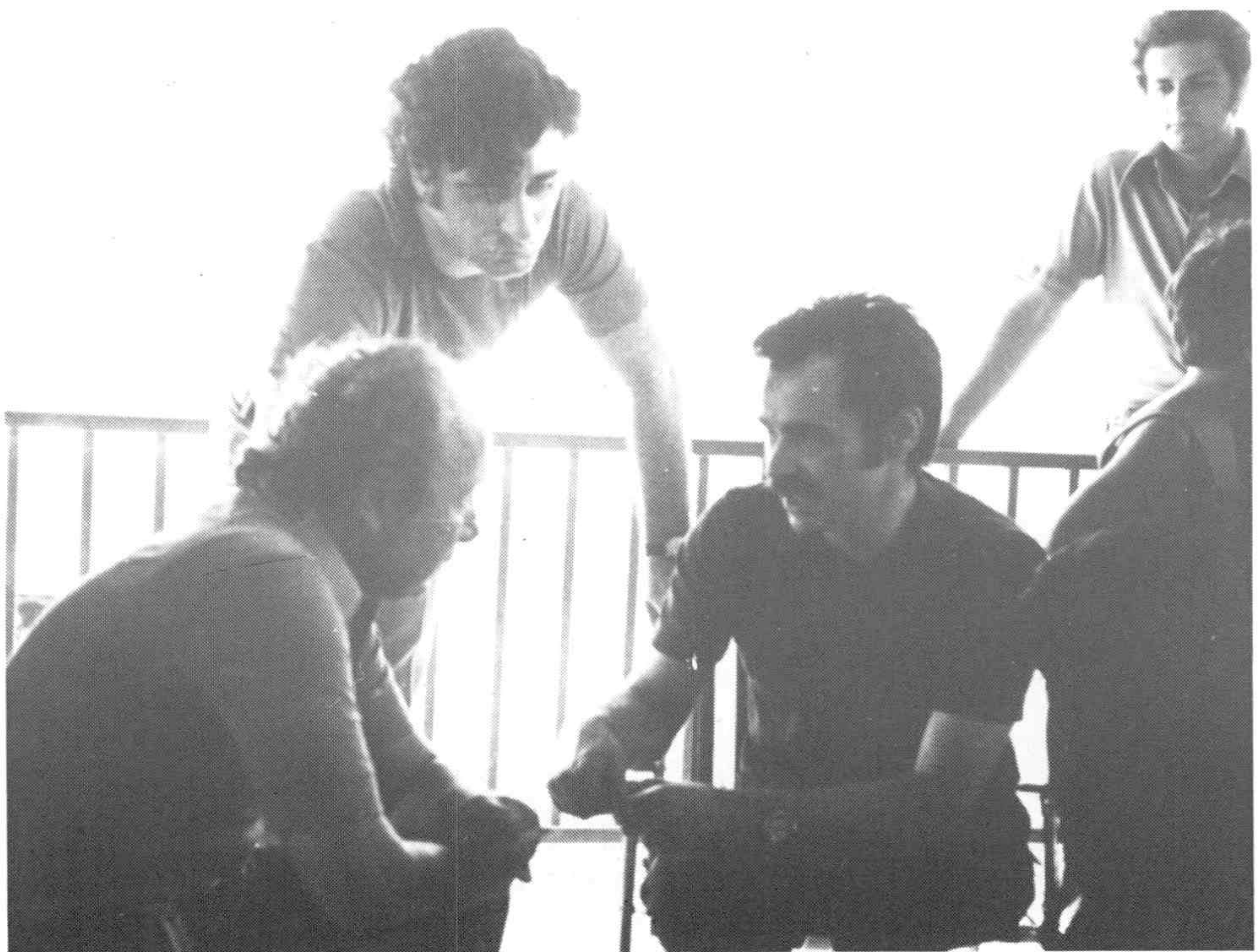
6. Με τον Αλέκο Παναγούλη, τον Αύγουστο του '73.