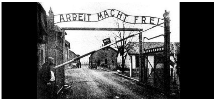
"Η εργασία απελευθερώνει" επιγραφή στην πύλη του στρατοπέδου συγκέντρωσης Άουσβιτς

Εκτός από τους Εβραίους, το ναζιστικό κόμμα θεωρούσε εχθρούς του γερμανικού έθνους και της φυλετικής καθαρότητας και άλλες