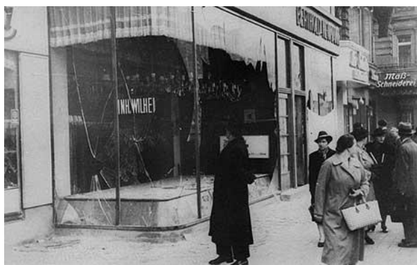
Θυρματισμένη βιτρίνα καταστήματος μετά τη Νύχτα των Κρυστάλλων, Νοέμβριος 1938

Δημιουργήθηκαν τα πρώτα στρατόπεδα συγκέντρωσης, προορισμένα αρχικά για τους