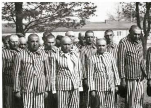
Κρατούμενοι σε στρατόπεδο συγκέντρωσης

Ένας τρόπος για να μπορέσουν οι δράστες να διατηρήσουν την εσωτερική τους ηρεμία ήταν να χτίσουν δύο διαφορετικούς κόσμους. Ο ένας ήταν ένας διεστραμμένος κόσμος