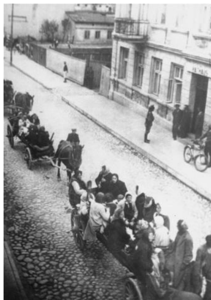
Μεταφορά Εβραίων στο σιδηροδρομικό σταθμό για εκτοπισμό σε στρατόπεδο συγκέντρωσης

Οι απελάσεις, για παράδειγμα, απαιτούσαν τη συμμετοχή πολλών από το επαγγελματικό προσωπικό των σιδηροδρόμων. Κάποιοι από αυτούς ασχολήθηκαν με τις μεταφορές των Εβραίων χωρίς να χρειαστεί να βγουν από το γραφείο τους, ενώ άλλοι έπρεπε να βρίσκονται παρόντες κατά τη διάρκεια της μεταφοράς και να αντικρίζουν το θέαμα με τα ίδια τους τα μάτια. Κανένας δε διαμαρτυρήθηκε και σχεδόν κανένας δε ζήτησε μετάθεση.