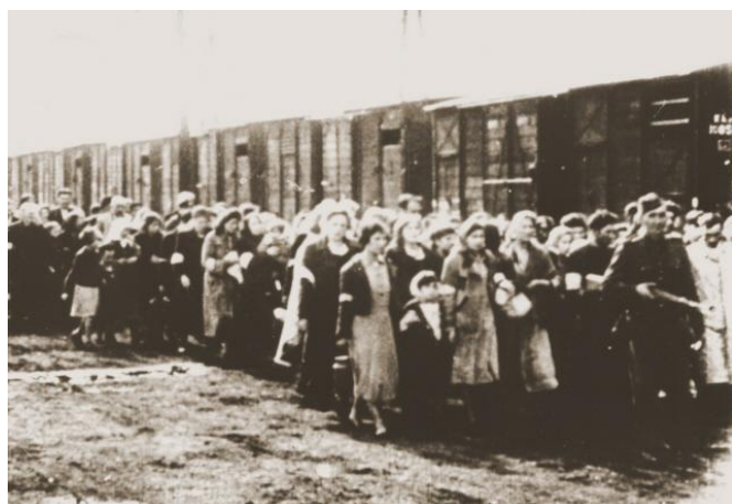
Εκτοπισμός Εβραίων από το γκέτο της Βαρσοβίας

Θεμιτό είναι να αναφερθούμε και σε αυτούς που συμμετείχαν στην τραγωδία με το να μένουν παθητικοί στα τεκταινόμενα και όχι μόνο σε αυτούς που έλαβαν ενεργά μέρος. Η συμπεριφορά τους, αν και