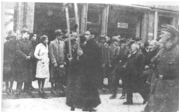
Οι πολίτες του Regensburg στη Γερμανία παρακολουθούν καθώς οι Εβραίοι πορεύονται στην πόλη πριν την απέλασή τους.

Παράλληλα πίστευαν ότι η μη συμμετοχή στα γεγονότα και η συμμόρφωση με την πλειοψηφία, τους κρατούσε ασφαλείς και τους απάλλαξε από την ευθύνη. Θεωρούσαν τον εαυτό τους αθώους θεατές γεγονότων που ήταν αδύνατο να ελέγξουν. Τα πρώτα χρόνια του πολέμου είναι πιθανό να μην πήραν θέση σε όσα συνέβαιναν, διότι δε γνώριζαν ακριβώς τα εγκλήματα που διαπράττονταν και δε μπορούσαν να αντιληφθούν το μέγεθος της πρωτοφανούς τραγωδίας. Τα ανύπαρκτα περιθώρια αντίδρασης ενάντια στον κρατικό μηχανισμό που