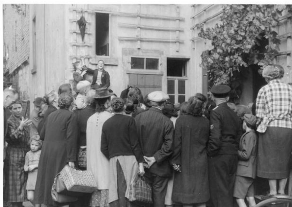
Πλειστηριασμός για πώληση της περιουσίας των εκτοπισμένων Εβραίων στο Hanau, Γερμανία.

Δεν είναι απαραίτητο όμως ότι όσοι δεν ανελάμβαναν ενεργό δράση, ήταν σύμφωνοι με τις