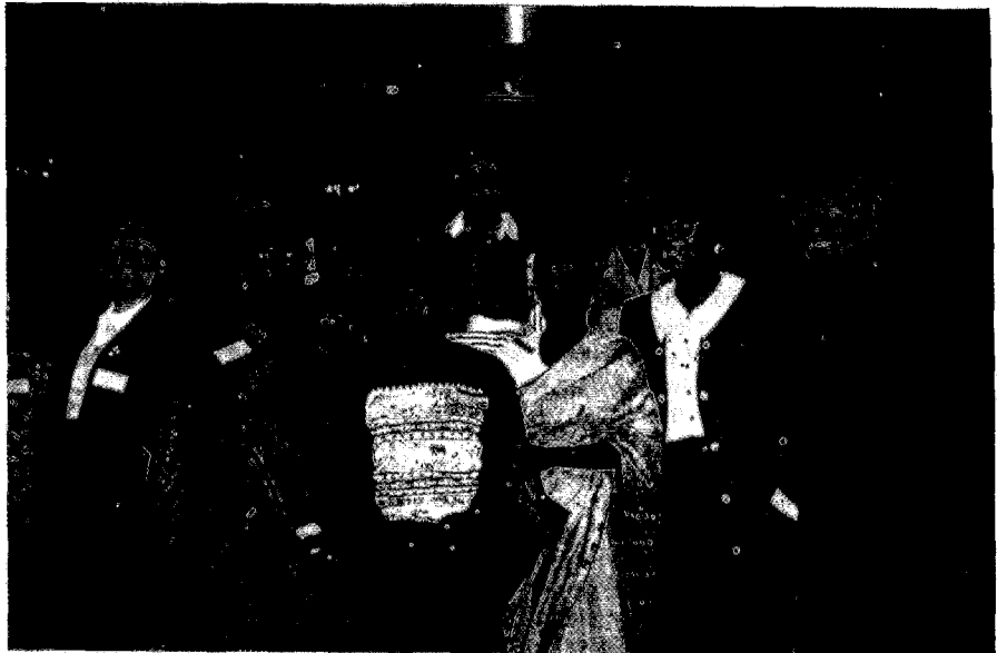
Η πρόεδρος της ΔΕΓ με μέλη του Συμβουλίου.

Οι γυναίκες, ιδιαίτερα οι μικρότερες ηλικιακές ομάδες, έχουν υψηλότερη μόρφωση από τους άνδρες. Περισσότερες γυναίκες απ' ό,τι οι άνδρες έχουν ακαδημαϊκό πτυχίο. Στη σύγχρονη κοινωνία, οι γυναίκες έχουν αρχίσει να εργάζονται επικερδώς, κάνοντας το ίδιο είδος δουλειάς που προηγουμένως γινόταν στο σπίτι σαν άμισθη εργασία. Οι γυναίκες εργάζονται σε διάφορα επαγγέλματα και ασχολίες στις υπηρεσίες της πρόνοιας: σαν νοσοκόμες, ντανάδες παιδιών, δασκάλες και επιμελή-