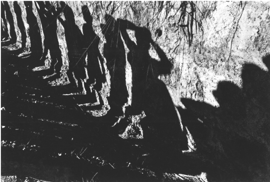
Σούζαν Μείσελάς, Μπλόκο σε ταξιδιώτες λεωφορείου, Σαλβαντό, 1980.