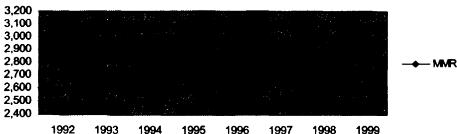
MMR Καταθέσεις NUTS III

Αρκετές εργασίες δεν περιορίζονται στην εξέταση της οικονομικής σύγκλισης των περιφερειών και έχουν επιχειρήσει να ενσωματώσουν και κοινωνικές μεταβλητές (Γιαννιάς κ.ά. 1997, Συριόπουλος κ.ά. 1997). Επιχειρούν να εκτιμήσουν την εξέλιξη της ανισότητας στο επίπεδο κατανάλωσης (κατά κεφαλήν ιδιωτικό εθνικό εισόδημα, οικιακή χρήση ηλεκτρικού ρεύματος ανά 1.000 άτομα), σε δημογραφικά δεδομένα (ποσοστό γεννητικότητας, ποσοστό ανεργίας), στο επίπεδο ευημερίας (αριθμός κατοικιών ανά 1.000 άτομα, αριθμός νοσοκομειακών κλινών ανά 1.000 άτομα, αριθμός μαθητών ανά δάσκαλο, αριθμός γιατρών ανά 1.000 άτομα) κ.ά.