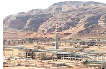
Πυρηνικές εγκαταστάσεις στο Isfahan

Τον Αύγουστο και τον Σεπτέμβριο του 2005 η Τεχεράνη δηλώνει ότι ξεκίνησε και πάλι την μετατροπή ουρανίου στο εργοστάσιο της στο Isfahan επιμένοντας ότι το πρόγραμμα θα χρησιμοποιηθεί για ειρηνικούς σκοπούς. Η Διεθνής Υπηρεσία Ατομικής Ενέργειας δεν πείθεται από τους ισχυρισμούς του Ιράν, υποστηρίζοντας ότι το Ιράν έχει παραβιάσει την Συνθήκη Μη Πολλαπλασιασμού των Πυρηνικών Όπλων.