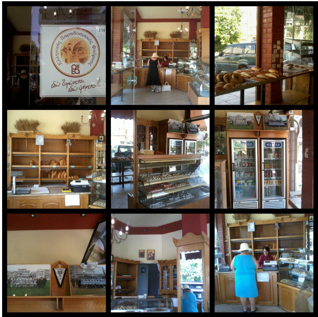
Εικόνα 11: Κολάζ φωτογραφιών του φούρνου στο Κορδελιό.