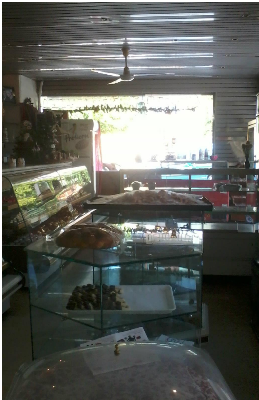
Εικόνα 9: Όψη του καταστήματος από τον πάγκο πώλησης προς την έξοδο

Δίπλα βρίσκεται ένα λευκό έπιπλο για τα λογιστικά βιβλία και επάνω έχει το τηλέφωνο (τη βάση του ασύρματου) και ένα κομπιουτεράκι. Ακριβώς δίπλα από αυτό το έπιπλο ήταν η θέση της ερευνήτριας καθ' όλη τη διάρκεια της έρευνας. Δίπλα υπάρχει ένα τραπέζι με λευκό τραπεζομάντιλο. Εκεί υπάρχουν επίσης διακοσμητικά, περιοδικά και στυλό. Το σημείο αυτό αποτέλεσε το χώρο της ερευνήτριας καθ' όλη τη διάρκεια της παρατήρησης (εικ. 8).