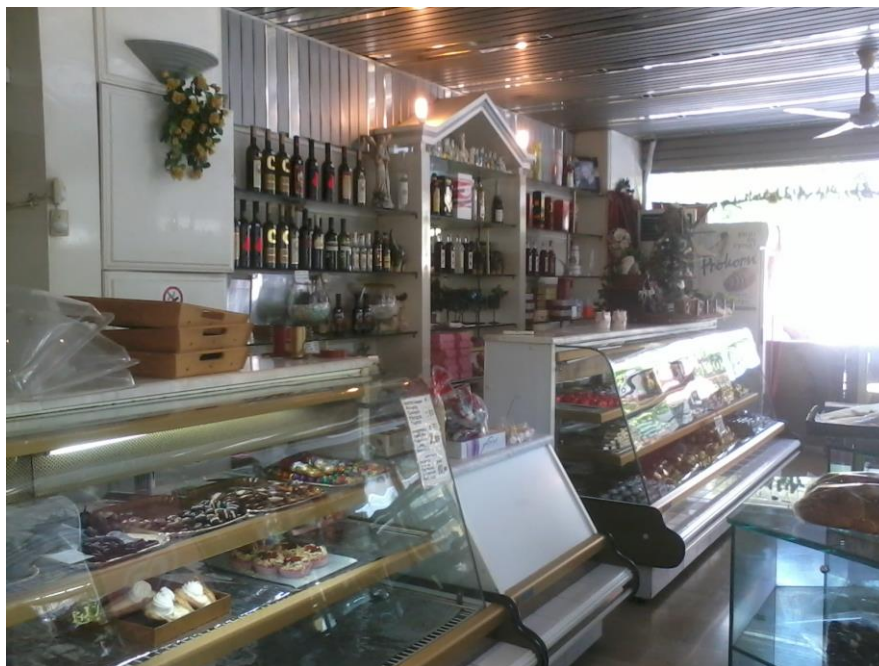
Εικόνα 4: Ὅψη της κάβας, των δύο ψυγείων και του διαχωριστικοῦ πάγκου.

Διακρίνουμε ένα όρθιο ψυγείο για παγωτίνα και πίσω από αυτό ένα όρθιο κλιματιστικό σε απόσταση περίπου 10 μέτρα από το χώρο πωλητηρίου του ψομιοῦ. Από την ἄλλη μεριά της πόρτας υπάρχουν δύο καταψύκτες με τούρτες και τούρτες παγωτοῦ. Απέναντι βρίσκεται ένα ψυγείο με κεράσματα και πάνω του ένα μεγάλο διακοσμητικό που αναπαριστά ένα μύλο και ἕναν ξυλόφουρνο και προϊόντα ἄρτου με τη φιγούρα του φούρναρη ντυμένο στα λευκά να «καλωσορίζει». (εικόνα 3).