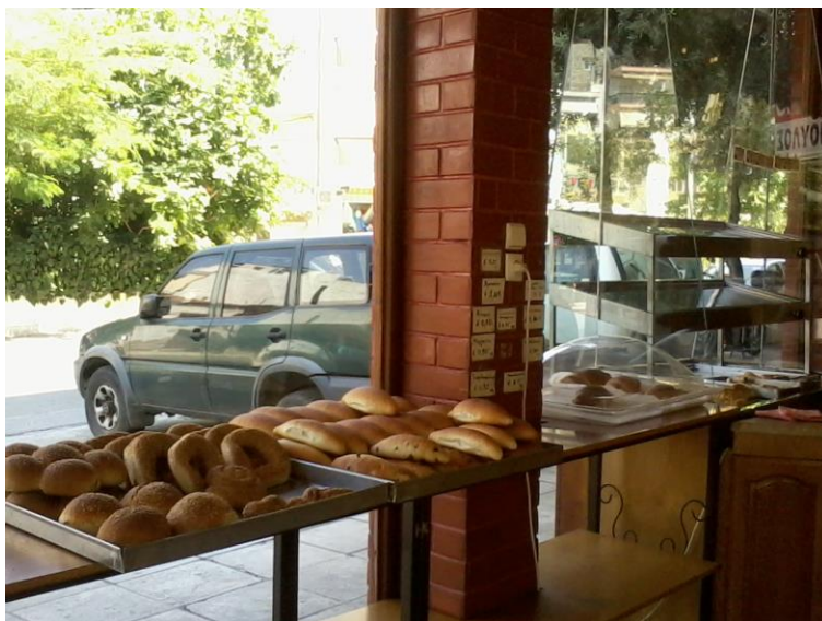
Εικόνα 15: Ο πάγκος διάθεσης των προϊόντων.

Στο επάνω μέρος της εισόδου βρίσκεται, στο τοίχο το air-conditioner (εικόνα 14).