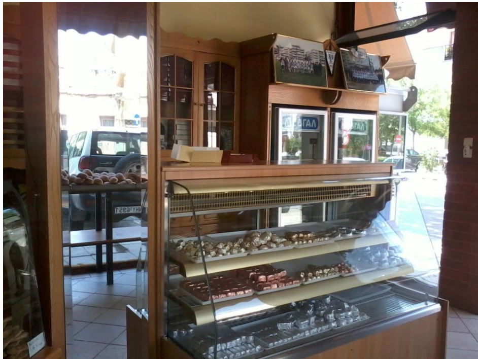
Εικόνα 20: Το ψυγείο με τα κέρασματα.

Παρατηρούμε εδώ ένα ψυγείο με απενεργοποιημένη την ψύξη τριών επιπέδων για τα βουτήματα (βουτήματα βουτύρου, πλεξούδες, πι-φουρ με σοκολάτα, με μαρμελάδα) και τα κρισίνια με σουσάμι. Δίπλα υπάρχει μια κολώνα κόκκινου χρώματος, που είναι μέχρι τη μέση περίπου επενδυμένη με ξύλο. Από τη μια πλευρά της κολώνας (αυτή που είναι ορατή στους πελάτες) υπάρχει καθρέφτης σχεδόν σε όλο το μήκος του ξύλου. Δίπλα από την κολώνα υπάρχει ένα ψυγείο τριών επιπέδων για τα κέρασματα σοκολάτας. Τα δύο ψυγεία και η κολώνα, σχηματίζουν ένα ημικύκλιο αφήνοντας αρκετό χώρο για τους πελάτες (εικ. 20).