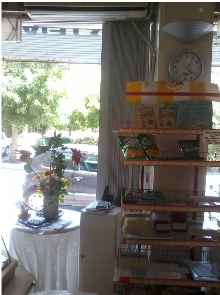
Εικόνα 8: Μια στήλη, ένα ντουλαπάκι γραφείου και το τραπέζακι

οδηγεί στο θάλαμο του εργαστηρίου και στον επάνω όροφο με μια σκάλα. Δίπλα από την πόρτα υπάρχει ένα ψυγείο (Το ψυγείο περιέχει χυμούς Μεβγάλ Vivid, σε μικρό και μεγάλο μέγεθος, μπύρες σε μικρό κουτάκι Amstel, πορτοκαλάδες, σόδες, Lipton κρύο τσάι, νερά σε μεγάλο μέγεθος Ζαγόρι και Coca-Cola σε μεγάλο μέγεθος. Στην άλλη μεριά του ψυγείου περιέχονται τα γάλατα, το κεφίρ, τα γιαούρτια (Μεβγάλ), κίτρινο τυρί, φέτα, και σε μικρό μέγεθος γάλα και γάλα cacao) με τη φήμη της εταιρίας «Μεβγάλ» με δύο πόρτες. Πάνω στο ψυγείο υπάρχει πινακίδα «Τώρα με 1€ έχεις γάλα κάθε μέρα Μεβγάλ διαρκείας». Βρίσκονται επίσης αυτοκόλλητα με διαφημιστικά της εταιρίας Μεβγάλ και επιγραφή για τον τρόπο που ανοίγει η πόρτα του ψυγείου (προς τα δεξιά, ή προς τα αριστερά). Δίπλα στο ψυγείο βρίσκεται μια καρέκλα που αφήνουν τσάντες και ζακέτες εκεί. Δίπλα, στην άλλη μεριά της γωνίας, υπάρχει χώρος για τα κριτσίνια με σουσάμι και τα κουλουράκια γλυκά (πτι-φουρ) και αλμυρά.(εικ. 7).