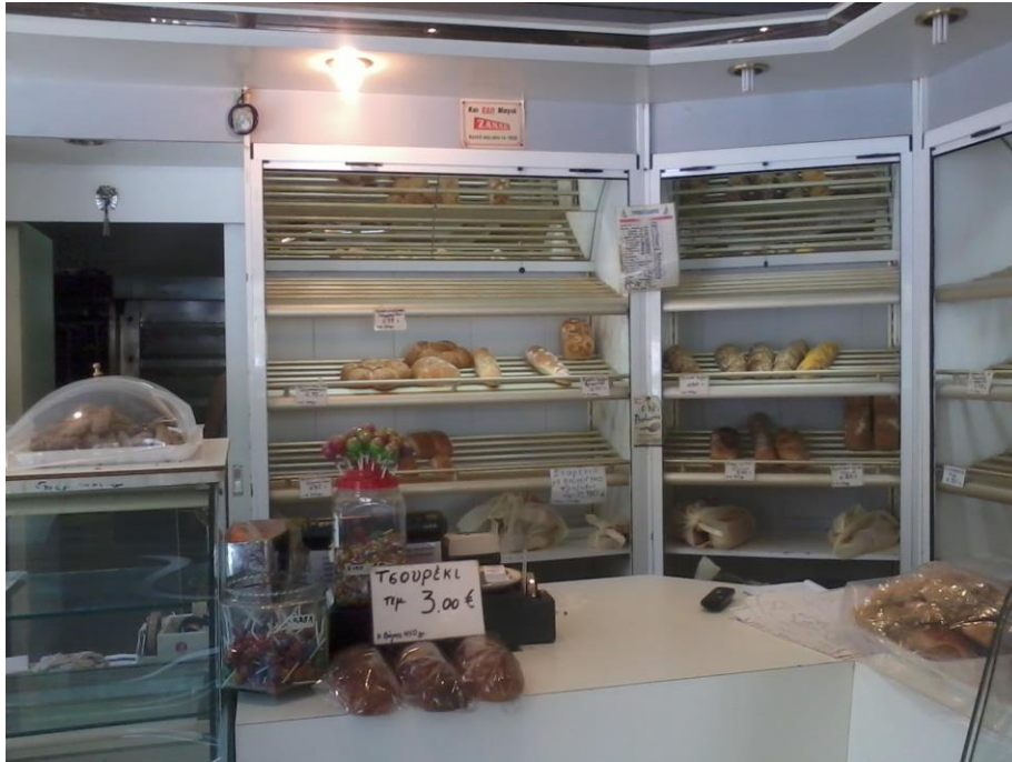
Εικόνα 6: Ο πάγκος πώλησης του ψωμιού

Ο πάγκος πώλησης είναι σε γωνιακό σχήμα, ανάμεσα σε δύο ψυγεία. Πάνω στον πάγκο υπάρχουν, συνήθως, λαμαρίνες με λουκουμάδες, με τσουρεκάκια, κουλούρια και ταχινόπιτες, λευκές χάρτινες συσκευασίες για το ψωμί, η ταμειακή μηχανή, γλειφιτζούρια Chupa-Chups, σοκολατένια αυγά Kinder, και Παγωτομανία Kid (εικ. 6).