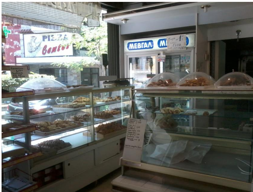
Εικόνα 7: Ο χώρος για τα σφολιτοειδή, η είσοδος που οδηγεί στο εργαστήριο, το ψυγείο και η «βιτρίνα» για κουλουράκια.

Ο πάγκος πώλησης είναι σε γωνιακό σχήμα, ανάμεσα σε δύο ψυγεία. Πάνω στον πάγκο υπάρχουν, συνήθως, λαμαρίνες με λουκουμάδες, με τσουρεκάκια, κουλούρια και ταχινόπιτες, λευκές χάρτινες συσκευασίες για το ψωμί, η ταμειακή μηχανή, γλειφιτζούρια Chupa-Chups, σοκολατένια αυγά Kinder, και Παγωτομανία Kid (εικ. 6).