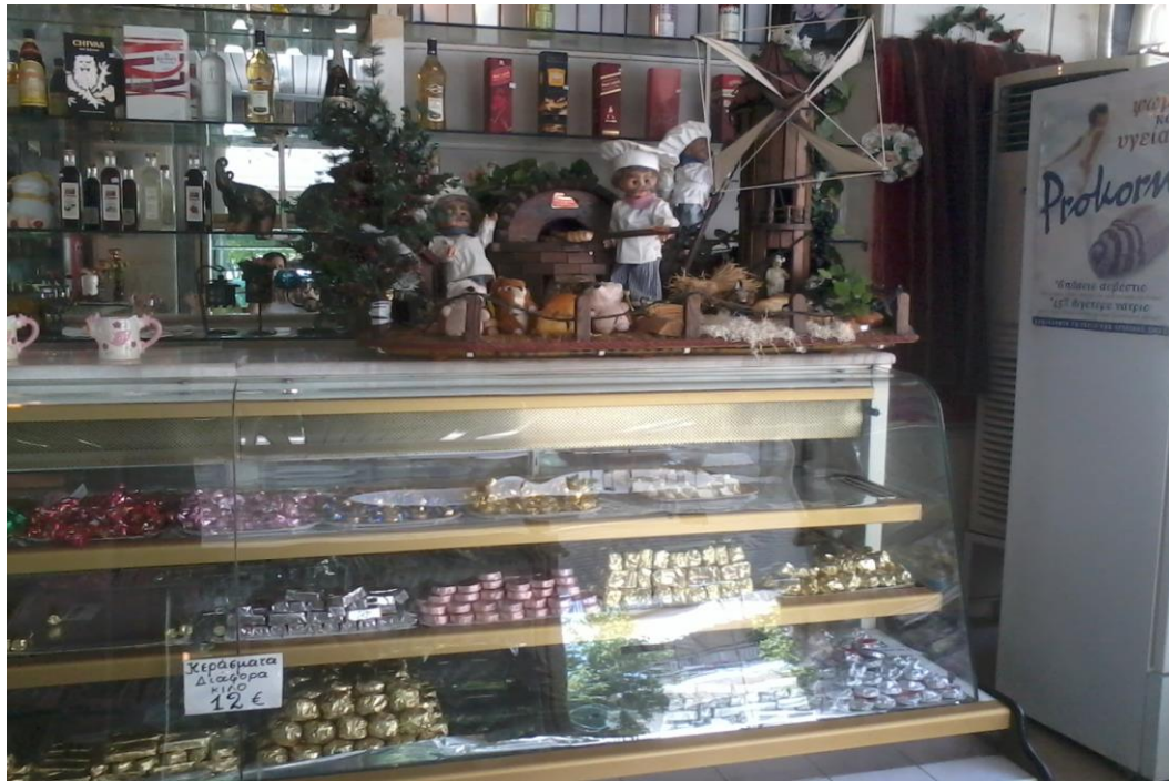
Εικόνα 3: Ψυγείο με τα κεράσματα.

Διακρίνουμε ένα όρθιο ψυγείο για παγωτίνα και πίσω από αυτό ένα όρθιο κλιματιστικό σε απόσταση περίπου 10 μέτρα από το χώρο πωλητηρίου του ψομιοῦ. Από την ἄλλη μεριά της πόρτας υπάρχουν δύο καταψύκτες με τούρτες και τούρτες παγωτοῦ. Απέναντι βρίσκεται ένα ψυγείο με κεράσματα και πάνω του ένα μεγάλο διακοσμητικό που αναπαριστά ένα μύλο και ἕναν ξυλόφουρνο και προϊόντα ἄρτου με τη φιγούρα του φούρναρη ντυμένο στα λευκά να «καλωσορίζει». (εικόνα 3).