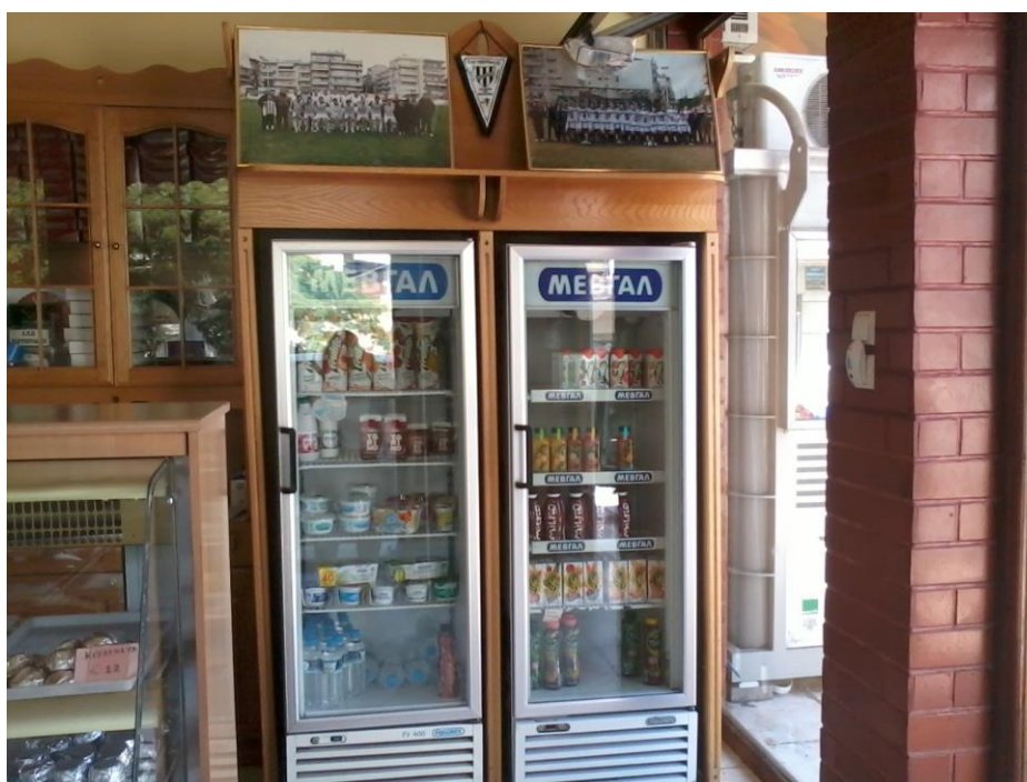
Εικόνα 19: Το ψυγείο και το σήμα της τοπικής ομάδας του «Ελευθεριακού» .

Το ψυγείο είναι εντοιχισμένο στο ξύλινο έπιπλο ως συνέχεια του προηγούμενου. Περιέχει γάλα, μικρού και μεγάλου μεγέθους με κανονικά ή λιγότερα λιπαρά, κεφίρ σκέτο ή με φράουλα, κακάο, νερό μεγάλου και μικρού μεγέθους, γιαούρτι στραγγιστό και με διάφορες γεύσεις, κίτρινο τυρί, φέτα, χυμούς μικρού και μεγάλου μεγέθους με πορτοκάλι, ροδάκινο, βύσσινο ή ανάμεικτο. Στο επάνω μέρος του ψυγείου, υπάρχει ένα διακοσμητικό που απεικονίζει ένα μπαούλο γεμάτο με στάχια και ψωμιά. Πιο κάτω υπάρχει μια φωτογραφία με την τοπική ποδοσφαιρική ομάδα «Ελευθεριακός» και το σήμα της ομάδας κρεμασμένο. (εικ 19).