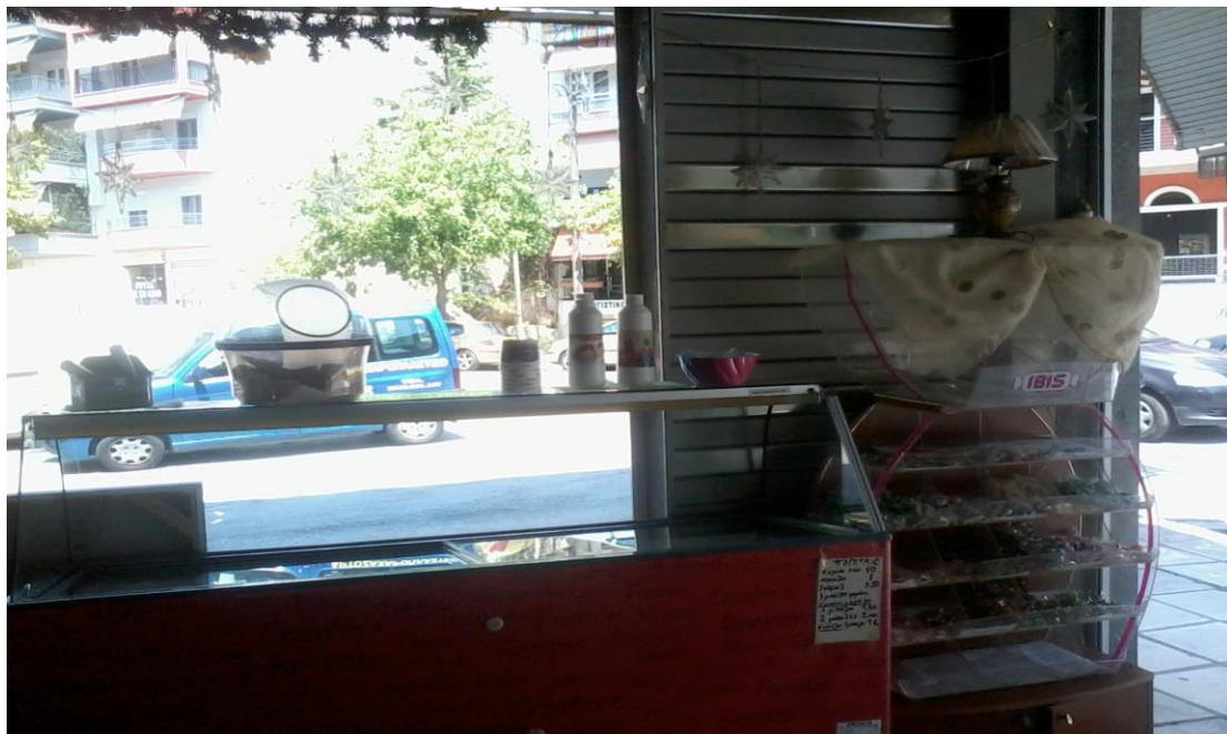
Εικόνα 2: Η είσοδος του καταστήματος. Η όψη από τη δεξιά μεριά.

Μπαίνοντας στο μαγαζί, υπάρχει μια ειδικά διαμορφωμένη κατασκευή για καραμέλες και δίπλα ένα ψυγείο για παγωτό σε διάφορες γεύσεις χωνάκι ή κυπελάκι. (εικ. 2).