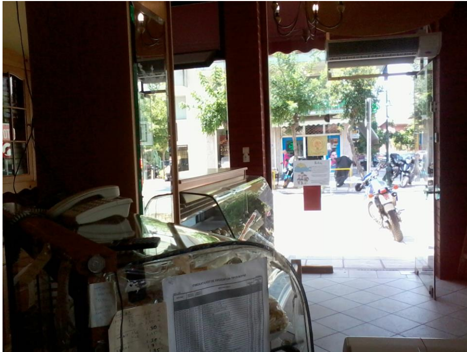
Εικόνα 14: Όψη της εισόδου του μαγαζιού

Στο επάνω μέρος της εισόδου βρίσκεται, στο τοίχο το air-conditioner (εικόνα 14).