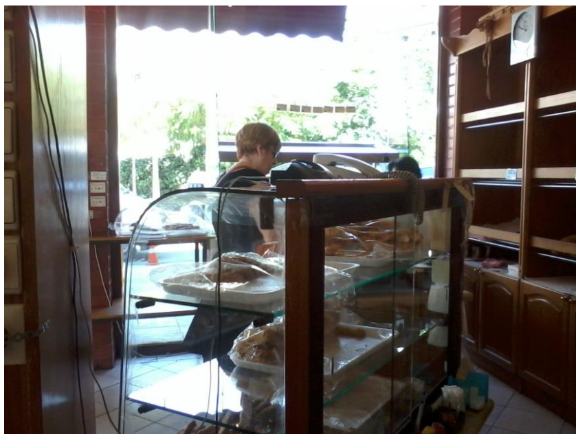
Εικόνα 18: Το σημείο όπου «φιλοξενήθηκε» η ερευνήτρια.

μέρος είναι καλυμμένο με τζαμαρία και έχει διάφορες μικρές εικόνες θρησκευτικού περιεχομένου. Στο κάτω μέρος στα ντουλαπάκια υπάρχουν τα λογιστικά βιβλία του μαγαζιού (εικ. 17).