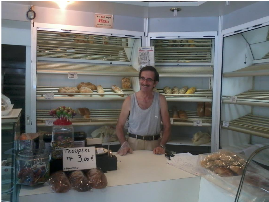
Εικόνα 10: Ο ιδιοκτήτης του καταστήματος καλωσορίζει «εν ώρα υπηρεσίας».