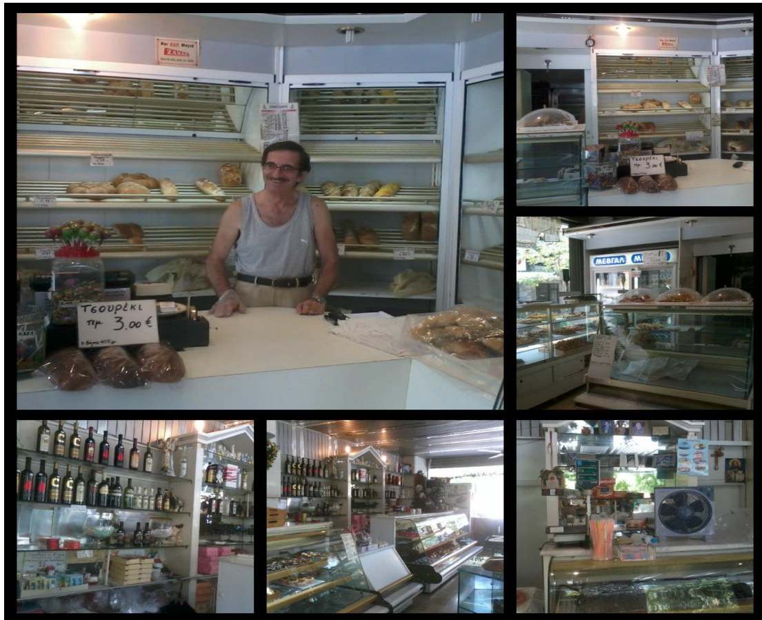
Εικόνα 1: Κολάζ φωτογραφιών του φούρνου στην Κάτω Τούμπα