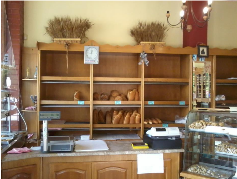
Εικόνα 16: Ο πάγκος πώλησης

Εδώ παρατηρούμε τη μπουγατσιέρα, προσβάσιμη μόνο στην πολήτρια, που περιέχει κυρίως είδη μπουγάτσας, όπως μπουγάτσα με κρέμα ή με τυρί, είδη σφολιάτας μικρού και μεγάλου μεγέθους και πίτσες ατομικού και μικρότερου μεγέθους. Από τη μια άκρη της μπουγατσιέρας, βρίσκεται ο πάγκος του πωλητηρίου, με τη ζυγαριά, τις κόλλες που τυλίγεται το ψωμί και την ταμειακή μηχανή. Από την άλλη μεριά της μπουγατσιέρας, βρίσκεται το ξύλινο έπιπλο που περιέχει το ψωμί. Αποτελείται από τρεις προθήκες στο επάνω μέρος και τέσσερα χωρίσματα. Στο κάτω μέρος υπάρχουν τα ντουλάπια, στο επάνω μέρος υπάρχουν δύο διακοσμητικά που απεικονίζουν μπουσούλα γεμάτα με στάχνα. Στη μικρή κολώνα του πρώτου χωρίσματος του επίπλου, υπάρχει το ρολόι, στη δεύτερη ένα διακοσμητικό «μάτι», στο τρίτο χωρίσμα υπάρχει καθρέφτης με μια εικόνα της Παναγίας και του Χριστού, τέσσερις φωτογραφίες των γιών του αφεντικού και χαρτάκια post-it κολλημένα για υπενθυμίσεις παραγγελιών (εικ. 16).