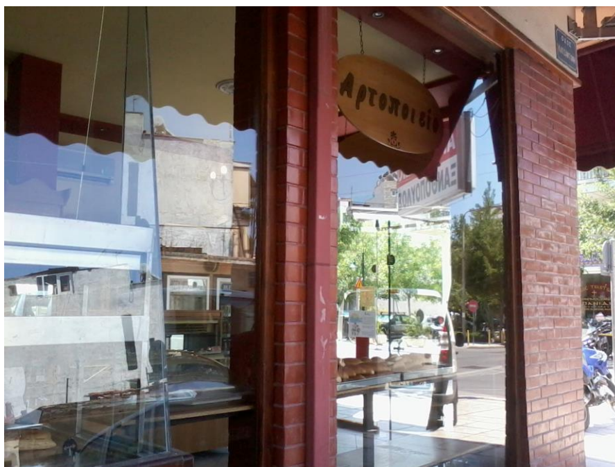
Εικόνα 12: Όψη του καταστήματος από έξω

Το πωλητήριο είναι γωνιακό με τζαμαρία περιμετρικά. Έξω από το κατάστημα υπάρχει μια μεγάλη ταμπέλα που γράφει: «Αρτοποιείο» με λευκά γράμματα και κόκκινο φόντο και στο κάτω μέρος το επώνυμο του ιδιοκτήτη με μαύρα γράμματα. Από έξω φαίνονται οι κόκκινες τέντες και δύο ξύλινες επιγραφές εσωτερικά στις δύο μεριές που γράφουν : «Αρτοποιείο». (εικ. 12).