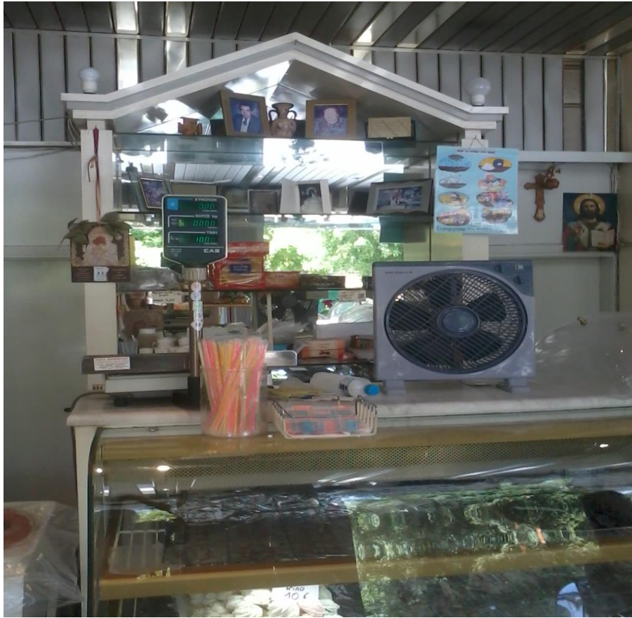
Εικόνα 5: Οι θρησκευτικές και οικογενειακές εικόνες.