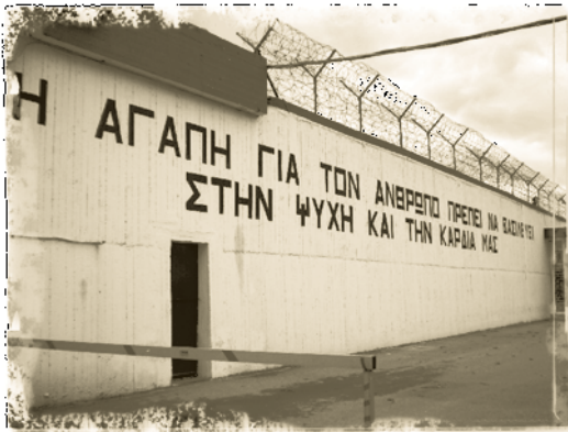
Προαύλιος τοίχος της Φυλακής Διαβατών

στις 10 Μαΐου του 2007. Βλ. Στεργίου, Α. (2007). «Εδώ βασιλεύει η αυθαιρεσία». Εφημ.: Ελευθεροτυπία της 25-4-2007.