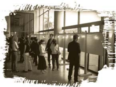
Η εφημερίδα τοίχου που αναρτήθηκε σε εκδήλωση της «Διόδου» στις 12 Μαΐου 2006.

να η προσπάθεια του μουσείου 35 να βγει «εκτός των τειχών» του και να μεταφέρει θεματικά οργανωμένες δράσεις (μουσειοσκευές, κινητές εκθεσιακές μονάδες), εκπαιδευτικό υλικό και εκθέσεις σε χώρους που παραδοσιακά απέχουν από το μουσείο και τη μουσειακή εκπαίδευση. Παραδείγματα τέτοιων δράσεων αφθονούν και στην Ελλάδα, διευρύνοντας κατά το δυνατόν τον κοινωνικό και μορφωτικό ρόλο του μουσείου. Οι συνήθεις χώροι στους οποίους απευθύνονται είναι τα απομακρυσμένα από τις μεγάλες πόλεις σχολεία, χωριά ή γειτονιές κοντά σε αρχαιολογικούς χώρους, σχολικές μονάδες ατόμων με αναπηρίες κ.ά. Υπάρχει, θα λέγαμε, ένας σημαντικός αριθμός μουσειακών εφαρμογών για κοινωνικά σύνολα που υπάγονται στην κατηγορία των φυσικώς αποκλεισμένων από τους μουσειακούς χώρους και τις πρακτικές τους. 36