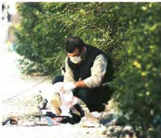
▲ ΣΤΗΝ ΑΝΕΥΡΕΣΗ της γιάφκας επικεντρώνει τις έρευνες της η αστυνομία. Φωτογραφία από διαδικασία ελεγχόμενης έκρηξης ενός παγιδευμένου δέματος

Μέχρι χτες αναζητούνταν άλλα δύο δέματα, καθώς σύμφωνα με τις απαιτήσεις που έδωσαν οι εταιρείες ταχυμεταφορών, η Δευτέρα έφταναν συνολικά 15 δέματα για πρεσβείες και προσημοσίου του εξωτερικού, από τα οποία έχουν εντοπισθεί τα 13.