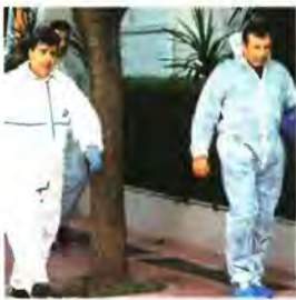
▲ ΕΡΕΥΝΗΤΕΣ ΤΗΣ ΕΛ.ΑΣ. έξω από την πρεσβεία της Ελβετίας, όπου σημειώθηκε μικρή ισχύος έκρηξη

της ελληνικής αστυνομίας ότι οι δύο οψίες της τρομοκρατίας δεν σχετίζονται με οποιονδήποτε τρόπο. «Τα (χθεσινά) γεγονότα διαδραματίζονται σε περιβάλλον κοινωνικής έντασης στην Ελλάδα, λίγες ημέρες πριν από τις κρίσιμες για τους σοσιαλιστές τοπικές εκλογές κι ενώ η