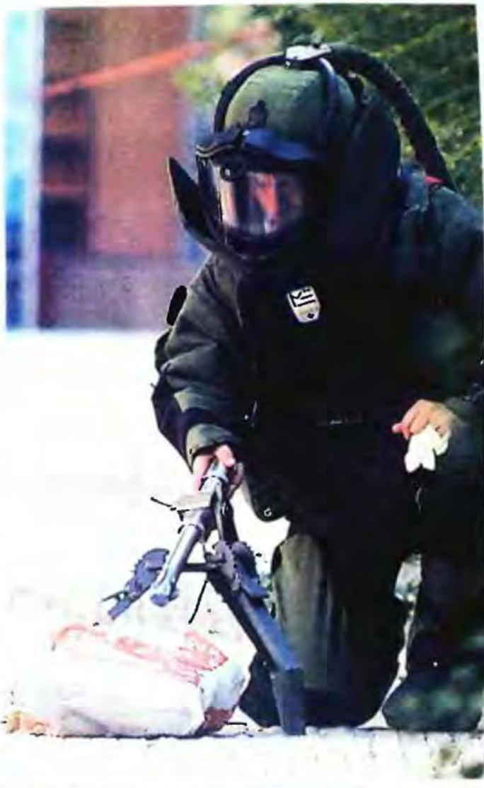
ΠΥΡΟΤΕΧΝΟΥΡΓΟΣ ΕΤΟΙΜΑΖΕΤΑΙ ΝΑ ΕΞΟΥΔΕΤΕΡΩΣΕΙ ΜΕ ΕΛΕΓΧΟΜΕΝΗ ΕΚΡΗΞΗ ΕΝΑ ΠΑΓΙΔΕΥΜΕΝΟ ΔΕΜΑ.

Μέσα από τις συγκρούσεις με τη αστυνομία, τους εμπρησμούς καταστημάτων και τα οδοφράγματα, στρατολογήθηκαν αρκετά νέα μέλη, που έδωσαν άλλη δυναμική στην οργάνωση. Την Πρωτοχρονιά του 2009, οι Πυρρίνες πραγματοποίησαν 14 εμπρηστικές επιθέσεις που τις σφειρώνουν στη μνήμη του μαθητή. Παράλληλα η μέχρι τότε ομάδα εμπρηστών δοκιμάζει νέα μέσο για πιο δυναμικές ενέργειες, κατασκευάζοντας ένα νέο είδος μηχανομητών. Μηχανισμούς αυτού του είδους τοποθέτησαν στις 9 Απριλίου του 2009 στις Μητροπόλεις Αθηνών και Πειραιά και σε δύο ναούς στη Θεσσαλονίκη. Ενών μήνα αργότερα δοκιμάζουν τη χρήση εκρηκτικών μηχανομητών, τοποθετώντας δύο από αυτούς σε Αθήνα και Θεσσαλονίκη, σε ανεγγραμμένο κτήριο όπου επρόκειτο να στεγάσουν αστυνομικές υπηρεσίες. Από εκεί και πέρα, οι πρώην εμπρηστές με τα γκαζόνια πραγματοποιούν αποκλειστικά βομβιστικές ενέργειες και μόλις στα με πολύ μεγάλη συντόπτητα. Στο στόχευσή τους μίληκαν η πρώην υπουργός Παριζιέ Μαριέτα Γιαννάκου, ο συγγραφέας Μίχης Ανδρουλάκης, η προεκλογική συγκέντρωση του πρώην πρωθυπουργού Κώστο Καρμανώλη στο Πεδίον του Αρεως και η νυν υπουργός Εργασίας Λούκα Κατσέλη. Η βόμβα στο σπίτι της κυρίας Κατσέλη συμπίπτει με το πρώτο πλήγμα που δέχτηκε η οργάνωση.