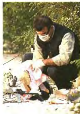
◀ ΑΡΙΣΤΕΡΑ: ΑΣΤΥΝΟΜΙΚΟΣ της Αντιτρομοκρατικής μπροστά στη βόμβα - πακέτο ετοιμάζεται να πραγματοποιήσει ελεγχόμενη έκρηξη. Πάνω, αστυνομικός εξετάζει τα απομεινάρια του εκρηκτικού μηχανισμού. Οι δύο συλληφθέντες είχαν πάνω τους εκτός από τις βόμβες από ένα πιστόλι Glock των 9 mm ο καθένας με πέντε γεμιστήρες συνολικά, ενώ ο ένας από αυτούς, με την περούκα, φορούσε αλεξίσφαιρο γιλέκο και καπέλο τύπου τζόκεϊ