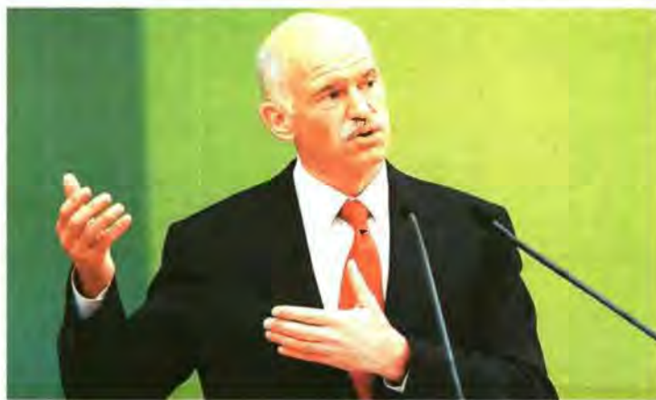
«Ο Γ. ΠΑΠΑΝΔΡΕΟΥ από τα Γιάννενα δεσμεύτηκε ότι θα προφυλάχξει η ασφάλεια των πολιτών

Ο κ. Γ. Πεταλωτής, όταν ρωτήθηκε σχετικά με το «σπίσιμο ενός σκηνικού», απευθύνθηκε ουσιαστικά σε κόμματα της αντιπολίτευσης, ζητώντας... περαιτέρω στοιχεία και αποκρούοντας κάθε θεωρία συνωμοσίας. «Αν μας έλεγαν και ποιοι το σπίνουν αυτό το σκηνικό, θα ήταν καλά. Εν πάση περιπτώσει,