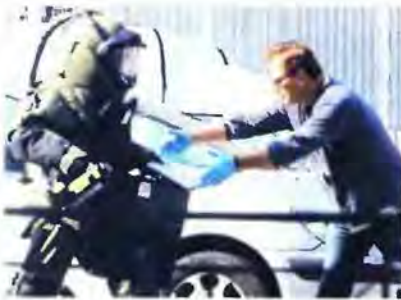
Μέσα σε λίγους μήνες η οργάνωση πέρασε από τους απλούς εκρηκτικούς μηχανισμούς στην κατασκευή παγιδευμένων με εκρηκτικά δεμάτων.