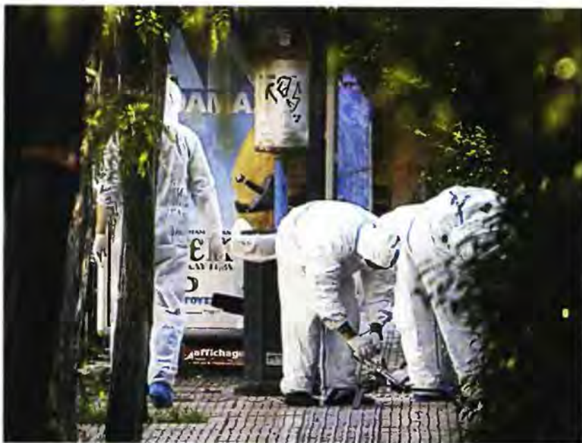
Έρευνες της Αντιτρομοκρατικής στην οδό Ριζάρη μετά την ελεγχόμενη έκρηξη πακέτου που βρέθηκε σε στάση Λεωφορείου. Κάτω, αστυνομικοί εξετάζουν ύποπτο δέμα στην οδό Καλλιπόρως.