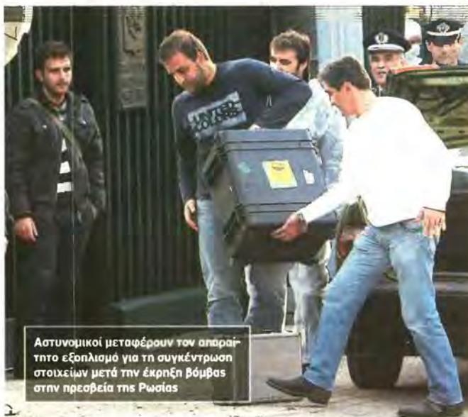
Αστυνομικοί μεταφέρουν τον απαριτητο εξοπλισμό για τη συγκέντρωση στοιχείων μετά την έκρηξη βόμβας στην πρεσβεία της Ρωσίας

Λίγη ώρα αργότερα ένας ταχυμεταφορέας που μετέφερε δέμα στην πρε-