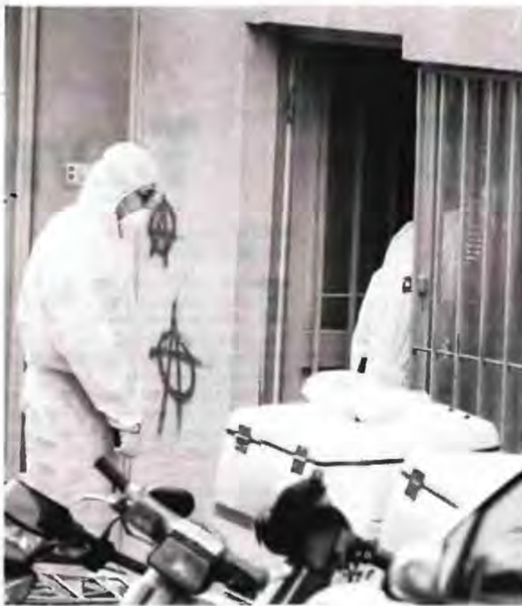
Οι προβολείς διεθνώς πέφτουν στους ελέγχους στις εταιρείες κούριερ για «κόκκινα» δεμάτα