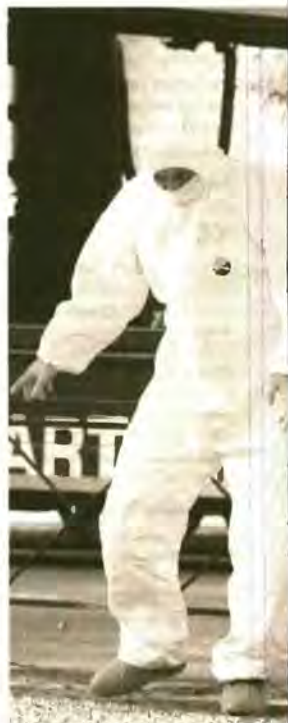
Με ελεγχόμενη εκρήξη εξουδετερώθη

αναζητά στοιχεία από τις μαρτυρίες των υπαλλήλων των εταιρειών κούριερ και τα εγκληματολογικά εργαστήρια ψάχνουν για τυχόν δακτυλικά αποτυπώματα στους φακέλους, ενώ ερευνούν και τις κλήσεις που είχαν γίνει από τις τηλεκάρτες που σύμφωνα με την Αστυνομία—βρέθηκαν στην κατοχή των συλληφθέντων. Εν τω μεταξύ οι άνδρες του Τμήματος Εξουδετέρωσης Εκρηκτικών Μηχανισμών εξακολουθούν