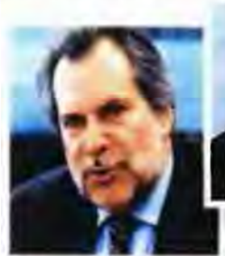
ΧΡ. ΠΑΠΟΥΤΣΗΣ Πρώτη δοκιμασία

«Απόλυτα ικανοποιημένος» δήλωσε χθες ο υπουργός Προστασίας του Πολίτη Χρήστος Παπουτσής από τα αντανakλαστικά της Αστυνομίας σε ό,τι αφορά την υπόθεση με τα δέματα-βόμβες. Όσο για τις αποστολές των παγιδευμένων φακέλων σε ξένους ηγέτες, απέδωσε την υπαιτιότητα στα κενά ασφαλείας στις ταχυμεταφορές, επισημαίνοντας μάλιστα ότι το θέμα αυτό «αφορά την παγκόσμια κοινότητα». Η σύλληψη των δύο νεαρών «πιστώνεται» στην ΕΛ.ΑΣ., ωστόσο είναι φανερό ότι υπάρχουν κενά τόσο στην αστυνομική επιχείρηση όσο και στην ενημέρωση - παρότι ο αρμόδιος υπουργός δήλωσε ότι θα γίνουν ανακοινώσεις όταν ολοκληρωθεί η επιχείρηση. Προφανώς, όταν ολοκληρωθεί η επιχείρηση θα γίνει και ο απολογισμός για την πρώτη σοβαρή δοκιμασία που αντιμετωπίζει ο Χρήστος Παπουτσής ως υπουργός Προστασίας του Πολίτη.