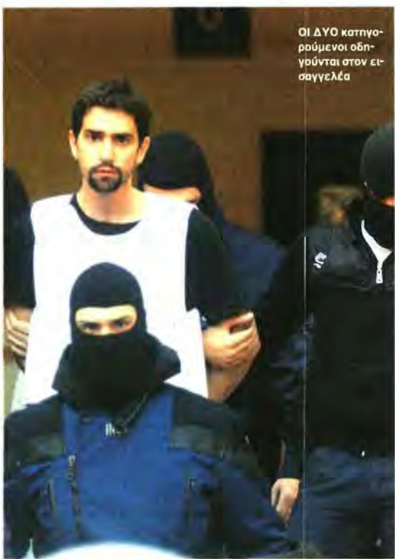
ΟΙ ΔΥΟ κατηγορούμενοι οδηγούνται στον εισαγγελέα

Ο ΝΙΚΟΛΑ ΣΑΡΚΟΖΙ συγκάλεσε σήμερα έκτακτη σύσκεψη για την αντιμετώπιση της τρομοκρατικής απειλής πρωτοβουλία πάντως που δε» είχε σχέση με τα τεκταινόμενα στην Ελλάδα