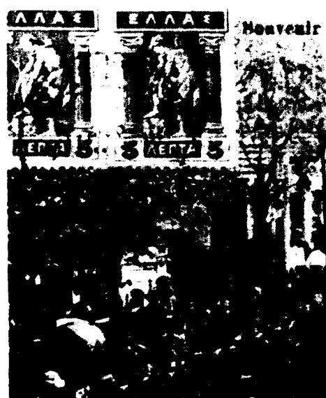
SALONIQUE. — Incendie. — 19 A-4: 1917.

ανταγωνισμό που διακρίνει τις σχέσεις τους με τους Έλληνες.