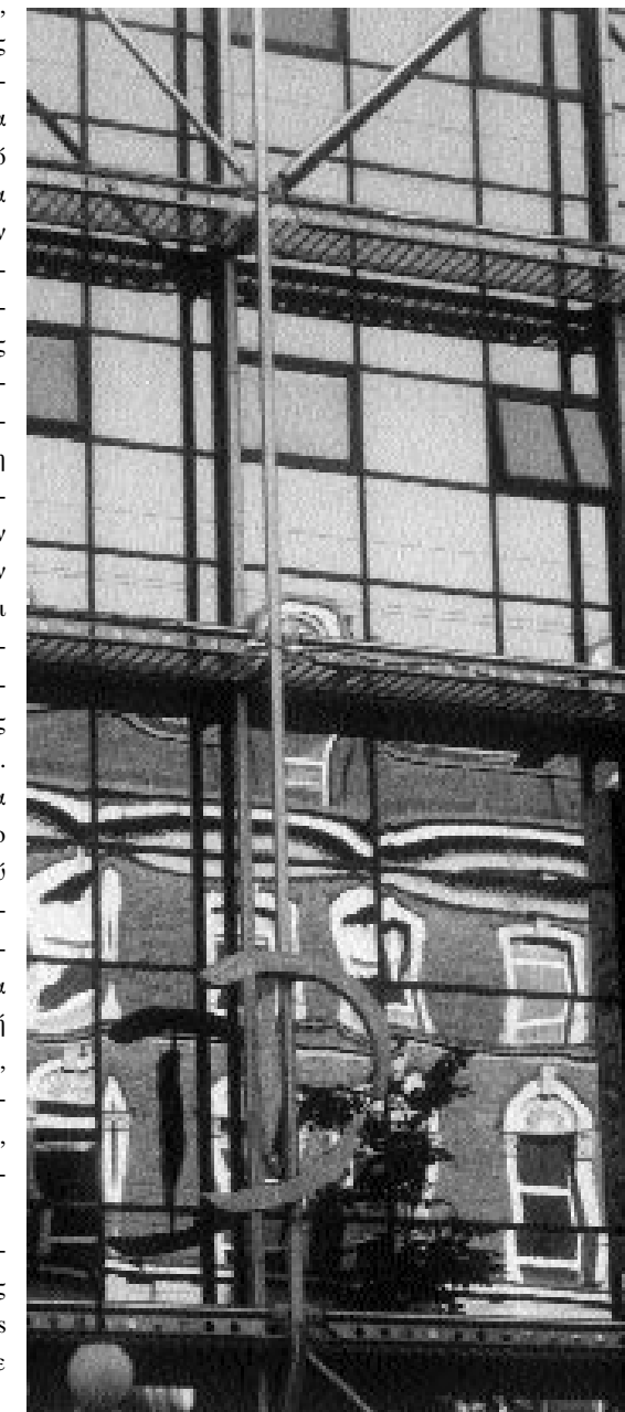
LIBER ΣΥΓΧΡΟΝΑ 217 ΘΕΜΑΤΑ