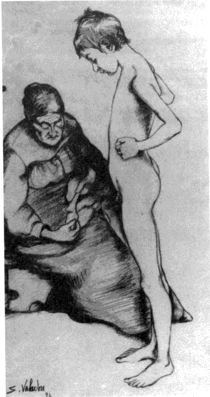
Σοζιάν Βαλαντόν, Ο Οντριλό και η γιαγιά του, 1894