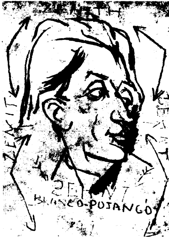
Tihanyi Lajos, Πορτρέτο του Branco Pojanco, 1920

9. Το άρθρο του 1926 είναι το “L'art pour l'art und die Proletarische Dichtung”, Die Tat , Ιούν. 1926, το οποίο παραπέμπει (υποθετώντας τις) στις κριτικές της Προλετκούλτ από τον Τρότσκι. Το άρθρο του 1927 είναι το “Eine Marxkritik im Dienste des Trotzismus. Rez. Von Eastman: Marx, Lenin, and the Science of Revolution”. Die Internationale , 6.X.1927.