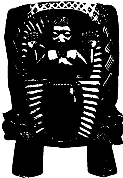
Bande, Ξύλινη κολυμπήθρα, 1965