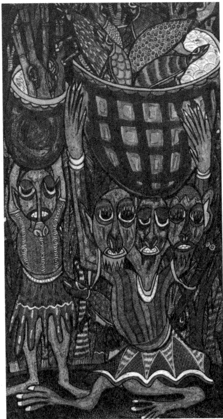
Twins Seven Seven, Ο ερπαστής των ψαριών, Νιγηρία 1989