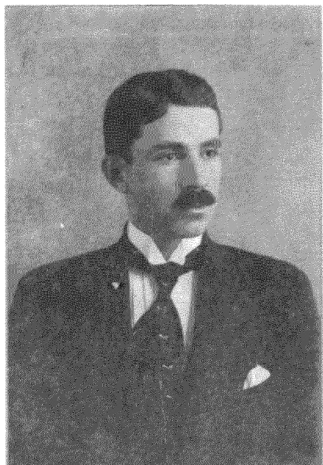
Κώστας Βάρναλης, 1912