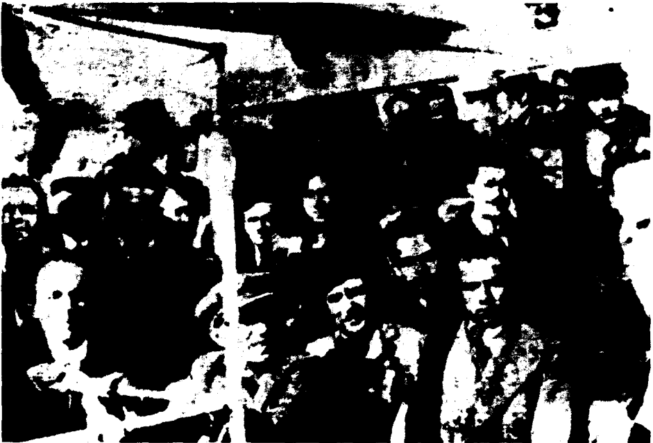
Δ. Γληνός και Κ. Βαρναλής. Προς την εξορία. 1935

Κ' ένα στηλώνει κι ανασταίνει το 'να βασίλειο της Δουλειάς, (ειρήνη, ειρήνη!) το βασίλειο της Παναθρώπινης Φιλιάς.