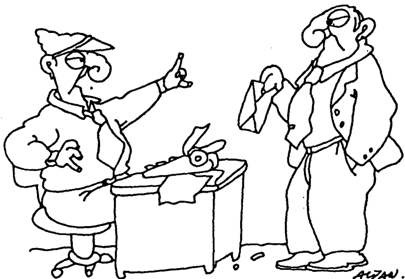
Το σκίτσο του Αλτάν είναι από την «Βαβέλ»

ΣΤ' ΑΡΧΙΑΙΑ ΜΑΣ ΑΥΤΟ ΠΟΥ ΣΚΕΦΤΕ- ΣΤΕ. ΑΥΤΟ ΠΟΥ ΓΡΑΦΕΤΕ ΜΑΣ ΕΝΔΙΑΦΕΡΕΙ.