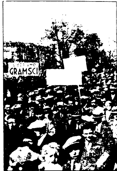
Διαδήλωση για τον Γκράμσι στο Παρίσι.