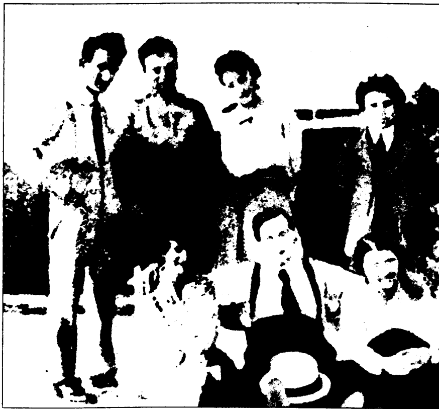
Καλοκαίρι 1916 μαζί με μερικούς συντρόφους στο εργατικό επιμελητήριο του Τορίνο: δίπλα στον Γκράμσι (πρώτος πάνω δεξιά) ο Μάριο Γκουαρνιέρι, ο Τζιουζέπε Μπιάνκι, η Όλγα Παστόρε καθισμένοι, ο Οτάβιο Παστόρε και δύο συντρόφισσες από τη γραμματεία.

Στα κείμενα της περιόδου 1919 – 1920 συναντάμε ελάχιστες διατυπώσεις για την έννοια της ηγεμονίας και των ταξικών συμμαχιών 22 γιατί δεν έχουν αναπτυχθεί ακόμα όλοι οι όροι που συνδέονται με το πρόβλημα αυτό. Έχουμε ήδη εξηγήσει τους όρους με τους οποίους διαμορφώνεται μια πρώτη έννοια της ηγεμονίας την περίοδο αυτή και τις εμφανείς αδυναμίες της. Σταδιακά ο Γκράμσι αρχίζει να κατανοεί την περιπλοκότητα που παρουσιάζουν οι κοινωνίες της Δύσης και να προβληματίζεται για τη δυνατότητα εφαρμογής μιας στρατηγικής ανάλογης με αυτή που εφάρμοσαν οι Μπολσεβίκοι. Γράφει σχετικά «Ο καθορισμός που στην Ρωσία ήταν άμεσος και οδήγησε τις μάζες στους δρόμους για μια επαναστατική εξέγερση, στην κεντρική και δυτική Ευρώπη είναι περίπλοκος με όλες αυτές τις πολιτικές υπερδομές, που δημιουργούνται από την μεγαλύτερη ανάπτυξη του καπιταλισμού. Αυτό κάνει τη δράση των μαζών πιο αργή και περισσότερο προσεκτική και επομένως απαιτεί από το επαναστατικό κόμμα μια στρατηγική και τακτική περισσότερο σύνθετη και μακροχρόνια απ' αυτές που ήταν απαραίτητες για τους Μπολσεβίκους στην περίοδο ανάμεσα στο Μάρτη και το Νοέμβρη του 1917» 23 . Η επιχειρηματολογία του Γκράμσι κινείται από τη μια μεριά με βάση την κατανόηση των πρόσθετων δυσκολιών που δημιουργούνται