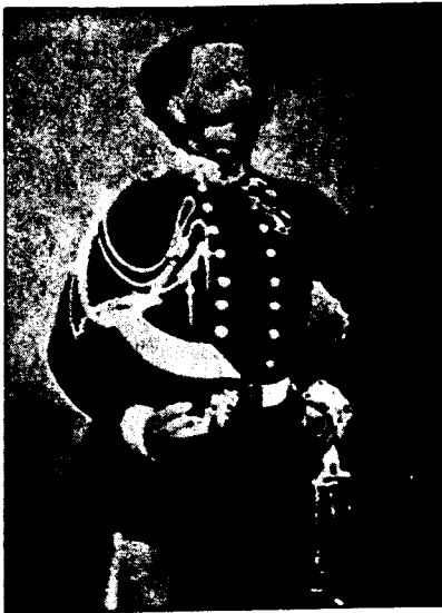
Βίκτωρ Εμμανουήλ Β΄.

Ο Γκράμσι θα αντιμετωπίσει με αυστηρότητα αυτή την εκδοχή. «Η προσπάθεια να βρεθεί κάποιος γενετικός δεσμός μεταξύ των πνευματικών εκδηλώσεων των καλλιεργημένων τάξεων της Ιταλίας διαφόρων εποχών συνιστά ακριβώς την εθνική «ρητορική»: η πραγματική ιστορία συγγέεται με τα φαντάσματα της ιστορίας» (R), θα επιστημάνει, για να ξανατονίσει σε άλλο σημείο ότι η πραγματικότητα είναι διαφορε-