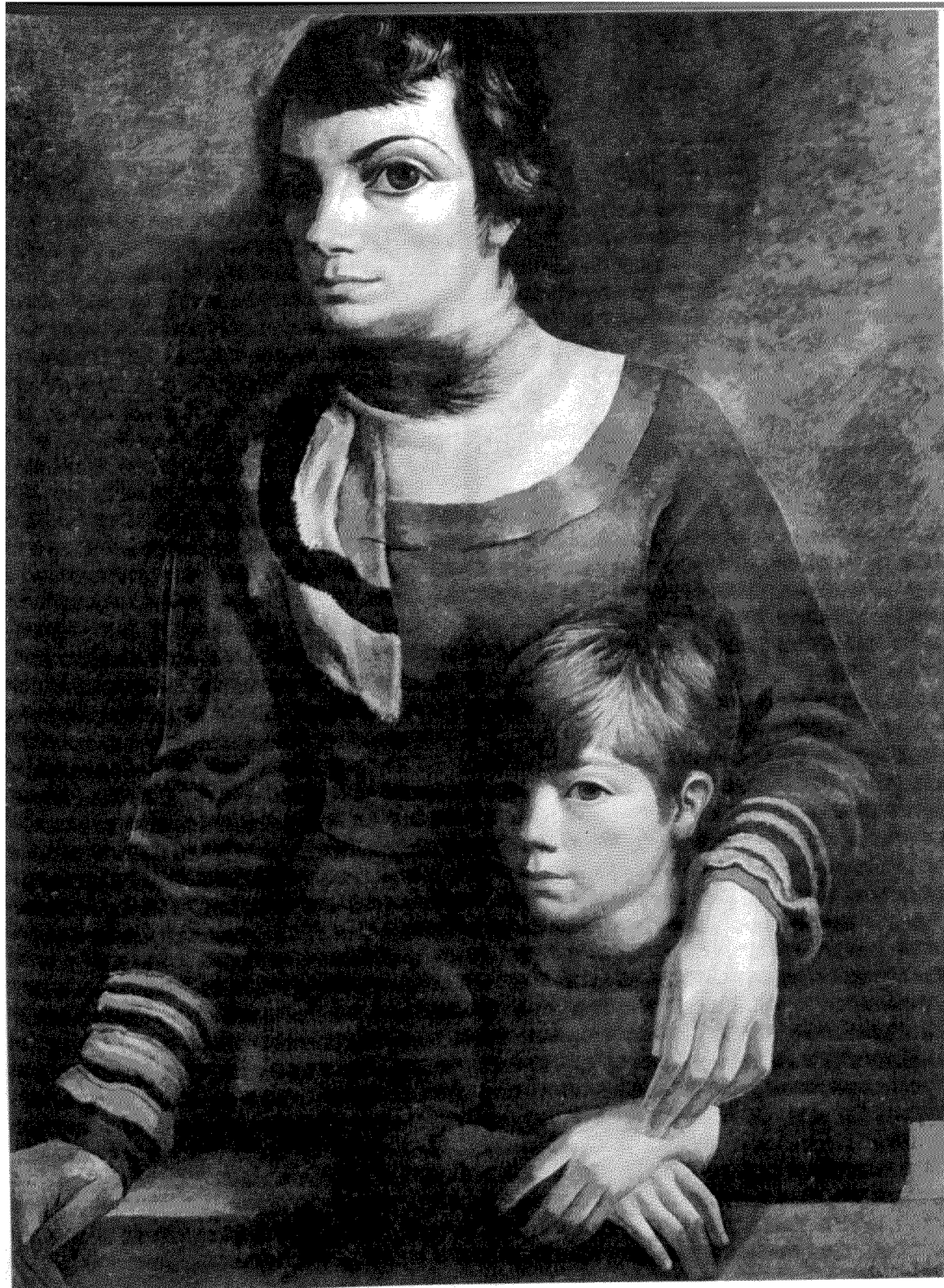
Lino Enea Spilimbergo, Μορφές, 1937, Αργεντινή.