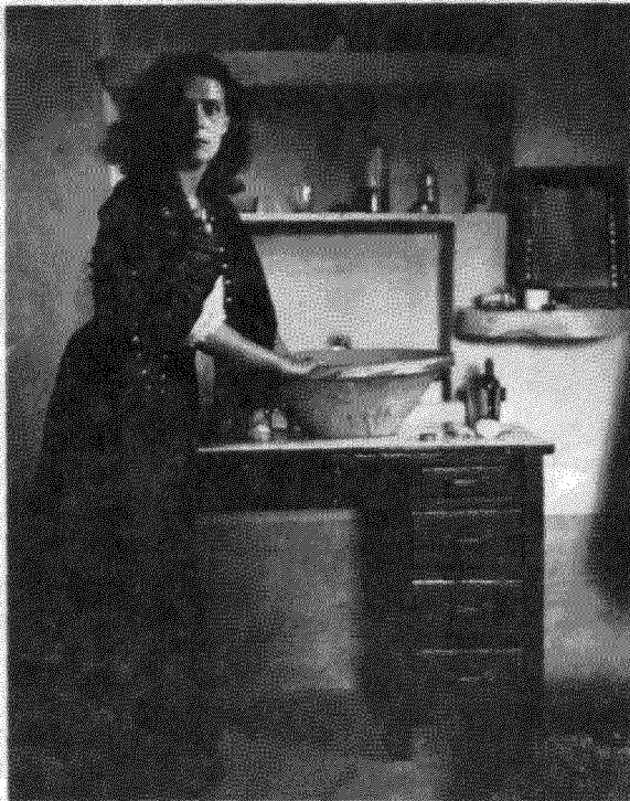
Η Leonora Carrington στο St. Martin d' Ardèche

17. Scient. American , Febr. '93, Science and the Citizen, p. 8. Το νέο πρόγραμμα αποτελεί συνέχεια του γνωστού SETI (Search for Extraterrestrial Intelligence).