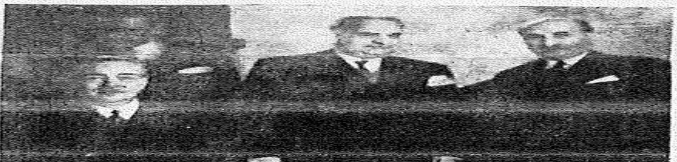
Ο κ. Τσαλδάρη εν μέσω του Τούρκου Υπουργού των Εξωτερικών κ. Σαυτάκ και του εν Παρισίω Πρεσβευτού της Τουρκίας, εις την εν Παρισίω Ελληνικην Πρεσβειαν, όπου διεξήχθησαν Ελληνοτουρκικαί συνομιλίαι

ροσιν της ερώσεως και από κρουσιν τούτης επίθεσεως. Το πενταμηνίο σύμφωνον άποστέλλει ένα πνεύμα ενότητος της Ευρώπης με αποτελεσματικην δημιουργίαν ισχυρού συνασπισμού.