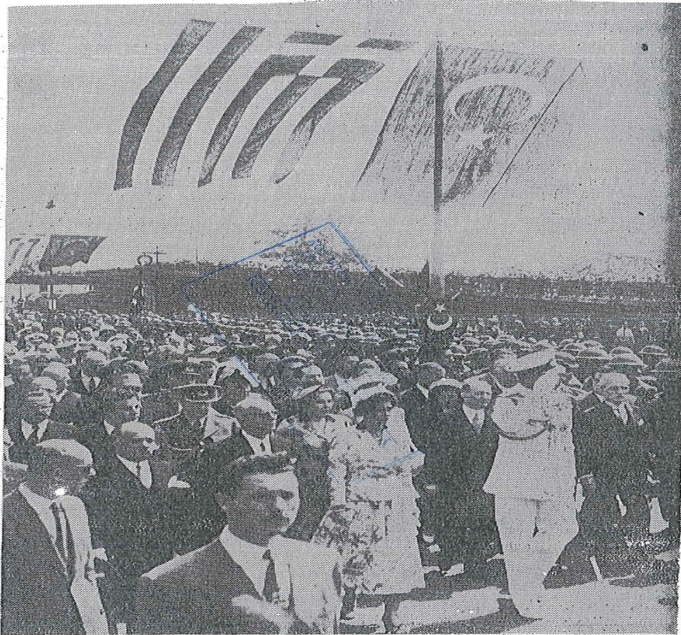
Φύλλο της τουρκικής εφημερίδας «En Son Dakika», 14/6/1952, φωτογραφία της υποδοχής του βασιλικού ζεύγους της Ελλάδας από το λαό της Κωνσταντινούπολης, ΥΔΙΑ, ΚΥ, 1952, Φ. 24.1