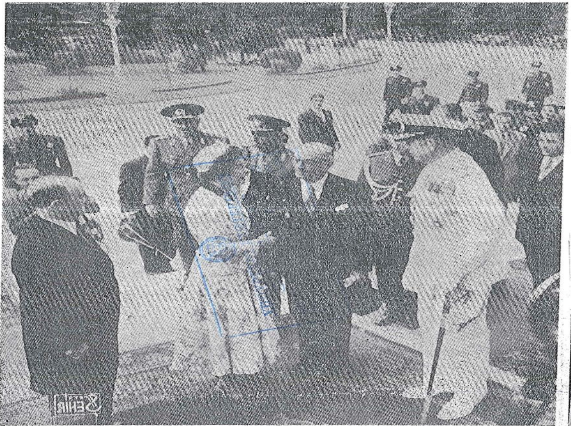
Οι βασιλείς, ο Πρόεδρος της Δημοκρατίας και ο Υπουργός των Ξεχωτερικών, πρό της εισόδου των Ανακτόρων του Δολμά Βαζέ