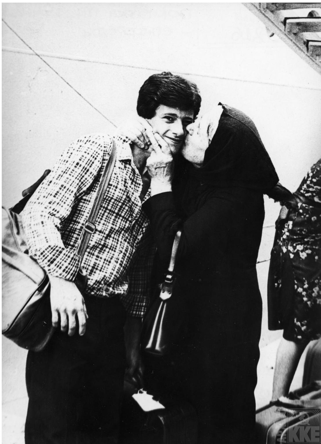
Υποδοχή ελλήνων πολιτικών προσφύγων κατά την επιστροφή τους στην πατρίδα