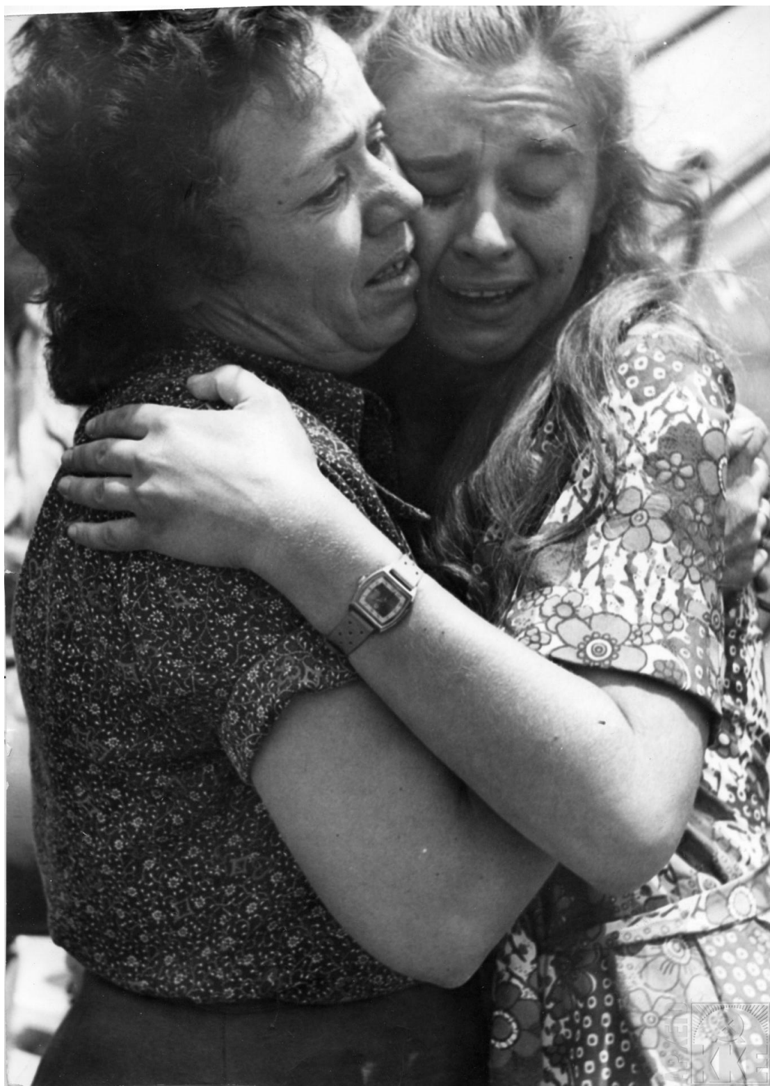
Υποδοχή ελλήνων πολιτικών προσφύγων κατά την επιστροφή τους στην πατρίδα