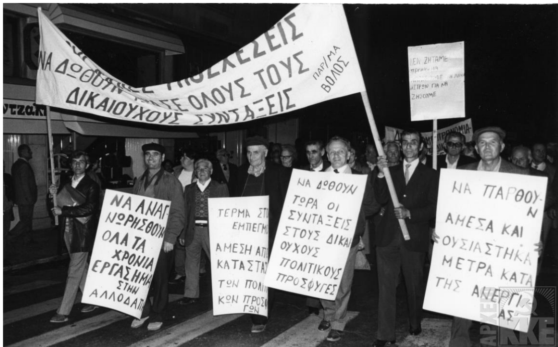
Πορεία επαναπατρισθέντων πολιτικών προσφύγων