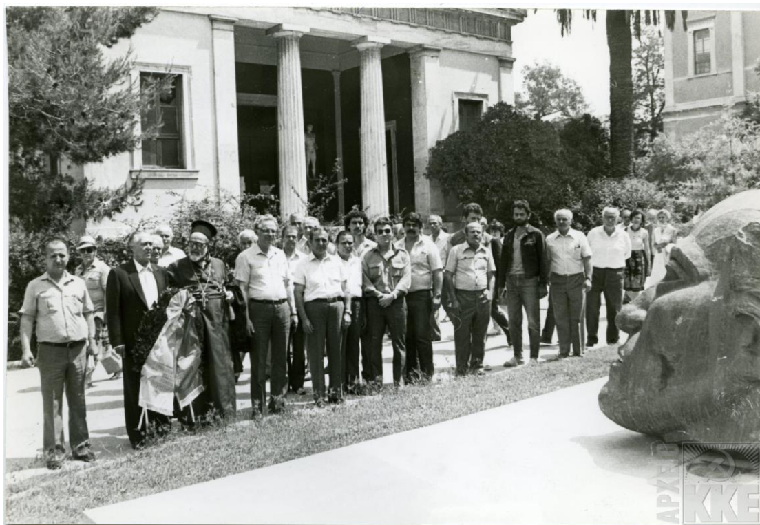
Πανελλήνια Ένωση Επαναπατρισθέντων, 29/5/1983