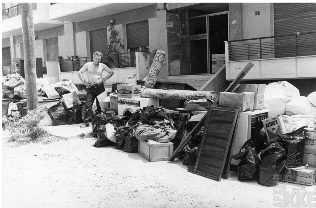
Έξωση πολιτικού πρόσφυγα στην Κάτω Τούμπα, 14/7/1983