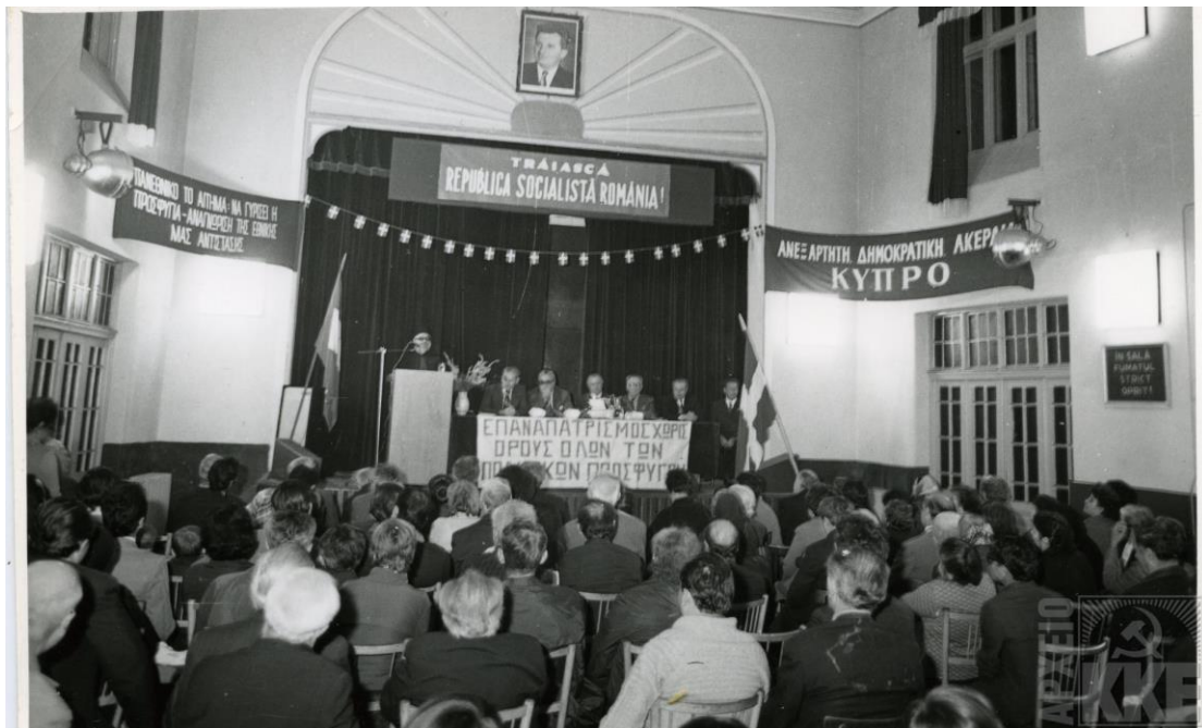
Εκδήλωση πολιτικών προσφύγων στη Ρουμανία για τον επαναπατρισμό