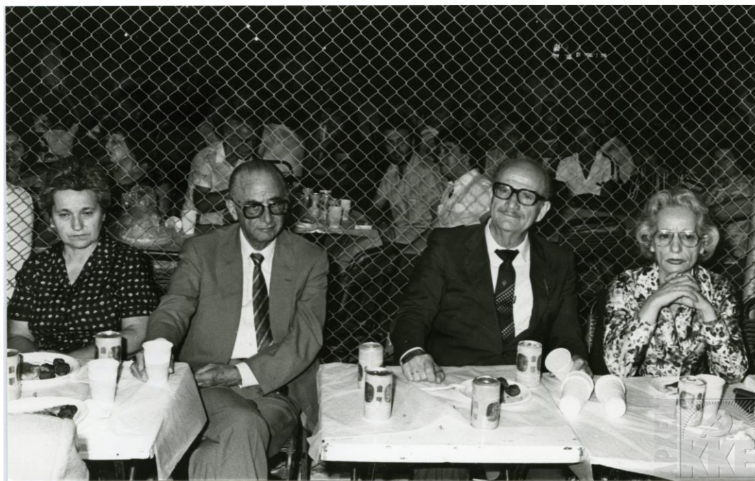
Εκδήλωση για τον επαναπατρισμό των πολιτικών προσφύγων, Αριθ. μητρώου 160