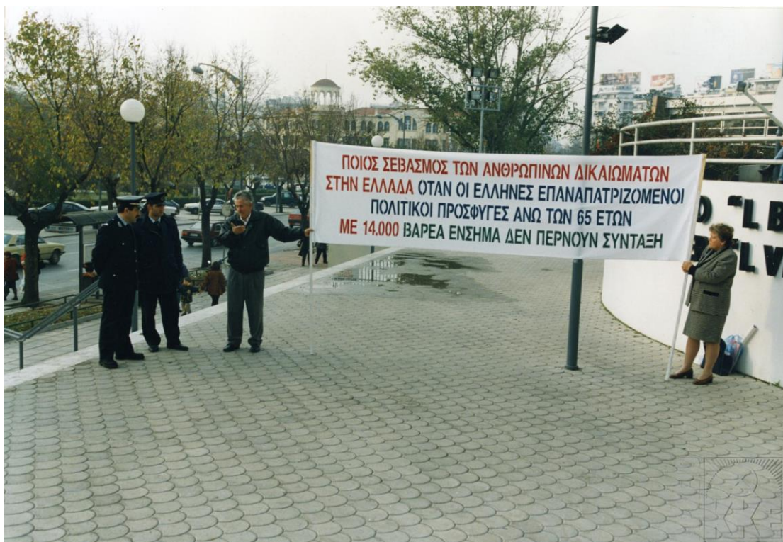
Από διαμαρτυρία επαναπατρισθέντων στη ΔΕΘ