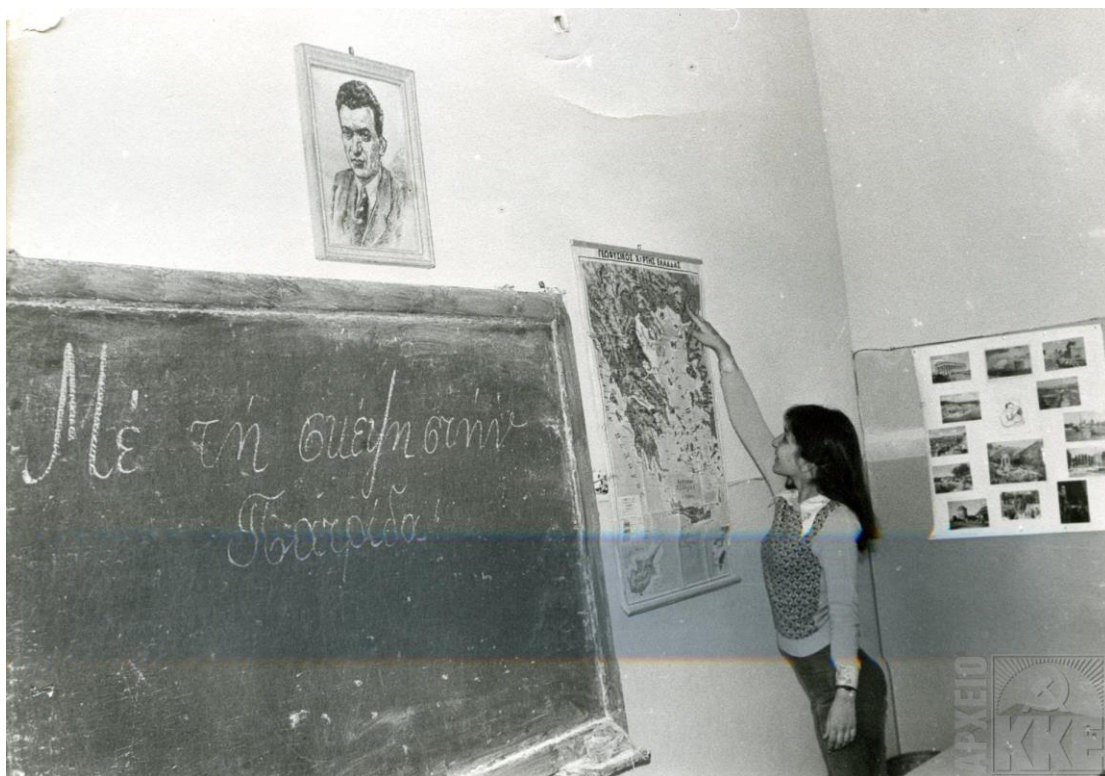
Σχολείο πολιτικών προσφύγων στη Βουλγαρία, Αριθ. μητρώου 637