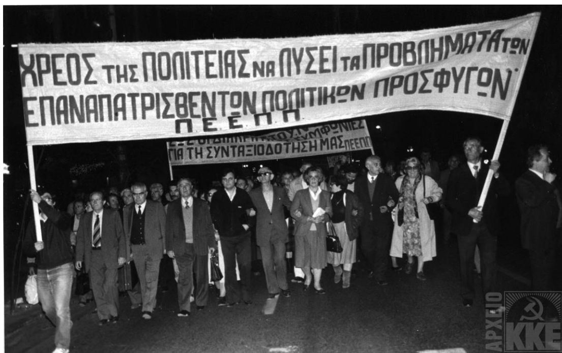
Κινητοποίηση επαναπατρισθέντων πολιτικών προσφύγων