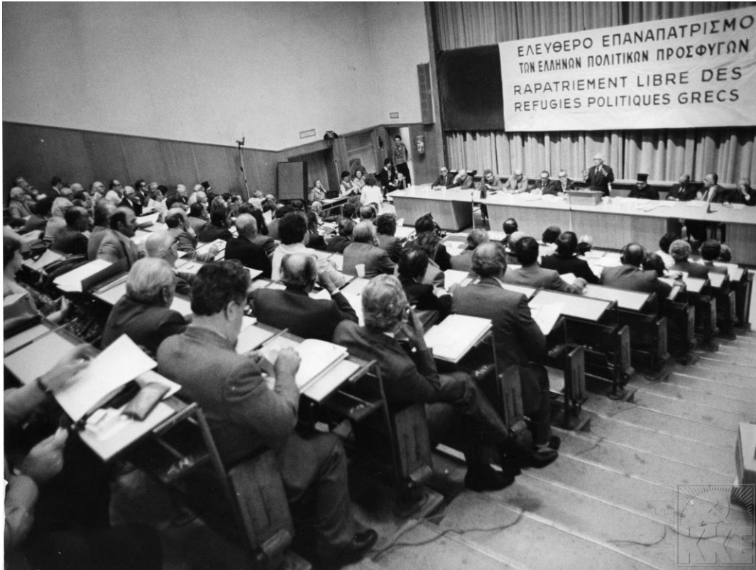
Στο αμφιθέατρο του Πολυτεχνείου: Διεθνής Διάσκεψη για τον επαναπατρισμό των ελληνικών πολιτικών προσφύγων, 15/10/1979