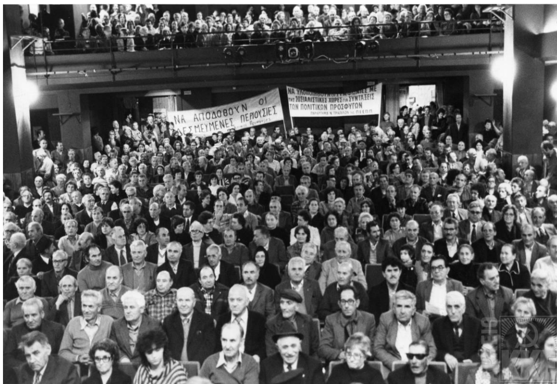
Συγκέντρωση επαναπαρισθέντων πολιτικών προσφύγων στο θέατρο «Διάνα»,