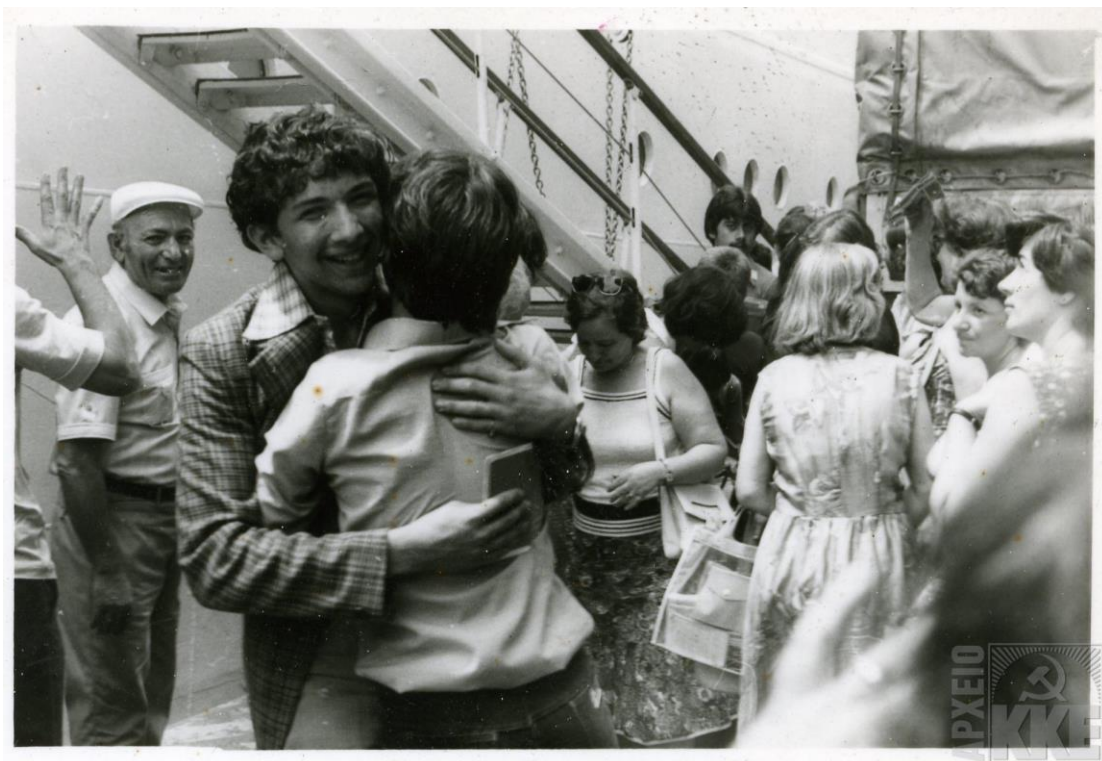
Επιστροφή πολιτικών προσφύγων, Αριθ. μητρώου 142