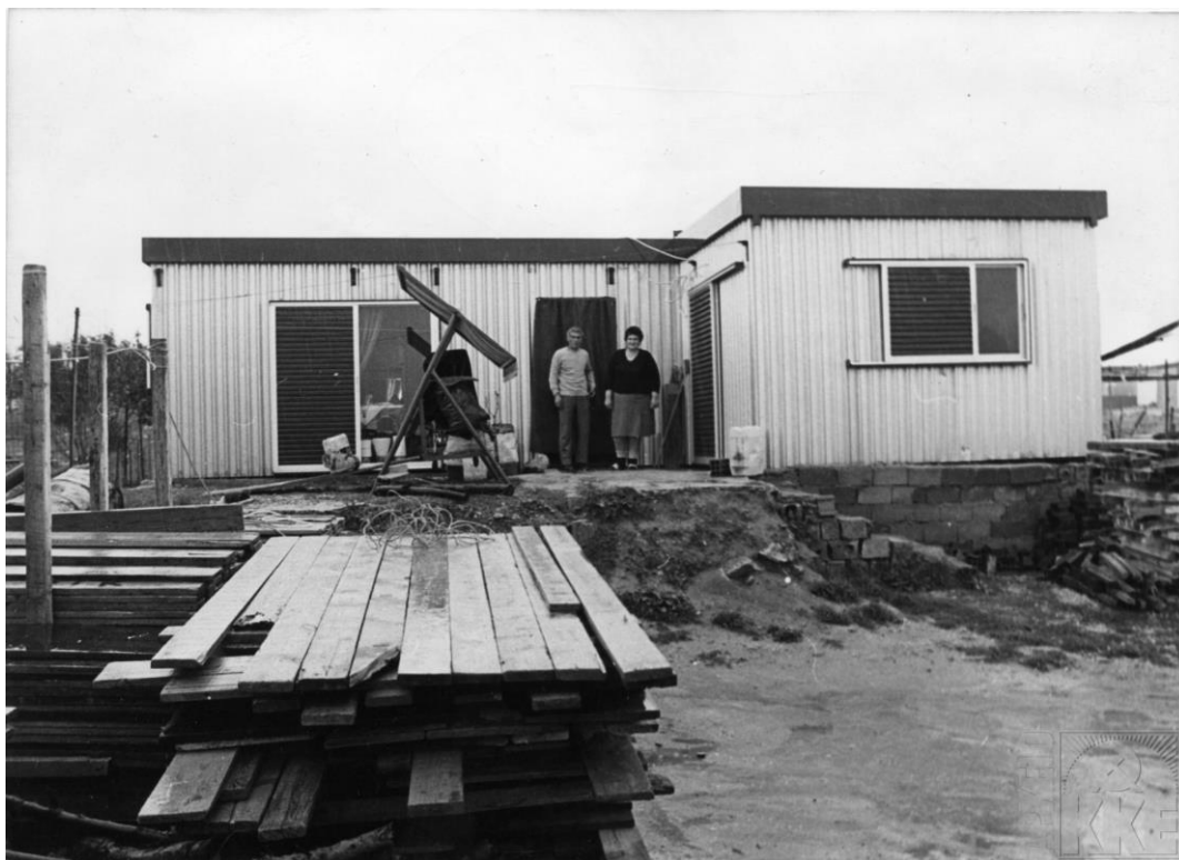
Μενίδι: λύομενο του Α. και της Β. Καραγιώργη, επαναπατρισμένων από την ΕΣΣΔ