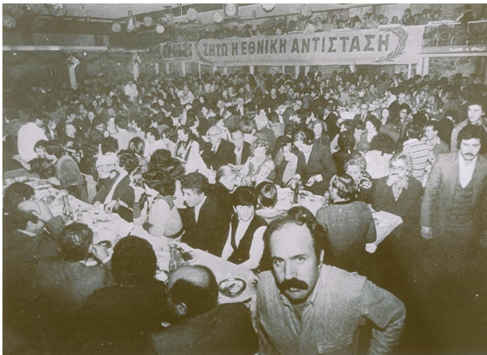
Συνεστίαση συλλόγων επαναπατρισθέντων στην ταβέρνα «Καλύβα» [Ενημερωτικό Δελτίο, Περίοδος Α', Χρόνος 2 ος , Τεύχος 6, Δεκέμβριος 1981 - Γενάρης 1982, σ. 9, Αρχείο «Χαρίλαος Φλωράκης»]