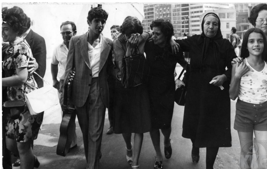
Από την επιστροφή των ελλήνων πολιτικών προσφύγων στην πατρίδα