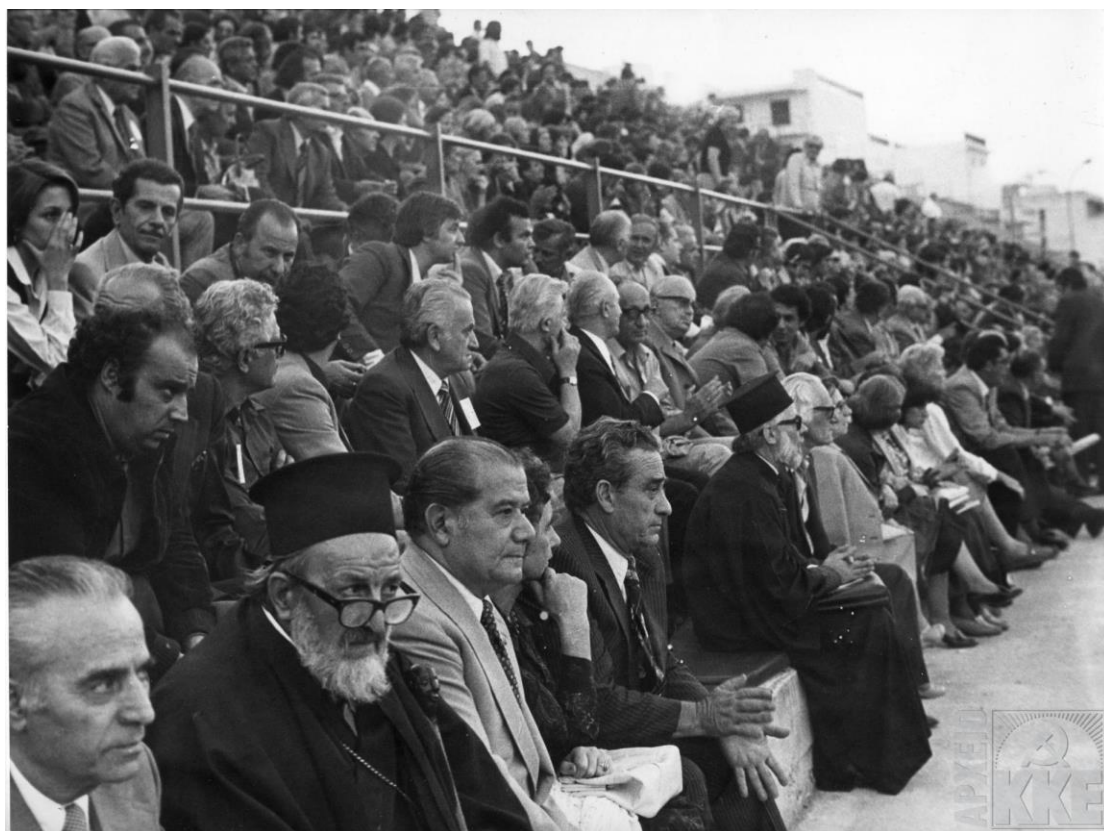
Από συγκέντρωση για τον επαναπατρισμό των ελληνικών πολιτικών προσφύγων