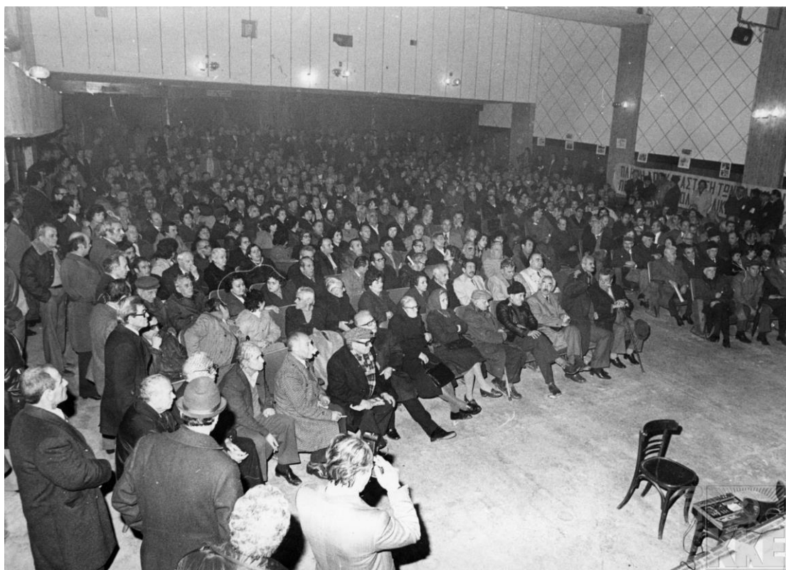
Συγκέντρωση των επαναπατρισθέντων πολιτικών προσφύγων στον κινηματογράφο