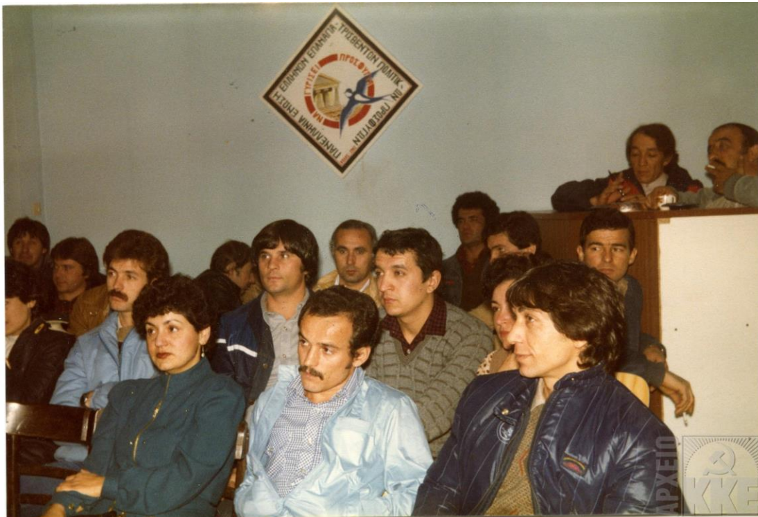
Συνέλευση νεολαίας για τον επαναπατρισμό των πολιτικών προσφύγων, Βόλος 1982