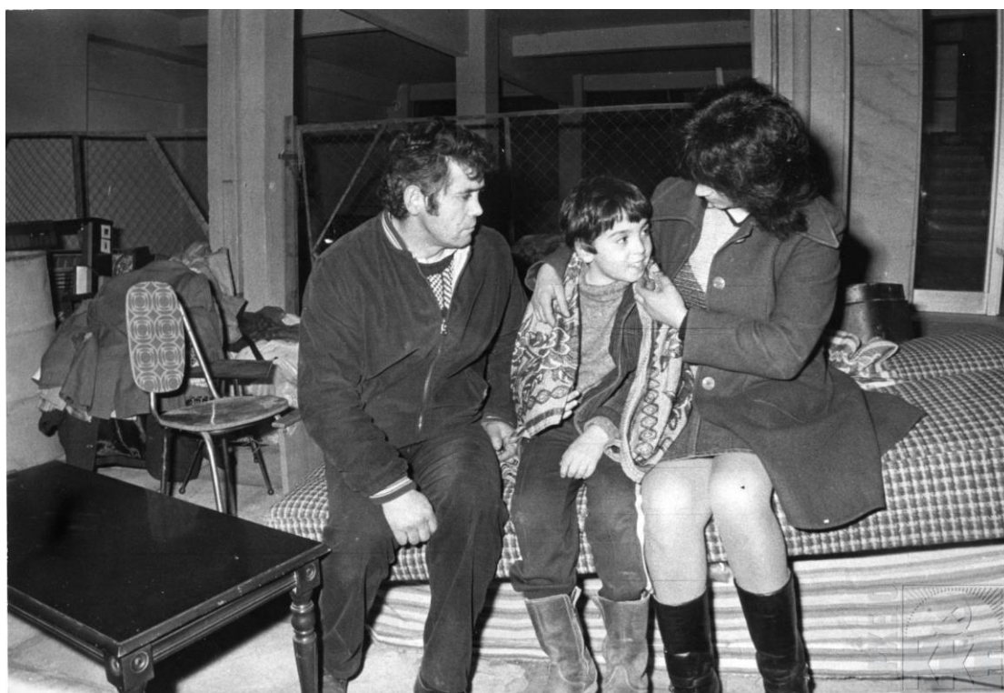
Οικογένεια πολιτικών προσφύγων μένει στο δρόμο στη Θεσσαλονίκη, 1985