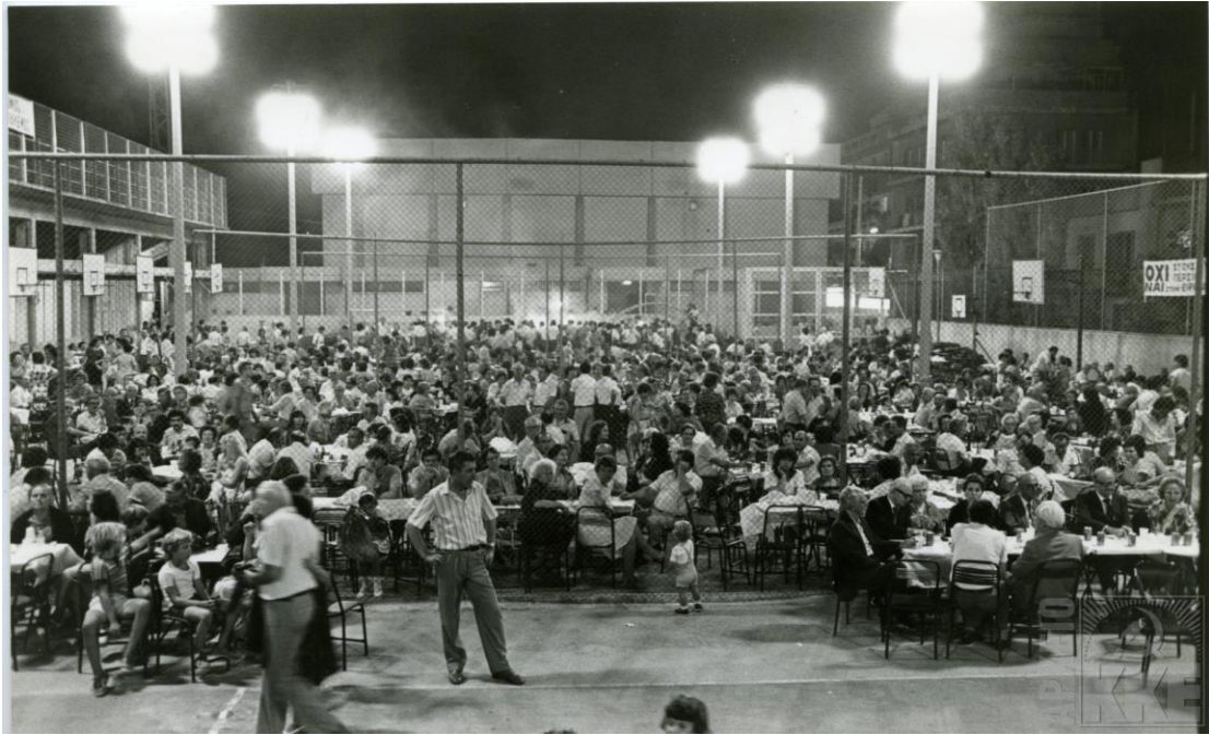
Εκδήλωση για τον επαναπατρισμό των πολιτικών προσφύγων, Αριθ. μητρώου 161