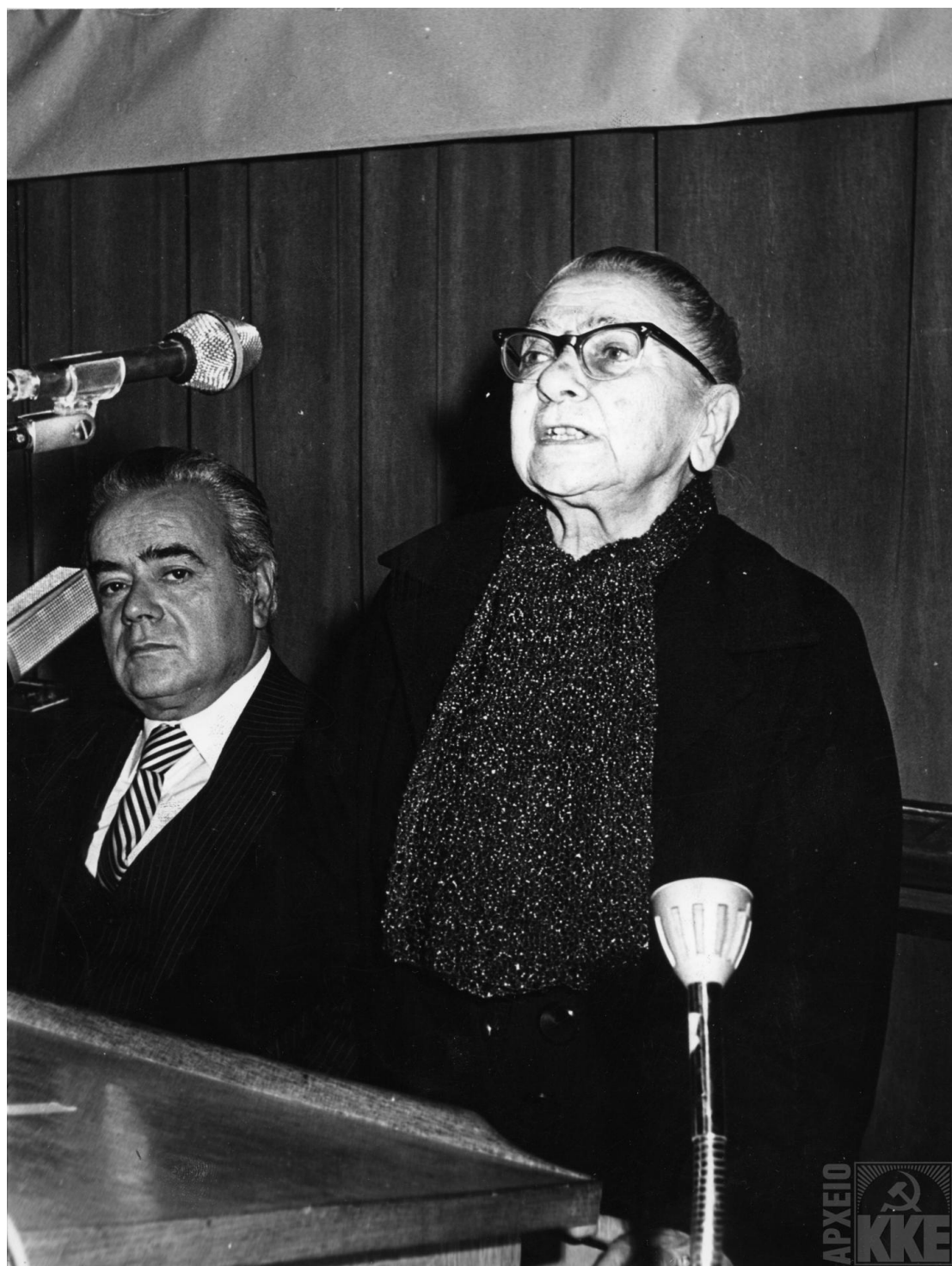
Η Έλλη Αλεξίου στο βήμα της Διεθνούς Διάσκεψης για τον επαναπατρισμό των πολιτικών προσφύγων στο Πολυτεχνείο, 15/10/1979