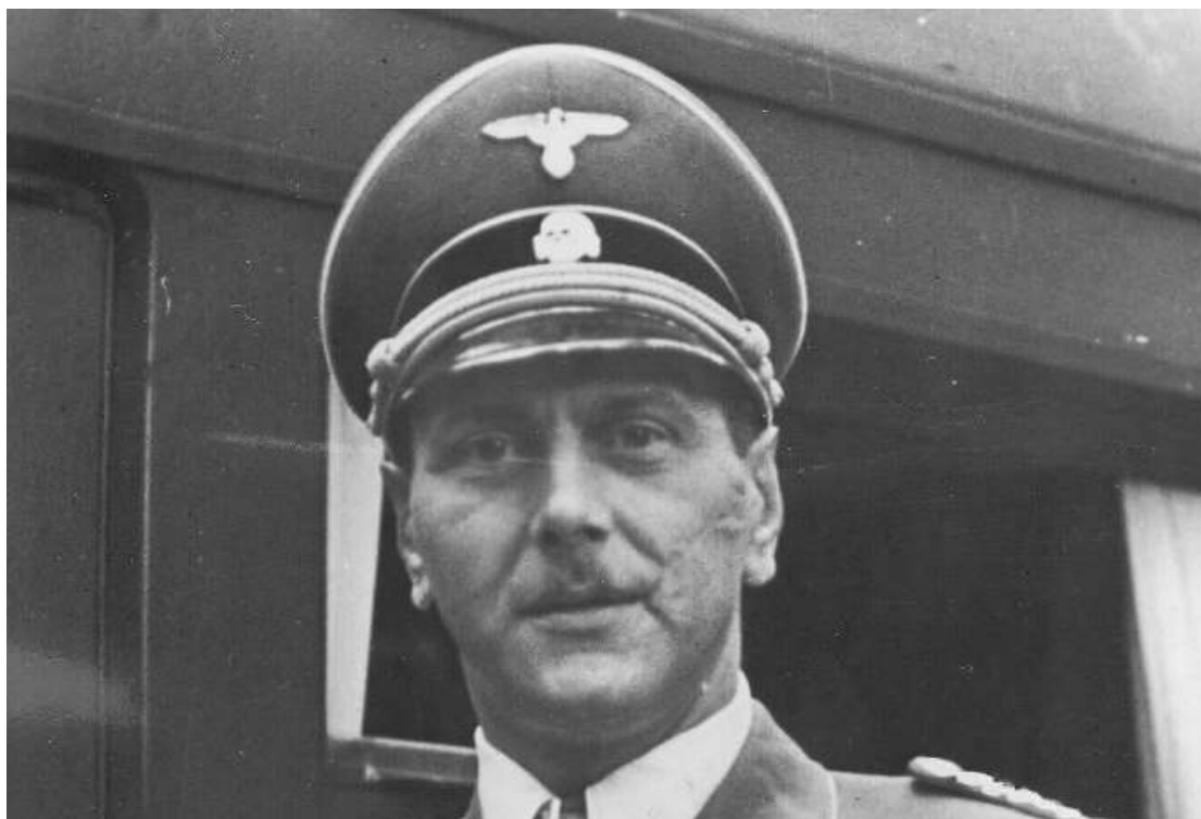
Εικόνα 11: Λοχαγός Otto Scornezy (Scarface).

για τον ίδιο λόγο ωστόσο ο ίδιος ο Hitler επέλεξε τον Scornezy για την διάσωση του Musollini καθώς πίστευε ότι η επιτυχής έκβαση και ανάπτυξη μελλοντικών στρατιωτικών επιχειρήσεων βασιζόταν στην συνεργασία Γερμανίας – Ιταλίας διαφορετικά οι επιπτώσεις θα ήταν ανυπολόγιστης σημασίας.