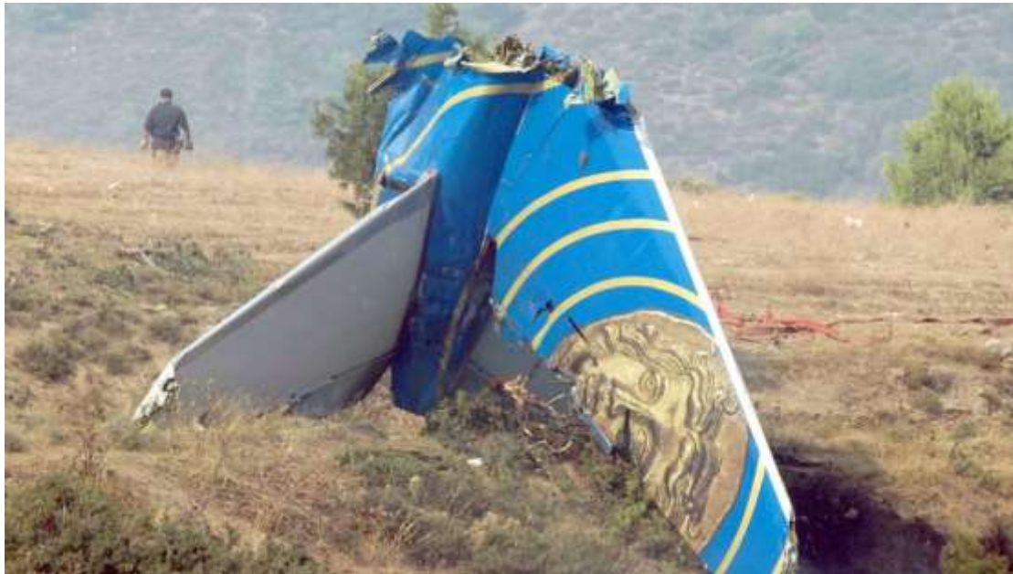
Εικόνα 5: Κάθετο σταθερό του αεροσκάφους της Helios Airways που συνετρίβη στις 14 Αυγούστου 2005.

απάντηση πέραν από μία κίνηση ανθρώπου στο θάλαμο διακυβέρνησης. Στη συνέχεια λόγω έλλειψης καυσίμου το αεροσκάφος της εταιρείας Helios συνετρίβη σε λοφώδη περιοχή πλησίον του Γραμματικού Αττικής. Ο δραματικός απολογισμός περιλάμβανε τον θάνατο 115 επιβατών και 6 μελών πληρώματος. Ωστόσο η αναφορά στο συγκεκριμένο παράδειγμα Ειδικής Επιχείρησης γίνεται γιατί από την αποστολή των F-16 γεννιούνται ερωτήματα. Ποιός ήταν ο σκοπός της αποστολής; Αν ήταν η αναχαίτιση δεν έγινε καμία αναχαίτιση ούτε καν αναγνώριση καθώς δεν υπήρξε καμία επικοινωνία. Το ΚΕΠ αθηνών κύρηξε Φάση Κινδύνου καθώς το αεροσκάφος ίπταται ανεξέλεγκτο χωρίς επικοινωνία. Ποιές είναι οι πραγματικές αποφάσεις και δράσεις που έπρεπε να πραγματοποιηθούν για ένα ανεξέλεγκτο αεροσκάφος, πλησίον της Αθήνας, παραμονή της Κοιμήσεως της Θεοτόκου, σε μία κατάμεστη Αθήνα υπό το πρίσμα των καλοκαιρινών διακοπών; Συνεπώς επειδή πολλά ερωτήματα γεννιώνται χωρίς ρεαλιστική απάντηση αντιλαμβανόμαστε ότι ο σκοπός της αποστολής δεν ήταν ξεκάθαρος και η αποστολή ήταν συνεχώς σε κίνδυνο (Πολίτης, 2019).