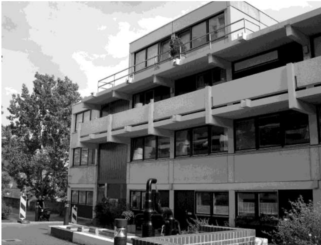
Εικόνα 3: Σύγχρονη εικόνα του κτιρίου που ήταν όμηροι οι Ισραηλινοί αθλητές.

πυροβολισμών μεταξύ των ελεύθερων σκοπευτών, των τρομοκρατών και της αστυνομίας, με αποτέλεσμα να τραυματίζονται και να σκοτώνονται και από τις δύο πλευρές. Αποτέλεσμα αυτών ήταν ο αρχηγός της τρομοκρατικής οργάνωσης να εκτελέσει όλους τους ομήρους και στη συνέχεια να σκοτωθεί και αυτός. Τα υπόλοιπα μέλη της τρομοκρατικής οργάνωσης παραδόθηκαν. Παρατηρούμε λοιπόν πως κάθε κίνηση των άπειρων αστυνομικών που ουδεμία γνώση δεν είχαν στο σχεδιασμό, την προετοιμασία και την εκτέλεση μίας Ειδικής Επιχείρησης, οδηγούσε στη δημιουργία πλεονεκτικών καταστάσεων για τους τρομοκράτες καταρρίπτοντας έτσι τη θεμελιώδη αρχή της ασφάλειας (Editors, The Munich Massacre: The History and Legacy of the Notorious Terrorist Attack on Israeli Athletes at the 1972 Summer Olympics, 2018).