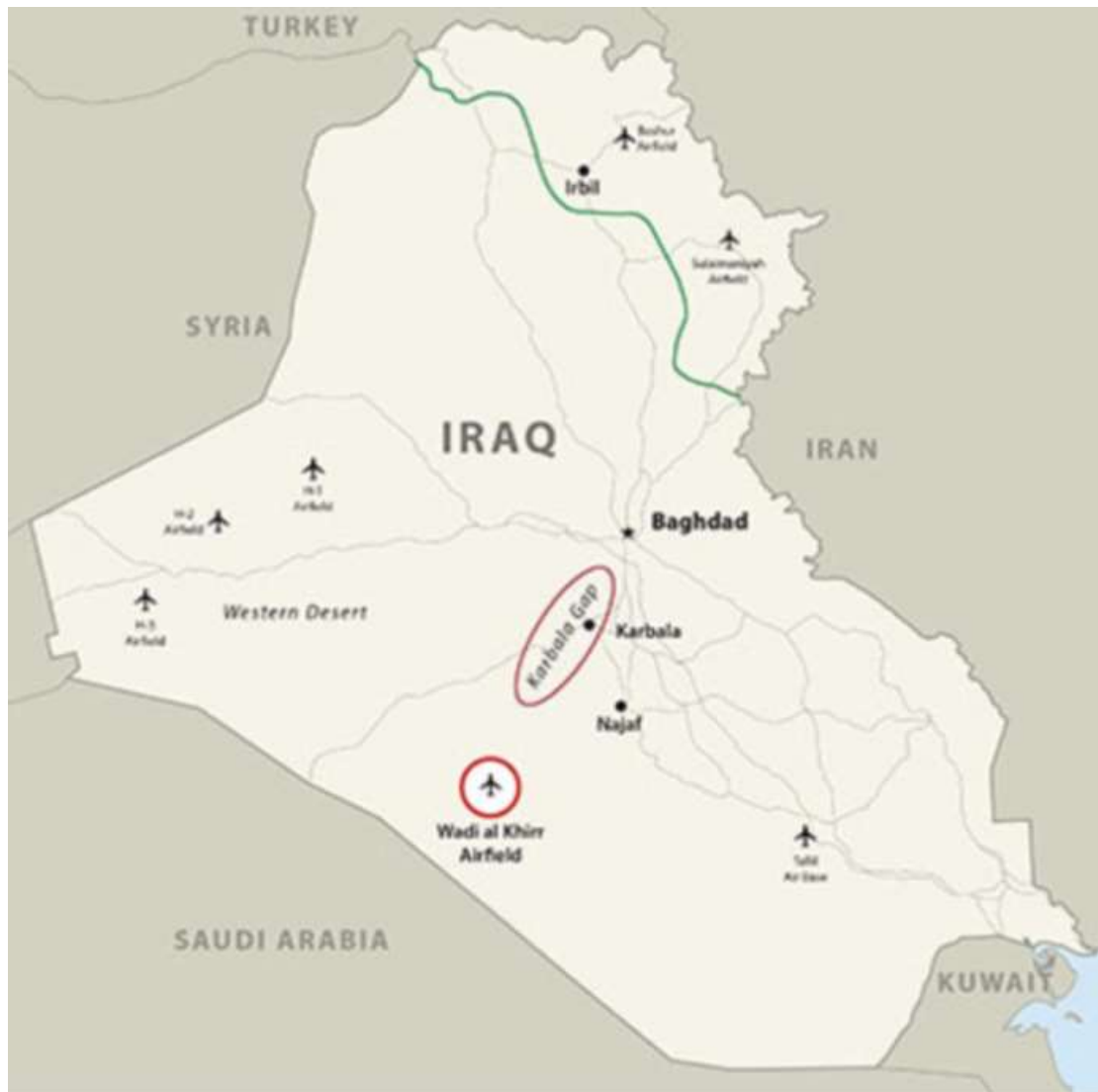
Εικόνα 6: Το αεροδρόμιο Wadi al Khirr, η στρατηγική τοποθεσία του σε κοντινή απόσταση από σημαντικές περιοχές του Ιρακ.

ερήμου χρησιμοποιήθηκαν για τις αποστολές αναγνώρισης, κατάλληλος εξοπλισμός για αποστολές δράσης. Γενικότερα στις αποστολές που πραγματοποιήθηκαν στο Ιράκ βασικός παράγοντας ήταν η διαθεσιμότητα των αεροσκαφών και αντιλαμβανόμεστε λοιπόν πόσο καίρια και αποτελεσματική ήταν σε στρατηγικό επίπεδο η δημιουργία, μέσω της ειδικής επιχείρησης αυτής, ενός αεροδρομίου σε κομβικό σημείο εντός ιρακινού εδάφους.