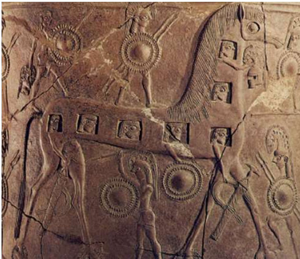
Εικόνα 4: Απεικόνιση του Δούρειου Ίππου σε πήλινο αγγείο.

κατασκεύασε ένα τεράστιο ξύλινο άλογο με κρυφούς εσωτερικούς χώρους. Ταυτόχρονα χαράχθηκε πάνω στο άλογο η επιγραφή «Έλληνες, Αθηνά χαριστήριον» υποδηλώνοντας ότι ήταν ένα δώρο καλής θελήσεως και ειρήνης από τους Αχαιούς, ενώ στην πραγματικότητα αποτελούσε μία κρύπτη στρατευμάτων μίας ειδικής ομάδας, ώστε την ώρα που ξεκουράζονταν οι Τρώες η ειδική ομάδα θα άνοιγε τις πύλες για να ξεκινήσει η σφαγή. Θα μπορούσαμε να χαρακτηρίσουμε την επιχείρηση υποδειγματικό παράδειγμα εξαπάτησης και κατ' επέκταση αιφνιδιασμού. Ακόμα και σήμερα η φράση «Δούρειος Ίππος» μας παραπέμπει σε έννοιες όπως δόλος, εξαπάτηση και στρατιωτικό τέχνασμα (Όμηρος, 2011).