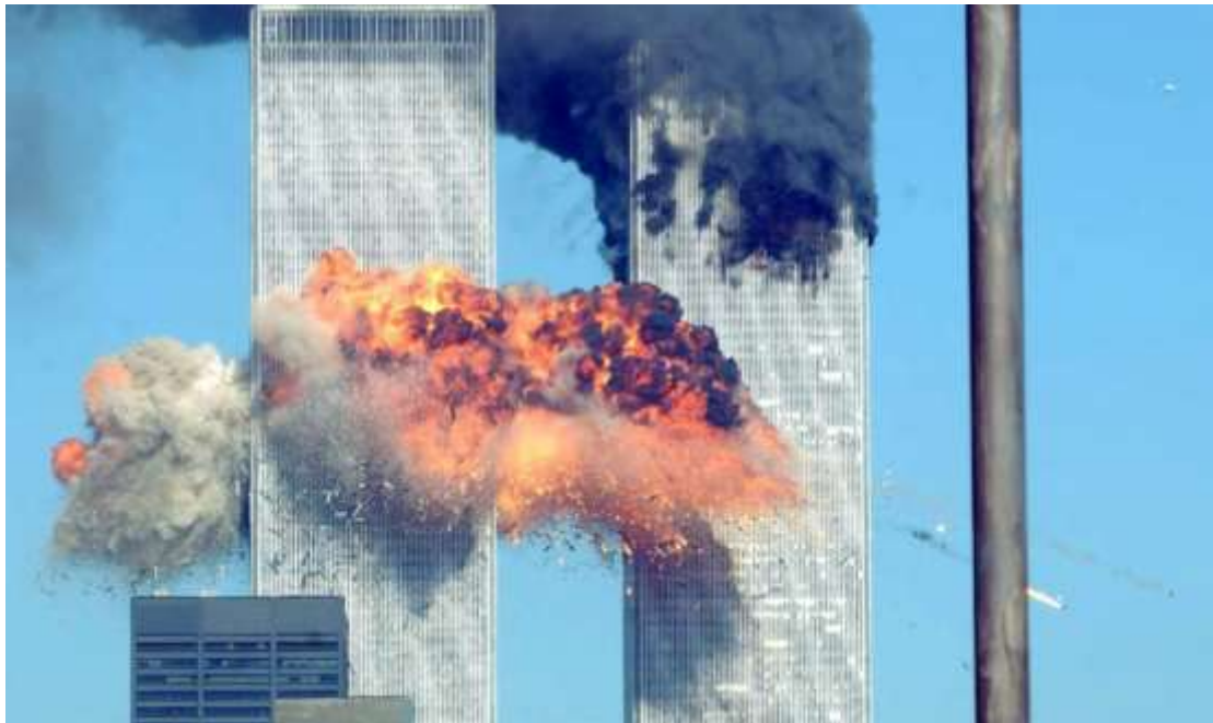
Εικόνα 7: Η τρομοκρατική επίθεση στους Δίδυμους Πύργους στις 11/9/2001.

Το κεφάλαιο αυτό θα επικεντρωθεί στην Ειδική Επιχείρηση «Enduring Freedom», μία επιχείρηση των Ειδικών Δυνάμεων των Ηνωμένων Πολιτειών κατά της τρομοκρατικής οργάνωσης Αλ Κάιντα στο Αφγανιστάν από τον Οκτώβριο του 2001 έως το Μάρτιο του 2002. Στην πραγματικότητα όλα ξεκίνησαν νωρίτερα με τις τρομοκρατικές επιθέσεις της 11 ης Σεπτεμβρίου του 2001 στο Πεντάγωνο καθώς και στο Παγκόσμιο Κέντρο Εμπορίου (World Trade Center) (POLICY, 2022). Ηγέτης της Αλ Κάιντα εκείνη την περίοδο ήταν ο γνωστός Osama Bin Laden, ο οποίος πίστευε ότι οι Αμερικανοί αδυνατούσαν να επιχειρήσουν αποτελεσματικά στο δικό τους πεδίο μάχης· η αλήθεια είναι ότι διαψεύστηκε και οι Αμερικανοί σε συνεργασία με τους Αφγανούς συμμάχους ανέτρεψαν τους Ταλιμπάν (Taliban). Ταυτόχρονα η Αμερική κύρηξε Παγκόσμιο Πόλεμο κατά της τρομοκρατίας και ανέδειξε την τεράστια δύναμή της με τη δυνατότητα της να επιχειρεί σε παγκόσμια εμβέλεια. Οι πρώτοι μήνες της Ειδικής Επιχείρησης ήταν και οι κρισιμότεροι καθώς πέραν απο το πολύπλοκο κομμάτι του σχεδιασμού υπήρχε το νέο στρατηγικό περιβάλλον στο οποίο έπρεπε να προσαρμοστούν, αντισυμβατικές δυνάμεις που έπρεπε να αντιμετωπίσουν και το βάρος της επίτευξης των εθνικών στόχων (Ripley, 2011).