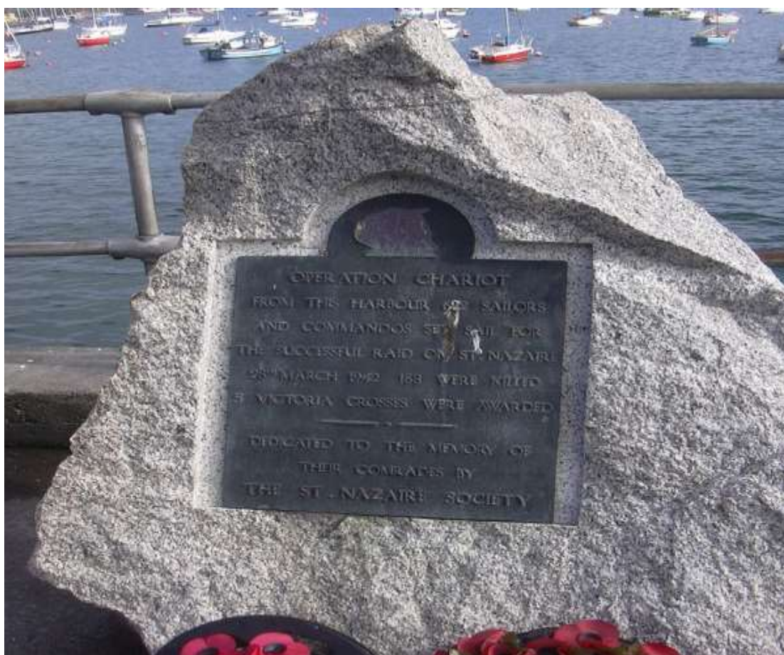
Εικόνα 2: Ιστορικό μνημείο στη μνήμη των θυμάτων της Επιχείρησης Chariot.

Η επανάληψη κατά τη διάρκεια εκτέλεσης ενός σχεδίου αρχικά ακονίζει τις ατομικές και μοναδιαίες δεξιότητες κάθε εμπλεκόμενου. Στη συνέχεια το δύσκολο των Ειδικών Επιχειρήσεων είναι η πλήρης διεξαγωγή και αλληλένδετη συνεργασία μεταξύ των μονάδων υπό πραγματικές συνθήκες. Υπάρχουν ιστορικές περιπτώσεις ειδικών επιχειρήσεων όπου η έλλειψη της επανάληψης κατά τη διάρκεια της προετοιμασίας οδήγησε σε μία πολύνεκρη επιχείρηση. Ένα τέτοιο παράδειγμα αποτυχίας αποτελεί η ειδική επιχείρηση «Chariot» ή «St.Nazaire Raid» όπου η προετοιμασία έδειχνε τις ελλείψεις των Βρετανών κατά των Γερμανών σε γαλλικό κατεχόμενο έδαφος στη διάρκεια του Δευτέρου Παγκοσμίου Πολέμου. Η φάση της προετοιμασίας έδειχνε τις ελλείψεις των Βρετανών ωστόσο κυριάρχησε το ρητό ότι οι κομάντος θα τα καταφέρουν. Το αποτέλεσμα ήταν από τους 612 άνδρες της αποστολής μόνο οι 228 να επιστοχωρήσουν από μία αποτυχημένη αποστολή ενώ 215 έμειναν κρατούμενοι και 169 σκοτώθηκαν. (Stasi, 2019).