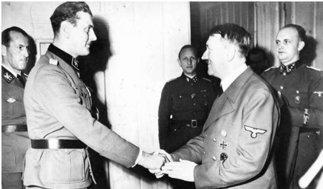
Εικόνα 12: Η βράβευση του Otto Scornezy από τον Hitler με το πέρας της επιτυχημένης επιχείρησης Oak.

γνωστό στρατηγό, τον Soleti όπου οι Ιταλοί καθώς τον αντίκρυσαν άφησαν τα όπλα τους και σχεδόν δεν αμύνθηκαν καν τις θέσεις τους. Ο Scornezy άμεσα αναζήτησε τον Musollini και καθώς τον απελευθέρωνε του εξομολογήθηκε τα σχέδια του Hitler. Ο Musollini ήταν πλέον ασφαλής σε γερμανικά χέρια. Το επόμενο μέρος του σχεδίου ήταν το πλάνο διαφυγής ωστόσο οι Ιταλοί στρατιώτες του ξενοδοχείου άρχισαν να αντιλαμβάνονται την κατάσταση και σιγά σιγά κάποιοι προσπάθησαν να αμυνθούν. Ωστόσο ο διοικητής των Ιταλών μετά από λίγα λεπτά παρέδωσε το ξενοδοχείο στους Γερμανούς. Το μόνο που έμενε στο σχέδιο ήταν πώς να φυγαδεύσουν πλέον τον Musollini. Ο μόνος τρόπος διάσωσης ήταν με αεροπλάνο το οποίο κατέφτασε μετά από εντολή του Scornezy. Στο διαθέσιμο αεροπλάνο επιβιβάστηκαν ο πιλότος, ο Musollini και παράτυπα σφήνα πίσω από το κάθισμα του Musollini ο Scornezy καθώς επιθυμούσε ο ίδιος να τον παραδώσει στο Hitler. Το αεροπλάνο με αυτοσχέδιο τρόπο κατάφερε να απογειωθεί και η διάσωση του Ιταλού Δικτάτορα ήταν επιτυχής. Η Επιχείρηση ολοκληρώθηκε όταν ο Scornezy παρέδωσε τον Musollini στον Hitler στη Βιέννη κι εκείνος με τη σειρά του τον τίμησε με τον χρυσό σταυρό του Ιππότη.