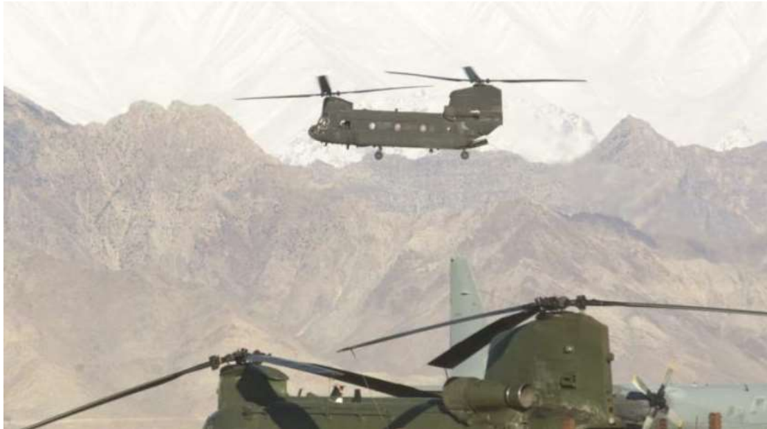
Εικόνα 9: Ελικόπτερα Chinook κατά την εξέλιξη της Επιχείρησης Anaconda.

Στις επόμενες δεκαοχτώ ώρες οι στρατιώτες προσπάθησαν να ξαναπάρουν τις χαμένες θέσεις αλλά κάθε προσπάθεια επέφερε μόνο θύματα χωρίς ουσιαστικά αποτελέσματα. Καθώς νύχτωνε οι εχθρικές δυνάμεις άρχισαν να υποχωρούν στις θέσεις οχύρωσής τους καθώς γνώριζαν ότι τα τεχνολογικά μέσα νυχτερινής όρασης που διέθεταν οι Αμερικανοί θα μπορούσαν να τους επιφέρουν μεγάλο πλήγμα. Επιπλέον παρατηρήθηκε ότι το κοντινό χωριό Marzak που βρίσκεται βορειοδυτικά ενεργούσε σε συνεργασία με την Αλ Κάιντα γι' αυτό και κηρύχθηκε εχθρικό από τον στρατηγό Hagenbeck. Βόρεια στις νυχτερινές ώρες ο διοικητής Zia γνώριζε ότι δεν πρόκειται να σημειώσει πρόοδο απέναντι στον εχθρό με αποτέλεσμα να είναι κοινή απόφαση όλων να υποχωρήσουν, να αναδιοργανωθούν και να επιστρέψουν άλλη μέρα για μάχη. Οι στρατιώτες τραυματισμένοι και κουρασμένοι φόρτωσαν τα φορτηγά που τους είχαν μείνει και επέστρεψαν στο Gardiz.