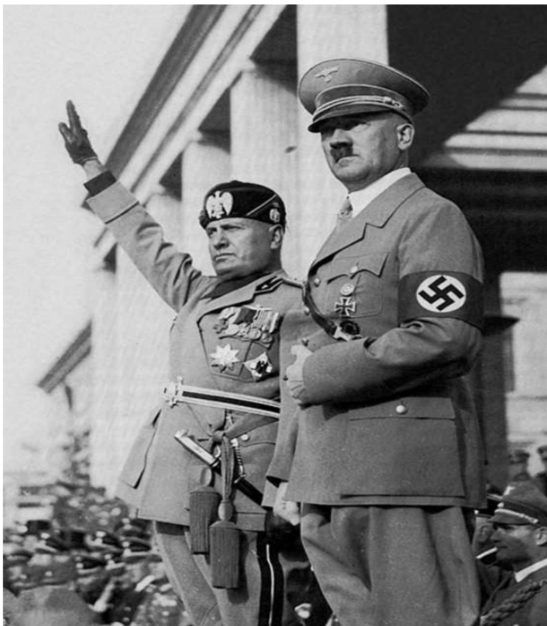
Εικόνα 10: Hitler (δ) και Musollini (α) κατά την επιθεώρηση στρατευμάτων.

Ο λοχαγός θεωρούνταν ήρωας των Ναζί καθώς είχε στο ιστορικό του μία σειρά από επιτυχημένες δύσκολες αποστολές. Εκτός από έμπειρος στρατιωτικός ήταν και μηχανικός καθώς είχε ολοκληρώσει τις σπουδές τους ως μηχανικός σε Πανεπιστήμιο της Βιέννης. Ο Scornezy είχε ένα χαρακτηριστικό σημάδι στο πρόσωπο, γι' αυτό είχε και το παρατσούκλι «scarface», το απέκτησε μικρός λόγω του χόμπι του στις ξιφομαχίες. Τον Ιούλιο του 1943 δόθηκε εντολή στον Scornezy να συναντήσει τον Hitler. Ο Λοχαγός παρόλο που είχε διαβάσει στις εφημερίδες για ανατροπή του Musollini ούτε που φανταζόταν μία τέτοια αποστολή διάσωσης. Φτάνοντας στο Rastenburg της Πρωσίας συναντήθηκε με ακόμα πέντε αξιωματικούς που είχαν κληθεί