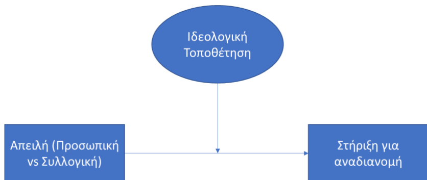
Σχήμα 2. Μοντέλο ρύθμισης της ιδεολογικής τοποθέτησης στην επίδραση του είδους της απειλής στην στήριξη για αναδιανομή πόρων.