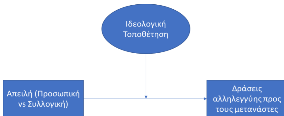
Σχήμα 4. Μοντέλο ρύθμισης της ιδεολογικής τοποθέτησης στην επίδραση του είδους της απειλής στις δράσεις αλληλεγγύης προς τους μετανάστες.