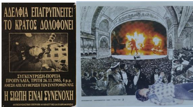
21 εικ. 4