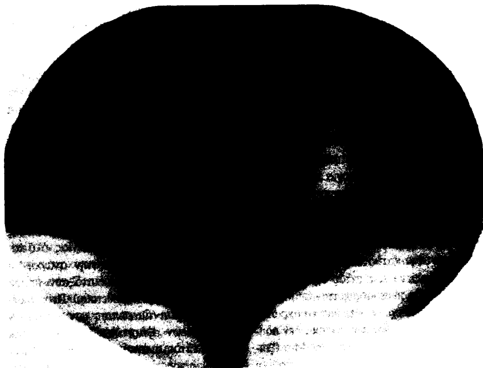
Τζώρτζια Ο' Κηφ, Κεραυνός πάνω από τη θάλασσα, 1922

Την οργή των παιδιών να φοβάστε και του μέλλοντος τους σπασμούς, αυτούς που ανορθόγραφα θροΐζουν στων «καταληπτικών» τις κρίσεις!