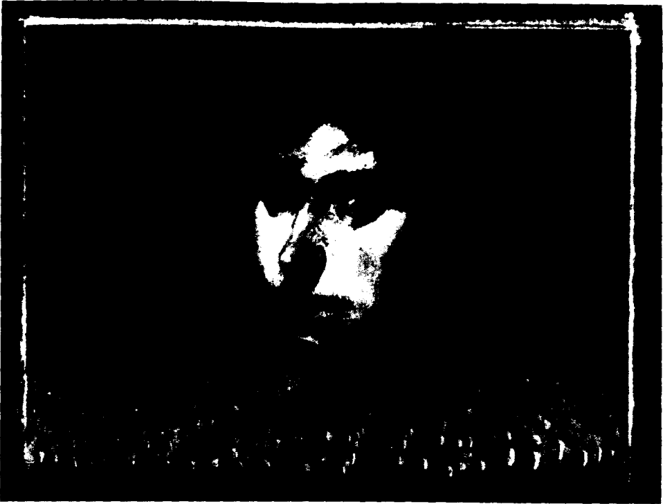
Ακρυγικό σε ξύλο. 30x40 cm. 1992