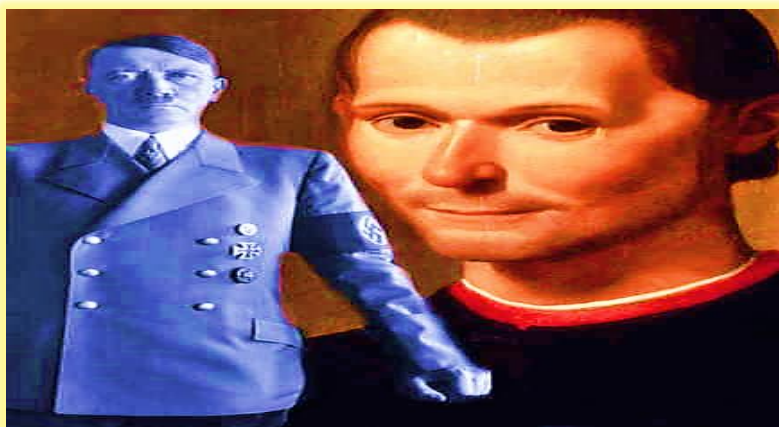
Εικόνα 16: Φίρερ: Ένας στυγνός εγκληματίας· ο πιο απάνθρωπος Ηγεμόνας που γνώρισε η ιστορία. Μακιαβέλι: Ένας παιδαγωγός ηγεμόνων που ασχέτως αν υπήρξε ένθερμος υποστηρικτής του Καίσαρα Βοργία, ποτέ δεν διέταξε να σφαιαστούν, θανατωθούν ή να βασανισθούν συνεργάτες του

Ο Χίτλερ «καλύπτεται» από τον «σκοπό που αγιάζει τα μέσα». Δηλαδή τα εγκλήματα που διαπράττει είναι θεμιτά για κάποιον ανώτερο σκοπό. Σκοπός του είναι η νίκη στο παιχνίδι διατήρησης της εξουσίας του, σκοπός που δικαιολογείται και είναι «αγιασμένος». Τα μέσα όμως στον βαθμό τον οποίο τα χρησιμοποιεί είναι απάνθρωπα, εξευτελιστικά για το ανθρώπινο υποκείμενο, εμποτισμένα με ένα νοσηρό φανατισμό.