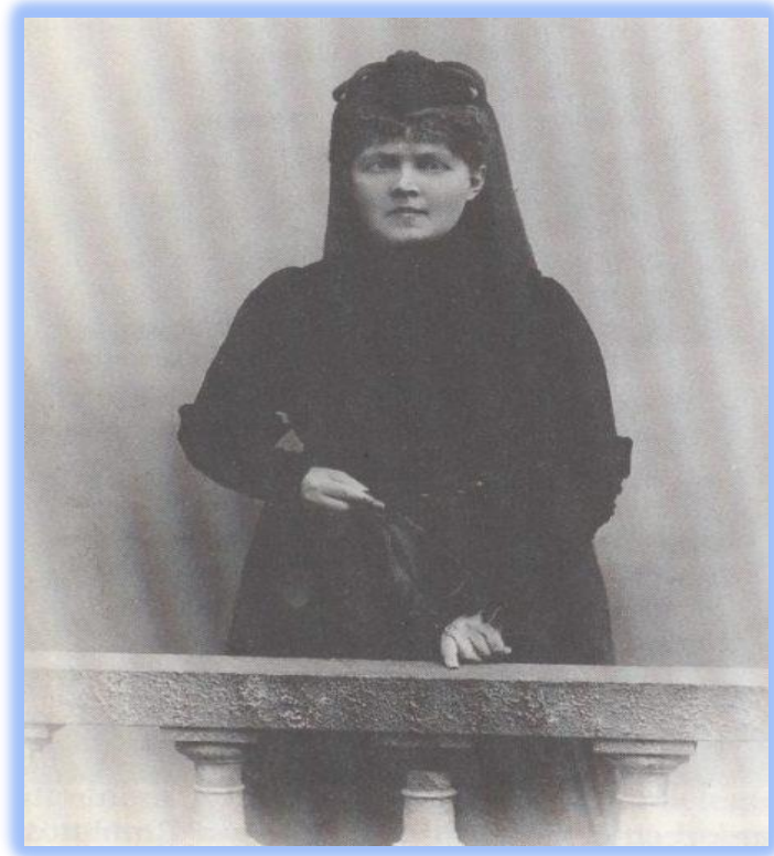
Εικόνα 15: Ελίζαμπεθ Φέρστερ Νίτσε. Η γυναίκα που συντέλεσε περισσότερο στην παραχάραξη της νιτσεικής φιλοσοφίας