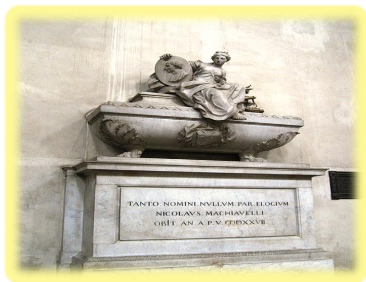
Εικόνα 2: Ταφικό μνημείο στο Πάνθεον της Santa Croce Φλωρεντίας (1787): «Κανένα εγκώμιο δεν είναι αντάξιο για ένα τόσο μεγάλο όνομα»

Θα αρρωστήσει βαριά και θα πεθάνει από έλκος στο στομάχι στις 22 Ιουνίου του 1527, ενώ η γυναίκα του θα αναλάβει με δυσκολία την ανατροφή των πέντε παιδιών τους. Το όνομα όμως και τα έργα του Μακιαβέλι θα μείνουν στην αιωνιότητα και θα τον αναδείξουν σε έναν από τους σημαντικότερους πολιτικούς στοχαστές, στον πρωτεργάτη της νεότερης πολιτικής 10 σκέψης και της πολιτικής θεωρίας.