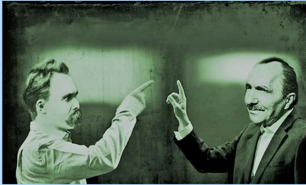
Εικόνα 14: Ο Καζαντζάκης ταυτίστηκε με το πρόσωπο και τη σκέψη του Νίτσε

φασιστικής Ιταλίας αλλά και της ναζιστικής Γερμανίας αποτελούν αυθεντικά πρότυπα του Υπερανθρώπου. 142