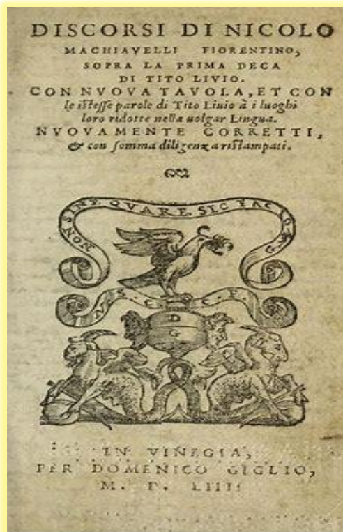
Εικόνα 3,4,5,6: Τα κυριότερα έργα του Μακιαβέλι (από αριστερά προς δεξιά): α) Οι λόγοι πάνω στα δέκα βιβλία του Τίτου Λίβιου , β) Ο Ηγεμόνας , γ) Μανδραγόρας , δ) Η Τέχνη του πολέμου .