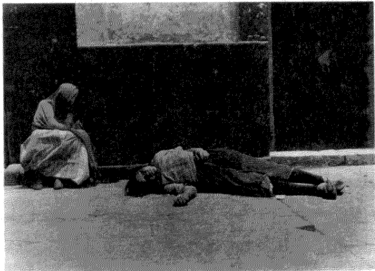
α. Φτώχεια και κομψότητα, Τ.Μ., 1928 β. Σκηνή του δρόμου, Τ.Μ., 1928