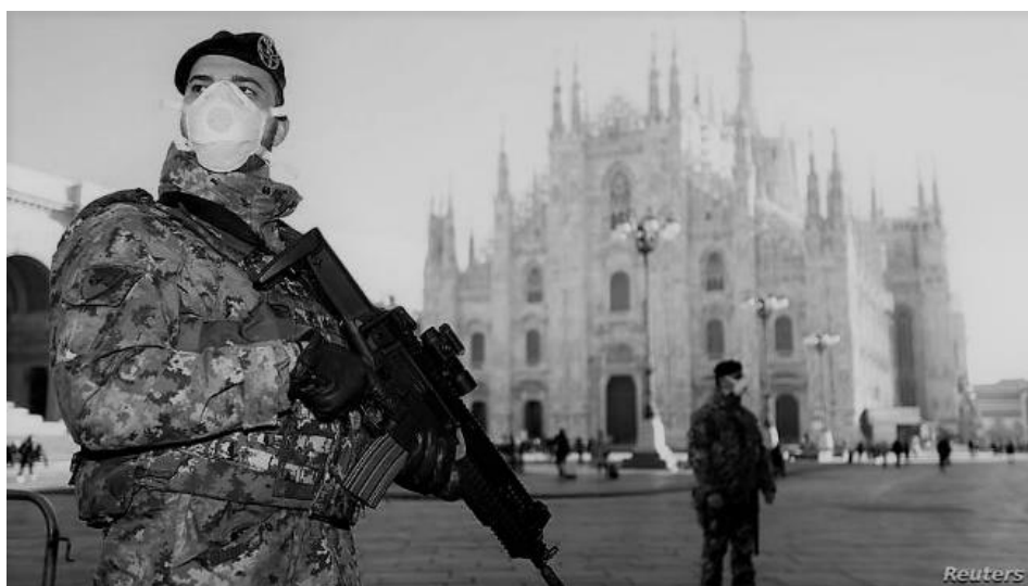
Στρατιώτες με προστατευτικές μάσκες στο κέντρο του Μιλάνου επιτηρούν την απαγόρευση κυκλοφορίας μετά το ξέσπασμα της πανδημίας του SARS-CoV-2. Ιταλία, 24 Φεβ. 2020.

Όλα τα παραπάνω ζητήματα, θα απασχολήσουν την εργασία αυτή, στοχεύοντας σε μία, όσο το δυνατόν, αποσαφήνιση των δεδομένων και των αιτημάτων της κοινωνίας που κινούνται ανάμεσα στην επιστήμη και την πολιτική υπό ένα κοινωνικοπολιτικό πρίσμα. Τα συμπεράσματα που ενδεχομένως θα προκύψουν, ίσως μας δώσουν τη δυνατότητα να καταλάβουμε λίγο περισσότερο τα όποια νέα σημεία θα καθορίσουν τη ζωή μας στο μέλλον και ποια θα είναι τα κατάλοιπα τού σήμερα στον τρόπο που η επόμενη γενιά θα κατανοεί τη Δημοκρατία και τον κοινωνικό βίο, αλλά και τη σημασία του κράτους, ως παράγοντα κοινωνικής ευημερίας.