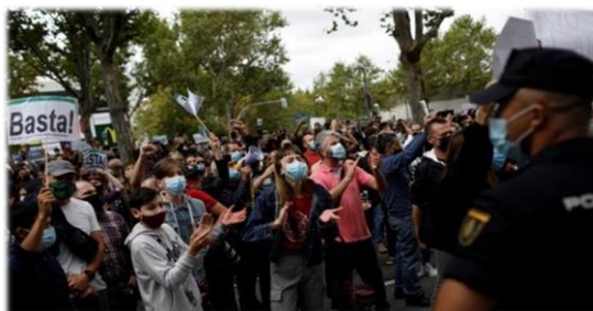
Basta! Διαδηλωτές στο προάστιο Βαγιέκας της Μαδρίτης, κατά των κατ' εξαίρεση περιοριστικών μέτρων. Φτάνει!

Όλες οι παραπάνω περιπτώσεις, αποδεικνύουν την προσπάθεια επιβολής με πρόσημα την αντιμετώπιση της πανδημίας, με ταξικά ή εθνικιστικά κριτήρια. Μία πραγματική κατάσταση υγειονομικού κινδύνου, αναγνωρίζεται ως ευκαιρία επανακαθορισμού των εθνικών και οικονομικών ισορροπιών σε παγκόσμια κλίμακα, επιβεβαιώνοντας, ίσως, τη φράση του H. L. Mencken ότι, το πάθος να σώσεις τον κόσμο είναι σχεδόν πάντα το προσωπίο του πάθους να τον εξουσιάσεις.