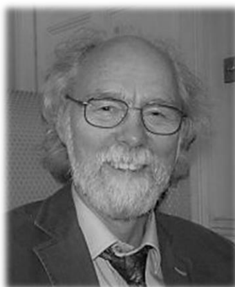
Barry Buzan 24

Τα πρωτόγνωρα μέτρα περιορισμού για τη διασφάλιση της δημόσιας υγείας, πυροδότησαν σειρά αντιπαραθέσεων που σχετίζονται με, τα δικαιώματα, τις ατομικές ελευθερίες, τη βιοπολιτική, αλλά και το ταξικό πρόσημο που φαίνεται να έχουν, τονίζοντας την ανάγκη επαναδιευθέτησης της σχέσης εξουσίας ανάμεσα στους κυβερνώντες και τους κυβερνωμένους. Σχεδόν 260 χρόνια από το Κοινωνικό Συμβόλαιο του Ζαν- Ζακ Ρουσσώ, φαίνεται ότι οι όροι πρέπει να διατυπωθούν και πάλι σε νέες βάσεις ώστε, οι σύγχρονες φιλελεύθερες δημοκρατίες να αποφύγουν τη διολίσθηση προς τον αυταρχισμό, που, ενδεχομένως, τις οδηγεί ο φόβος της κατάρρευσης.