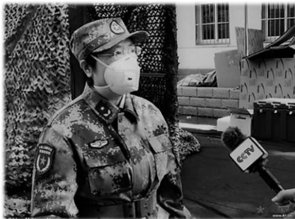
Η Υποστράτηγος Τσεν Γουέι της Ακαδημίας Στρατιωτικών Ιατρικών Επιστημών της Κίνας, έχει οριστεί ως επικεφαλής της ερευνητικής ομάδας κατά του SARS-CoV-2.

Ανάλογα με τον τόπο και τον χρόνο, κάποτε, ο δολοφόνος ήταν ο αλλοεθνής ή ο αλλόθρησκος, ο ταξικός εχθρός, ο μετανάστης. Αργότερα, ο απρόσωπος τρομοκράτης και οι φονταμενταλιστές, ενώ σήμερα είναι ο ιός και η πανδημία. Όλες, περιπτώσεις που δικαιολογούν έκτακτα μέτρα και εξαιρετικές καταστάσεις προσωρινού χαρακτήρα, που μετά το πέρας της απειλής θα πάνε να ισχύουν και θα συνεχιστεί η απρόσκοπτη πορεία της κοινωνίας προς την ευημερία, της οποίας η διαφύλαξη άλλωστε, είναι πάντα το επίδοκο. Όμως, ως γνωστόν, ουδέν μονιμότερον του προσωρινού.