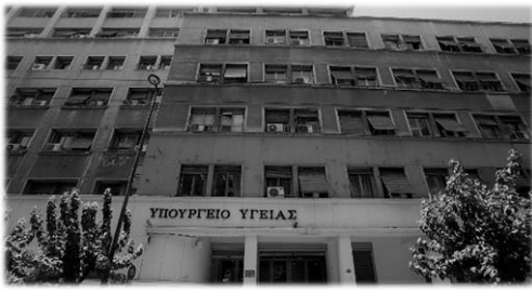
Το μέγαρο του Υπ. Υγείας επί της οδού Αριστοτέλους 17. Αθήνα.

Από τότε που οι άνθρωποι συγκρότησαν τις πρώτες οργανωμένες κοινότητες, οι αναγκαιότητες της συνύπαρξης, αλλά και η συσσώρευση της γνώσης, εκλογίκευσαν τη φυσική κατάσταση τού ανθρώπου, μέσα απ' την οριοθέτηση των βιολογικών αναγκών και των βεβαιοτήτων που έθετε ο θνητός βίος. Η ανάπτυξη κοινωνικών και πολιτισμικών προτύπων που σχετίζονταν με τη ζωή, την ασθένεια και τον θάνατο, έθεσε τις βάσεις γι' αυτό, που πολύ αργότερα, θα αναγνωριζόταν ως βιοπολιτική. Η βιοπολιτική ως έννοια είναι αυτή που χαρακτηρίζει τις εφαρμοσμένες πολιτικές, που στοχεύουν στην αντιμετώπιση των προβλημάτων, τα οποία προκύπτουν όταν οι άνθρωποι συγκροτούν ένα συμβιωτικό σύνολο.