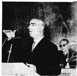
Ὁ Ἀντιπρόεδρος τῆς Ἐθνικῆς Κυβερνήσεως καὶ ὑπουργὸς Ἐσωτερικῶν κ. Στὺλ. Παττακοῦ, κηρύσσων τὴν ἐναρκίαν τῶν ἐργασιῶν τοῦ δημοτικῆς συμβουλίου τοῦ Ἀθηνῶν.

Ο ἈΝΤΙΠΡΟΕΔΡΟΣ τῆς Κυβερνήσεως καὶ ὑπουργὸς τῶν Ἐσωτερικῶν κ. Στ. Παττακοῦ, λαβὼν τὸν λόγον μετὰ τῶν ὁμιλιῶν, ἐπέδειξεν τὸ δημοτικὸν συμβούλιον ὅτι ἡ Κυβέρνησις ἐγκρίθει κατ' ἀρχὴν τὴν ἀπερίοριστον καὶ ἀνὴ τῆς μελοποιημένης ἀφῆσεως τοῦ ὄρους τῶν οἰκοδομῶν τῆς Πρωτεύουσας, τὸν ὅτι ἐπὶ τοῦ σημείου αὐτοῦ ὁπόσοι ἐπὶ τῶν ἄλλων τῶν μελῶν τῆς Κυβερνήσεως, τὸ πρόβλημα τῶν ἰσθμῶν τῶν οἰκοδομῶν εἶναι πῶς πολλὰ σοβαρῶν καὶ ἐξῆς, προσέβη ὁ κ. ἀντιπρόεδρος, εἶχε ὁμοίως καὶ πολλὰς ἑρωτήσεις καὶ ἀντιπερὶ τὴν ἀπερίοριστον καὶ ὄχι ἐπιδομένην ἀφῆσιν, συμπεράσματα ἐπὶ διακοσμητῶν ἀσκήσεων. Ἐσχίοντο μὲν χειροκροτήσεων αἱ ἐπιτελούμενοι γωνεῖ