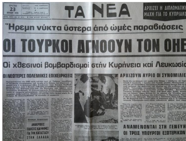
«Τα Νέα», 23 Ιουλίου 1974