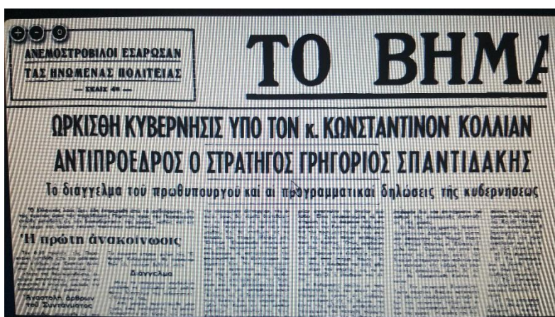
Πρωτοσέλιδο του «Βήματος». 23 Απριλίου 1967

Ήδη από τις πρωινές ώρες τις 21ης Απριλίου ο ελληνικός λαός είχε ενημερωθεί από τον ραδιοφωνικό σταθμό των ενόπλων δυνάμεων για την ανατροπή του καθεστώτος και τη μεταβολή στη διακυβέρνηση της χώρας. Οι εξαγγελίες των πραξικοπηματιών δημοσιεύτηκαν σε εκτενή πρωτοσέλιδα εφημερίδων, προσανατολισμένων κυρίως στον χώρο της δεξιάς. «Το Βήμα», ως μια εφημερίδα κεντρικών πολιτικών καταβολών ήδη πριν από τη χούντα, ανέλαβε τον ρόλο ιδεολογικού φερεφώνου και υποστηρικτικού βραχίονα, με συγκρατημένες αλλά θετικές προς το καθεστώς δηλώσεις. Οι πρώτες δημοσιεύσεις που ακολούθησαν το πραξικόπημα είχαν περιεχόμενο κυβερνητικών δηλώσεων και επευφημιών προς το νέο «πολιτικό» σχήμα, ενώ ταυτόχρονα διακρινόταν και ένας τόνος αποδοχής από το δημοσιογραφικό προσωπικό.